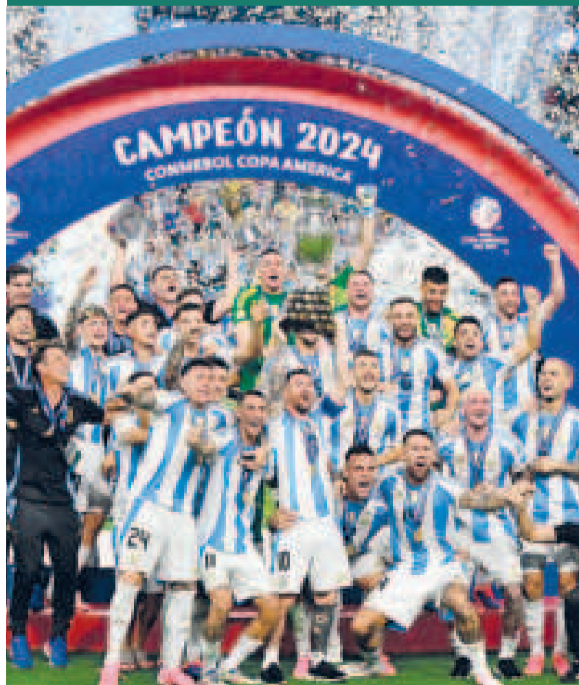
Jugadores de la selección argentina celebran la conquista de la Copa América 2024.

El ciclista esloveno Tadej Pogacar, ganador de la triple corona, con el Tour de Francia, el Giro de Italia y el título mundial en el mismo año, acabó en la tercera plaza con 294 puntos.