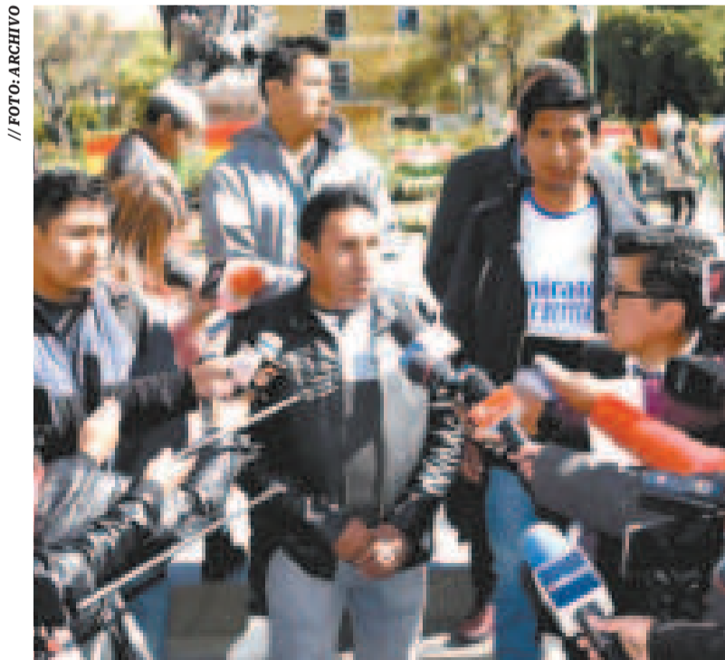
Exdirigentes del trópico de Cochabamba en conferencia, en La Paz.

“Hay alcaldías evistas que frenaron proyectos. Evo Morales instruyó a alcaldes que no firmen convenios para obras. En estos momentos existen cinco proyectos con presupuesto, que son de necesidad de las poblaciones y de las organizaciones sociales, pero no quieren aprobarlos”, acusó Mamani.