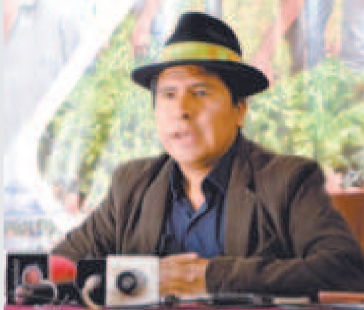
El viceministro de Desarrollo Agropecuario, Álvaro Mollinedo.

Los lotes de arroz que sean transportados sin este documento serán decomisados por el Viceministerio de Lucha Contra el Contrabando (VLCC) y entregados a la Empresa de Apoyo a la Producción de Alimentos (Emapa) para su comercialización.