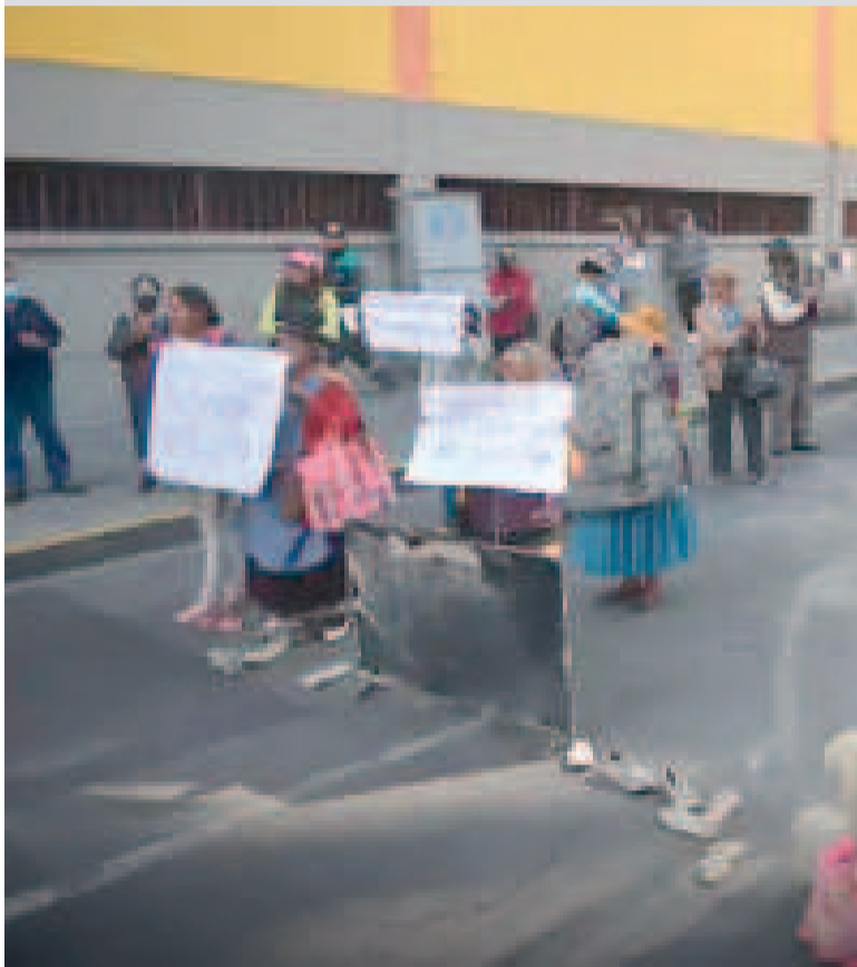
Protestas protagonizadas por los vecinos de Bajo Llojeta.