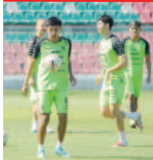
Jugadores de la Sub-20 en la práctica en el 'Tahuichi'.

Bolivia está emparejada en el Grupo B junto a las selecciones de Argentina, Brasil, Ecuador y Colombia. En tanto, la serie A está integrada por Venezuela, Perú, Paraguay y Chile. La Verde debutará el 24 de enero frente a Ecuador.