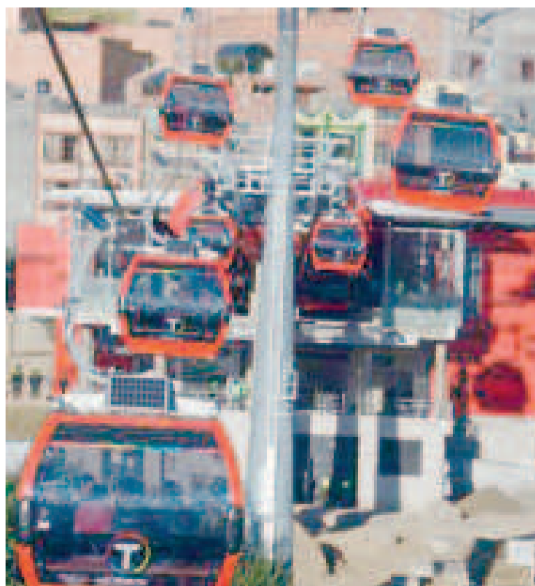
Cabinas de la Línea Roja de Mi Teleférico en funcionamiento.