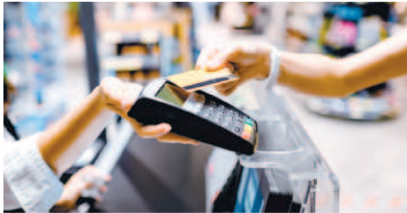
El pago de una compra mediante tarjeta de débito.

Según empresas de ciberseguridad, se conoce de al menos siete tipos de ciberataques que generan preocupación en grandes empresas y entidades financieras, pero entre los más destacados están el Ransomware y el Phishing, ambos categorizados como formas de