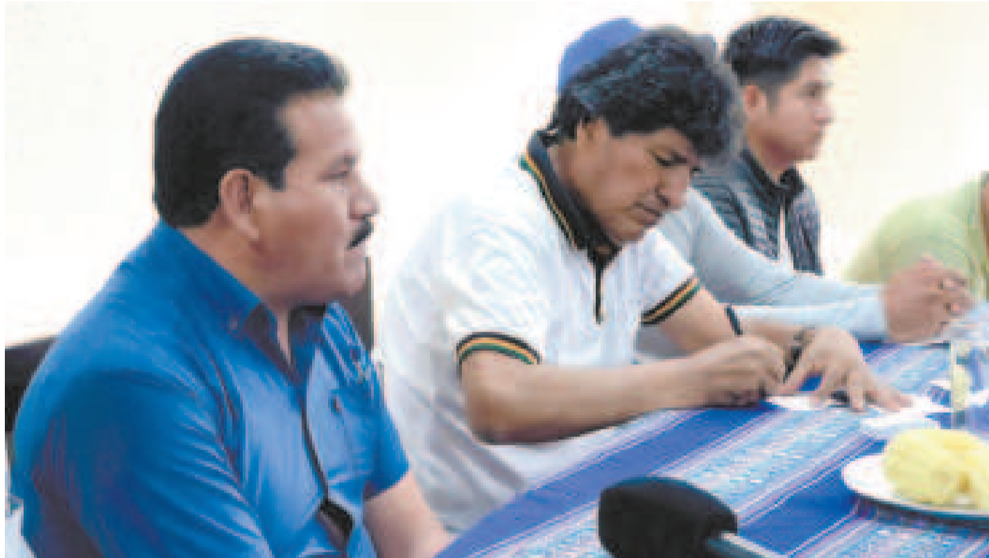
El expresidente del Estado Evo Morales, quien permanece en el trópico de Cochabamba.

La Fiscalía reiteró que solicitará la detención preventiva de los acusados para garantizar el desarrollo de las investigaciones.