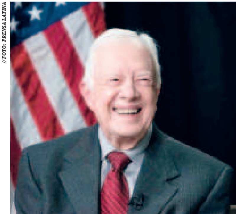
El expresidente de los Estados Unidos, James Earl Carter (+).