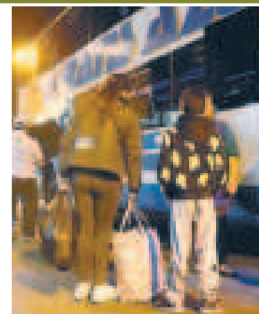
Operativos de control en las terminales.

Sin embargo, el jefe policial aseguró que en las próximas horas darán con otros cómplices de la banda delictiva en relación con el robo en la zona Sur.