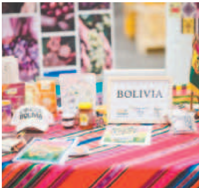
Parte de los productos de la oferta exportable del país.