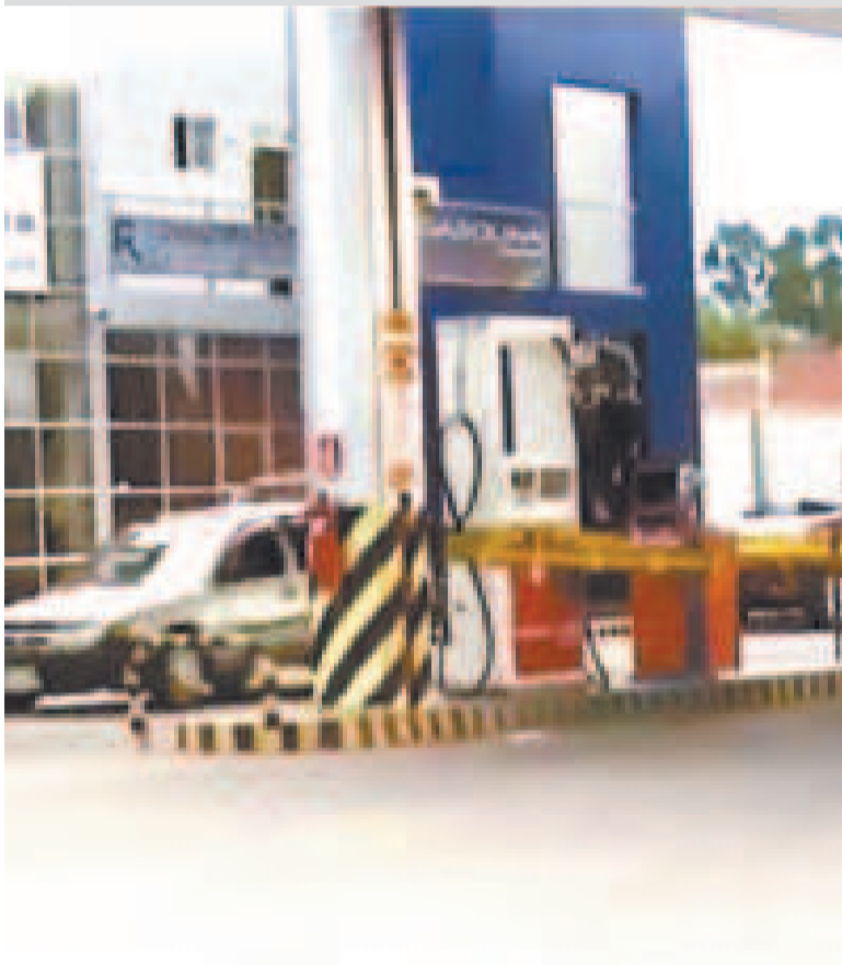
La estación de servicio en Tiquipaya quedó precintada.