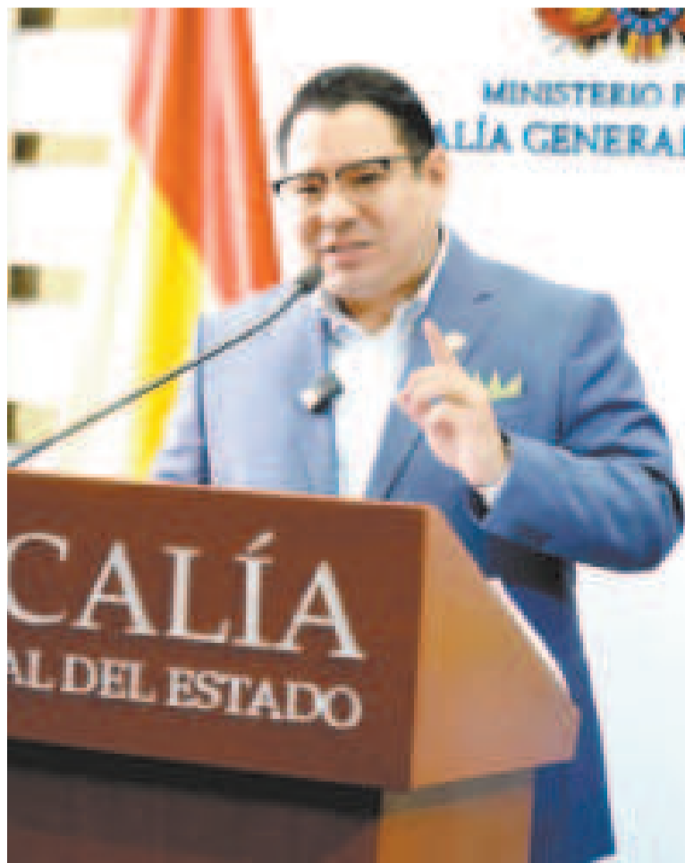
El fiscal general del Estado, Roger Mariaca, durante una conferencia de prensa.