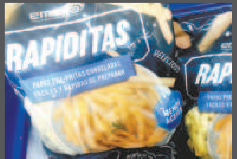
Rapiditas, el producto transformado de la Planta de Papa de El Alto.

“Es el Año del Bicentenario y debemos reafirmar la unidad para hacer realidad la industrialización, y como sector tenemos que reforzar este sueño que encara el presidente Luis Arce”, dijo.