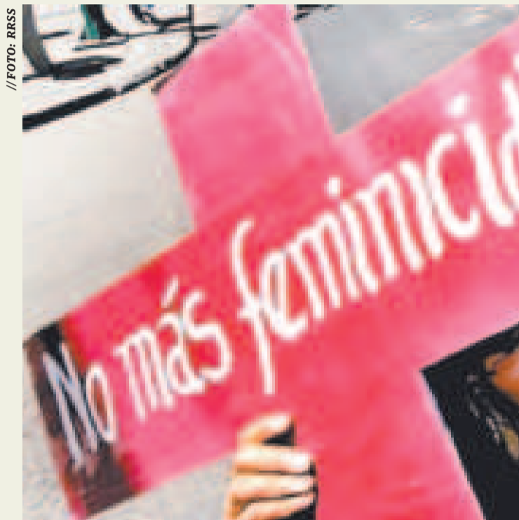
Protestas contra los feminicidios.