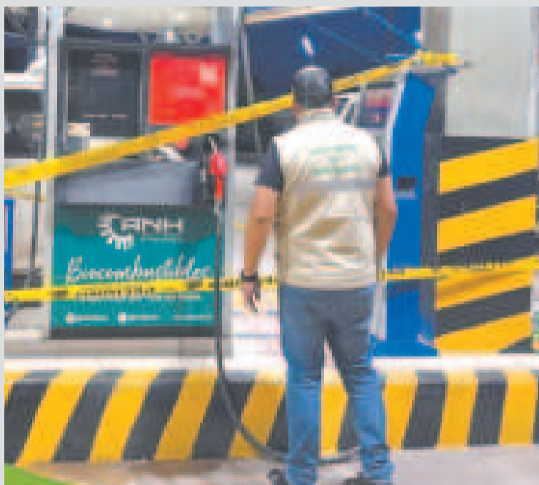
Precintan un surtidor de gasolina en Cochabamba.