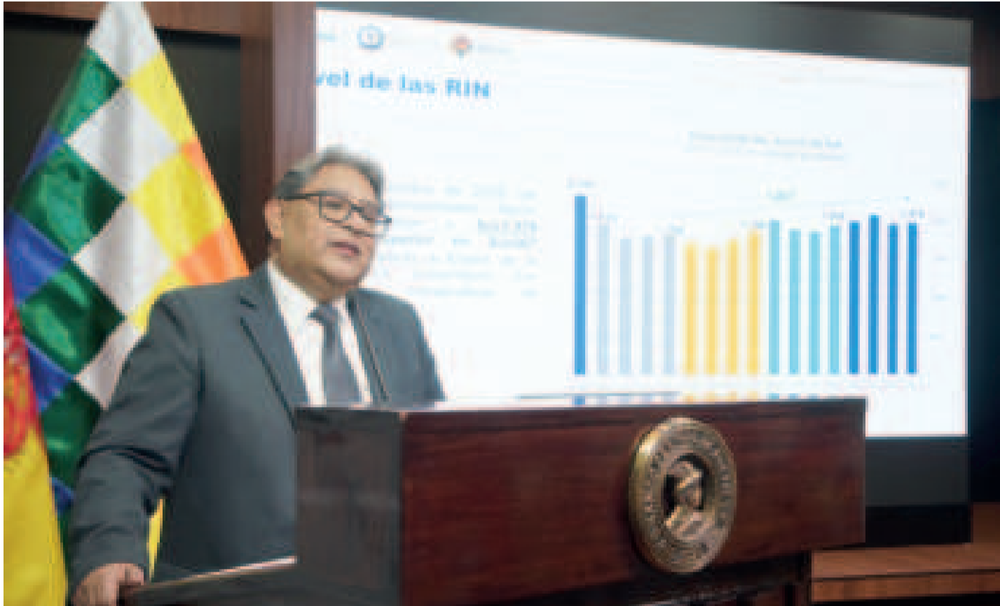
El presidente del Banco Central de Bolivia (BCB), Edwin Rojas, durante la difusión de las RIN.