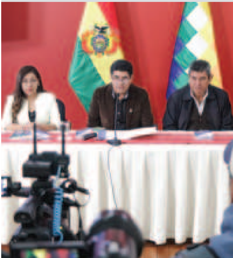
El ministro Omar Véliz, junto a los tres viceministros del área, en conferencia de prensa.