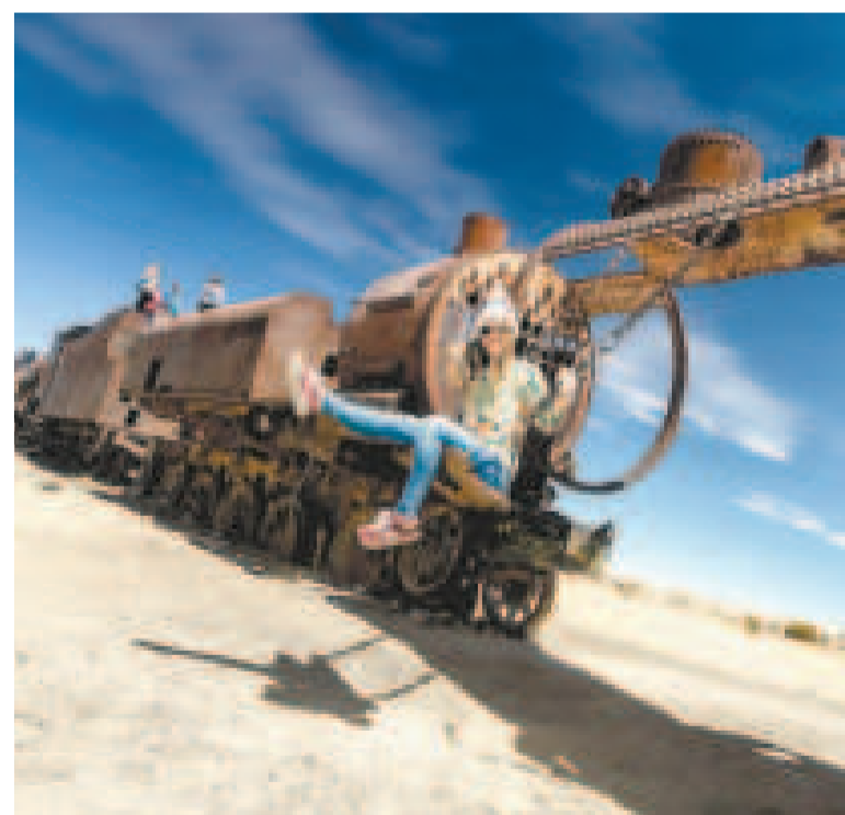
Una turista en el Cementerio de Trenes de Uyuni, Potosí.

Luis Arce Catacora Presidente del Estado