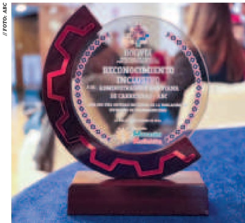
El galardón entregado a la ABC.