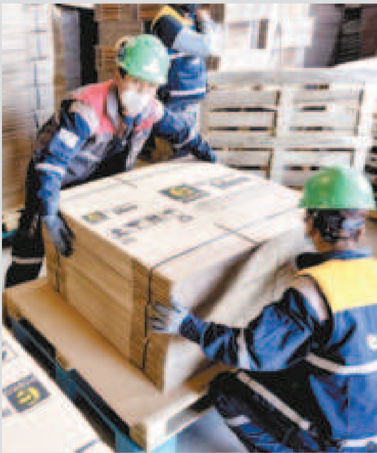
Trabajadores empacan cartón para exportación.