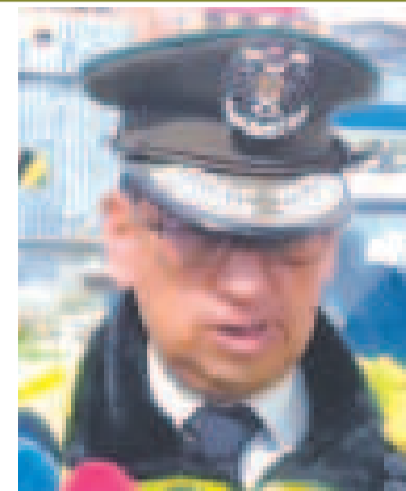
Coronel Miguel Zambrana.

El feminicidio de Sandra es, por el momento, el primero que se comete en el país este año. De acuerdo con datos oficiales de la Fiscalía General del Estado, en 2024 se registraron 84 feminicidios entre los nueve departamentos del país.