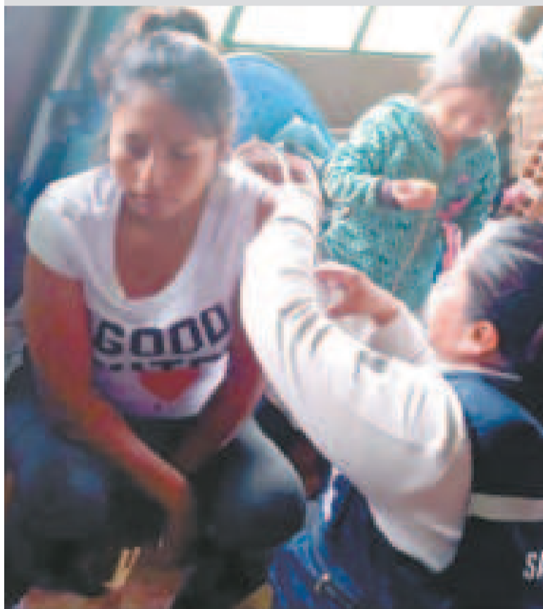
Una mujer recibe una vacuna en el departamento de Santa Cruz.