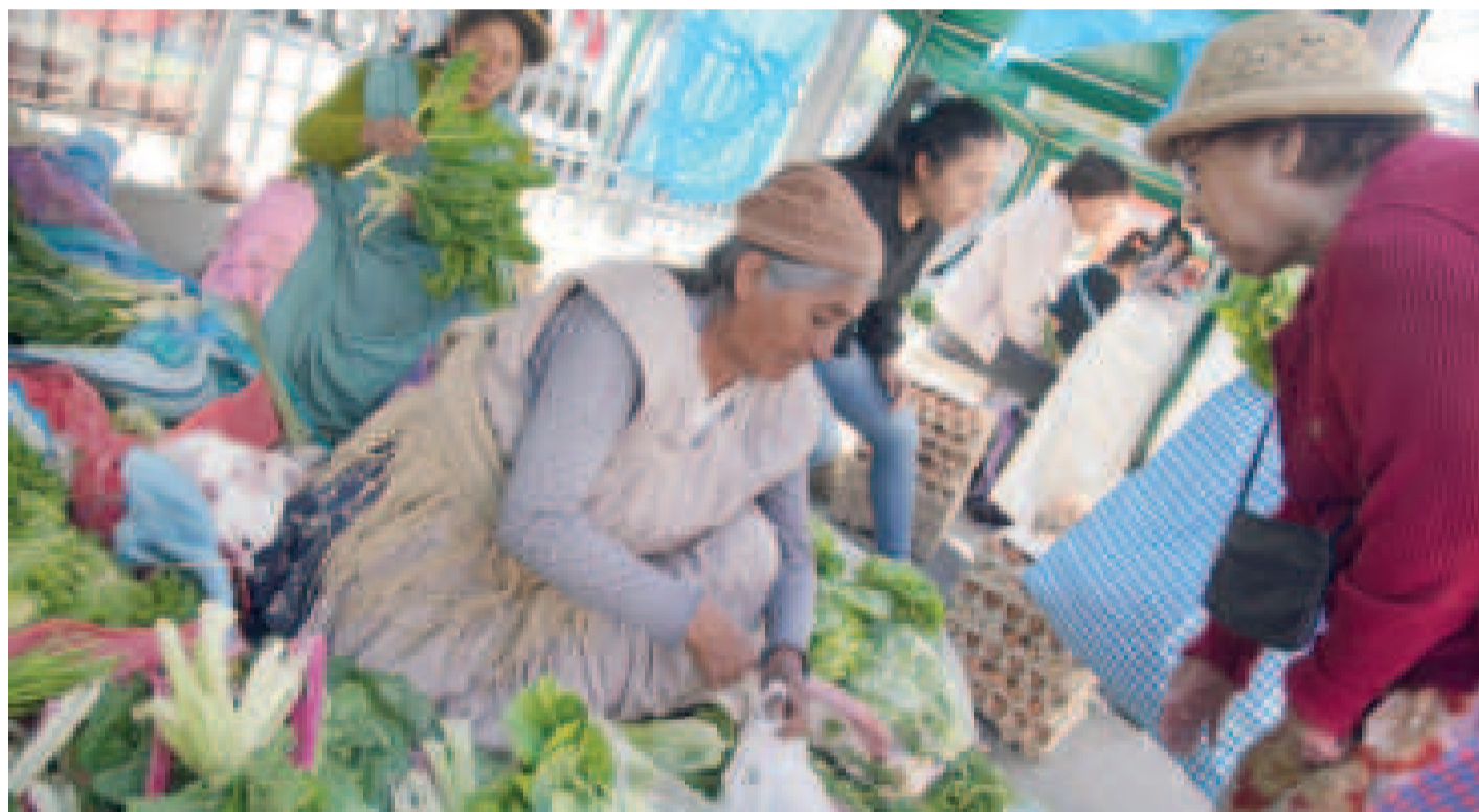
Los productores ofertan los alimentos directamente a los consumidores.

El presidente Arce destacó que en estos espacios se comercializaron 855 toneladas de alimentos esenciales en todo el territorio nacional.