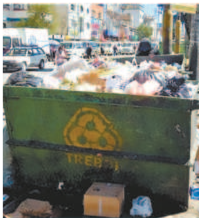
Un contenedor lleno de basura en la Ceja de El Alto.

El secretario municipal de la ciudad de El Alto informó que la empresa de recolección de basura Trebol, cumplió con la recolección correspondiente en la urbe, lo que permitió evidenciar el aumento en la cantidad de desechos generados durante las fiestas por Navidad y fin de año.