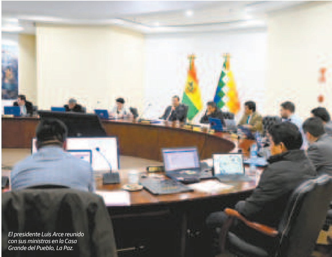
El presidente Luis Arce reunido con sus ministros en la Casa Grande del Pueblo, La Paz.

También está en plena producción la Planta de Transformación y Centro de Acopio y