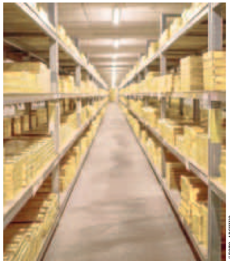
En las bóvedas del Banco Central de Bolivia se custodian 2,62 toneladas de oro.

El Banco Central de Bolivia se comprometió a continuar con los esfuerzos necesarios para mantener estos indicadores favorables durante este 2025.