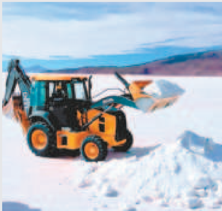
Proceso de acopio de sal en el solar de Coipasa.

se constituye en otro proyecto que muy pronto vamos a inaugurar, permitiendo el acopio de sal y la formación de reservas para su comercialización a empresas procesadoras de sal en la ciudad de Oruro durante todo el año”, agregó el presidente Arce.