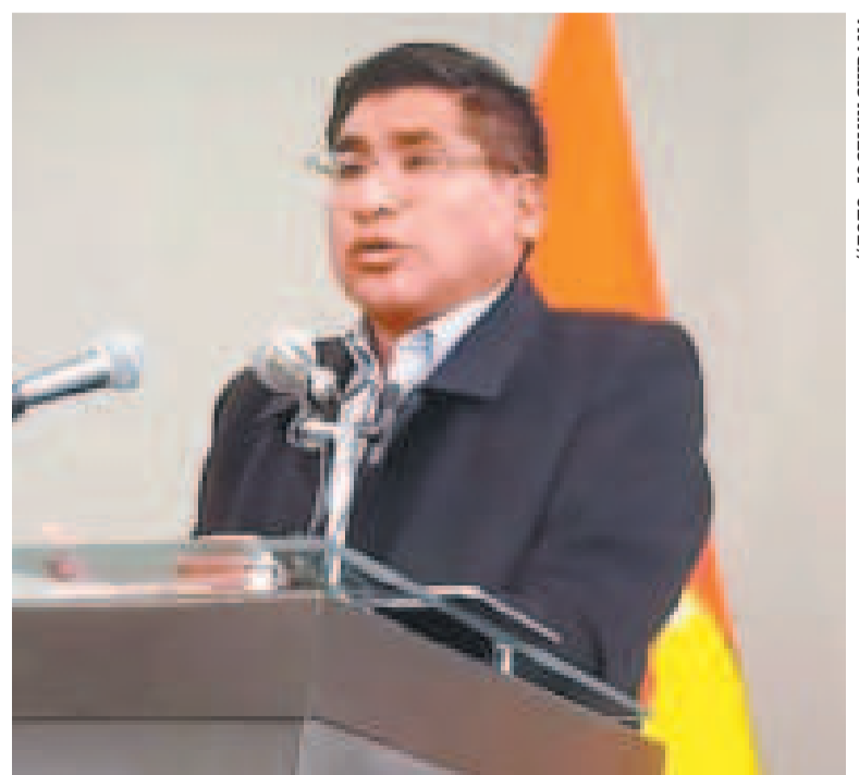
El ministro de Desarrollo Productivo y Economía Plural, Néstor Huanca, en conferencia de prensa.

“Es un esfuerzo conjunto para garantizar la seguridad alimentaria sin desproteger a nuestros productores”, destacó Huanca.