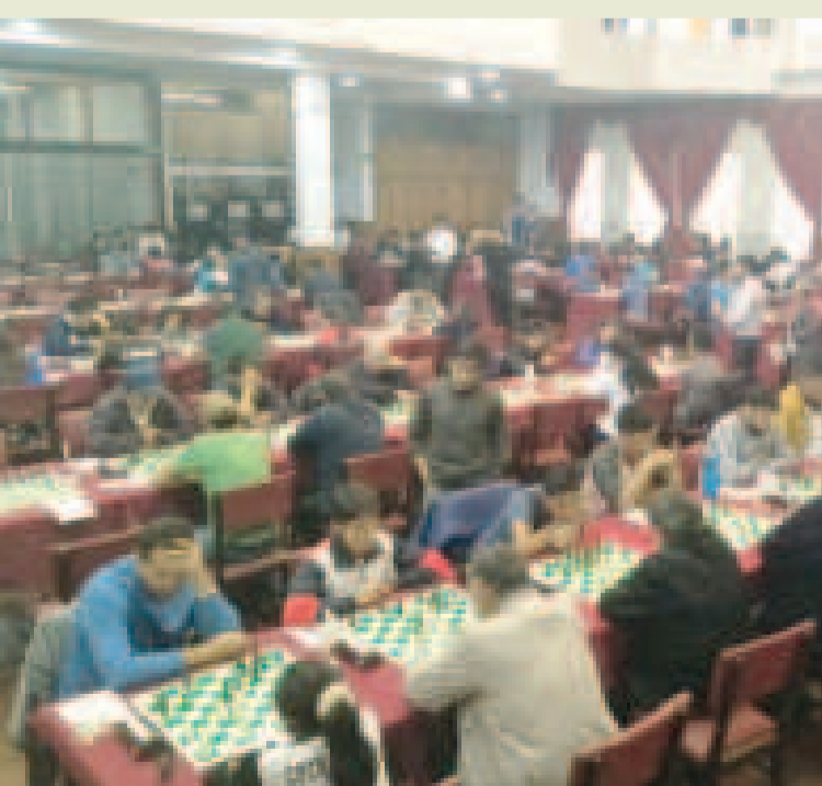
En 2025, el ajedrez tendrá una nutrida actividad nacional e internacional.