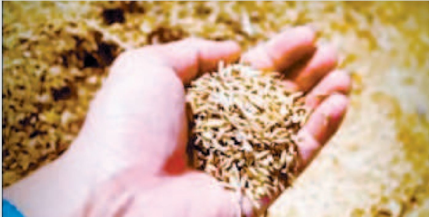
El trigo es un insumo esencial para la elaboración de insumos clave como el pan de batalla.

Esta medida fue establecida ya en agosto de 2024, y se fijó un plazo de vigencia