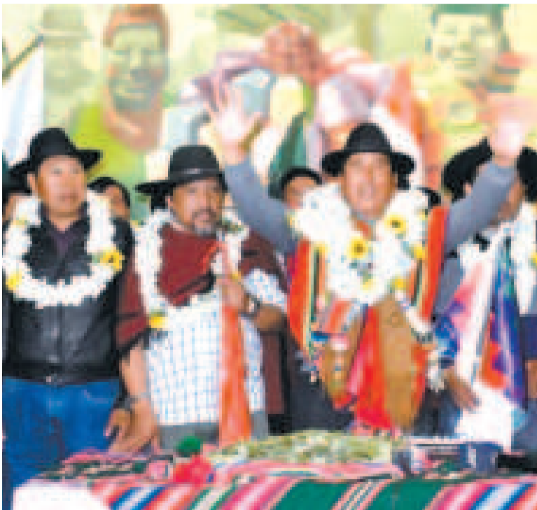
La dirigencia de la CSUTCB.