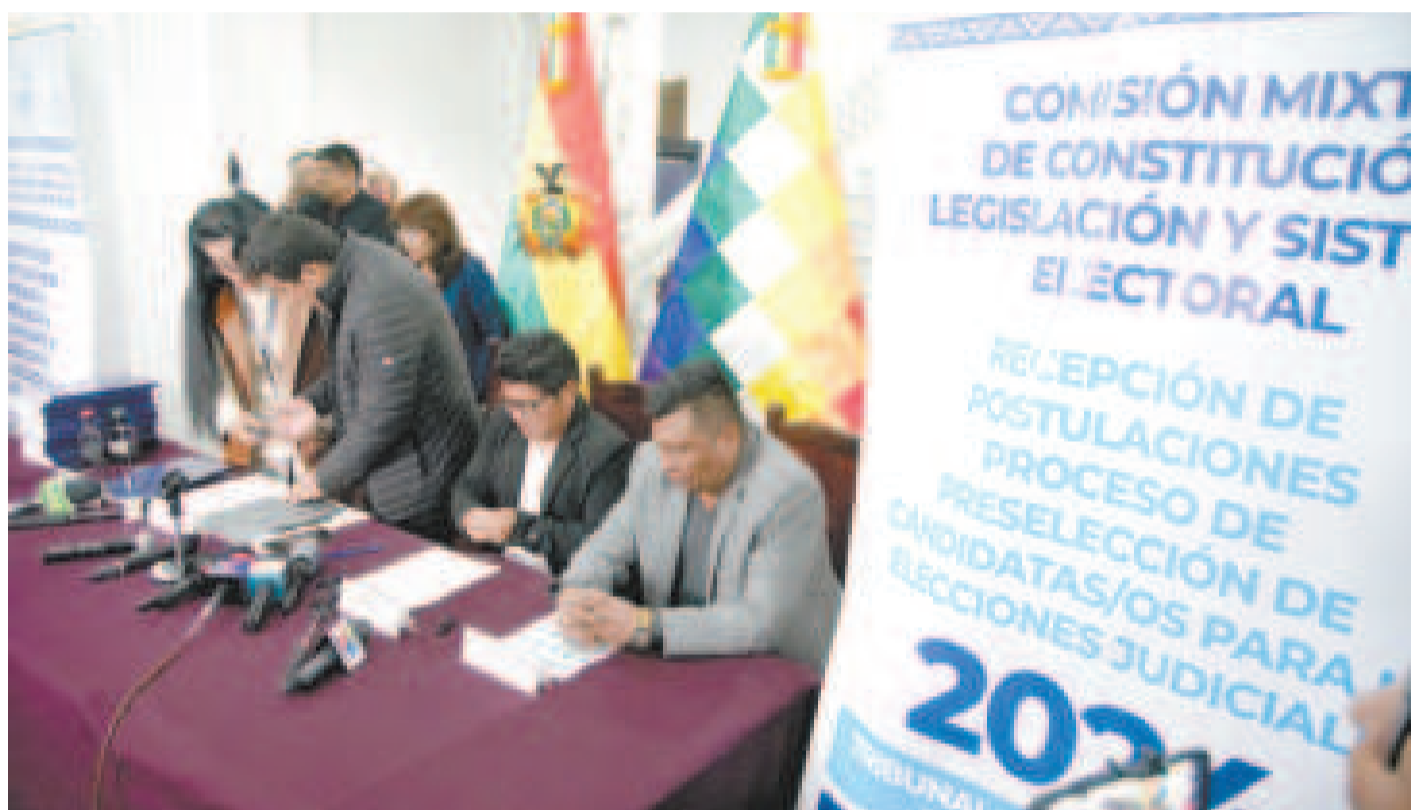
La preselección de postulantes en la Comisión Mixta de la Asamblea para las elecciones judiciales 2024.

La primera sugerencia es suprimir el artículo 37 de la Ley 1549, que fue declarada "inaplicable" por ser contraria a las normas constitucionales.