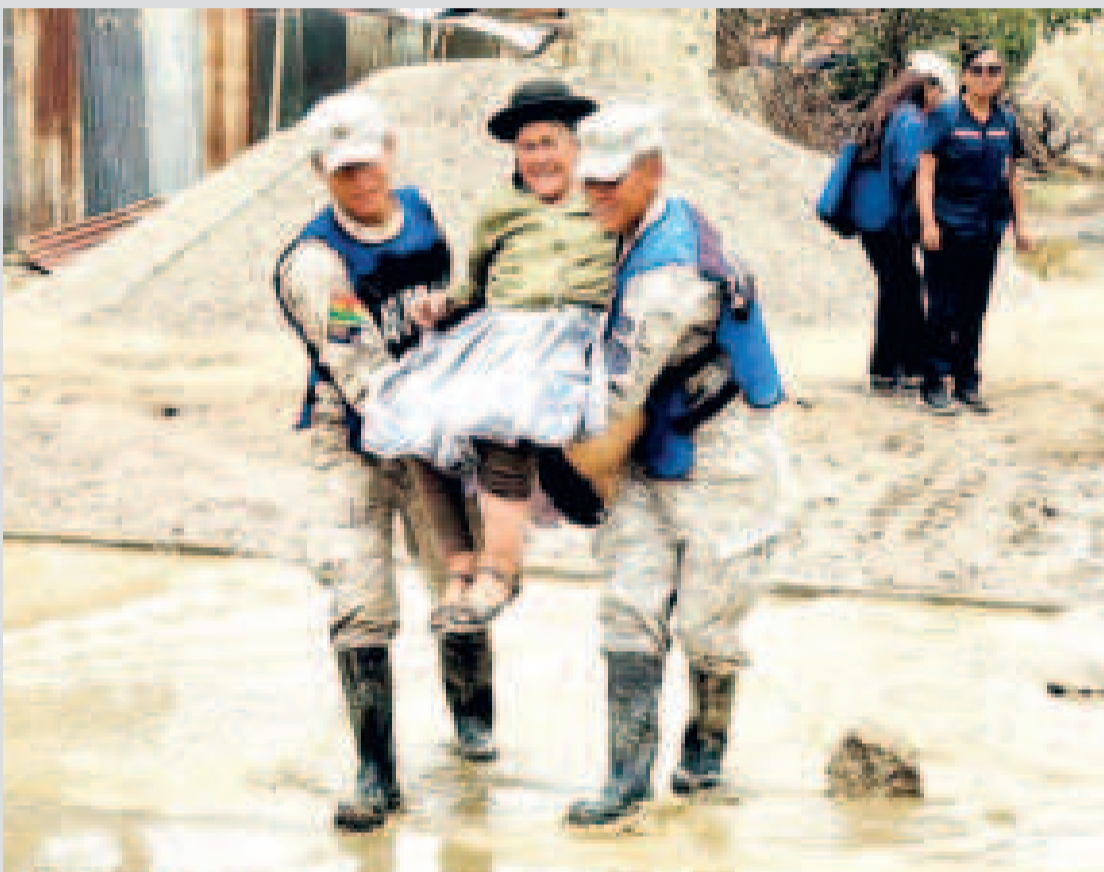
Efectivos militares atienden a los damnificados.

pactadas, de las cuales 9.892 resultaron afectadas y 4.388 quedaron damnificadas.