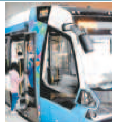
El servicio de transporte del Tren Metropolitano.

De acuerdo con el Fondo Nacional de Inversión Productiva y Social, el Centro de Acopio de Sal emplazado en el municipio de Coipasa, representa una inversión estatal de Bs 3.130.838, de los cuales Bs 1.499.658 fueron destinados a la infraestructura; Bs 1.447.680 para equipamiento; Bs 107.500 para la supervisión; y Bs 76.000 en la capacitación.