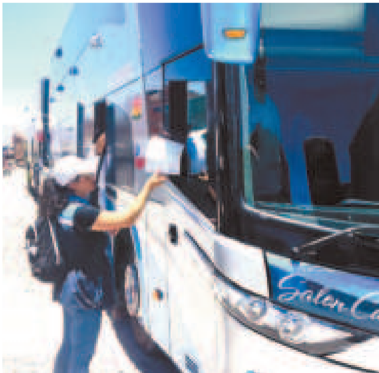
Personal de la ATT en la fiscalización del transporte de pasajeros.