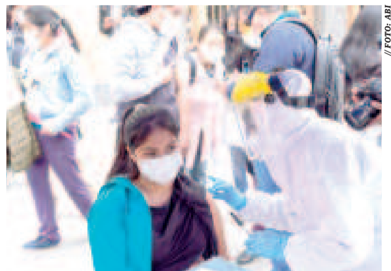
Jóvenes reciben vacunación contra el Covid-19.

Las autoridades educativas subrayan la necesidad de pre-