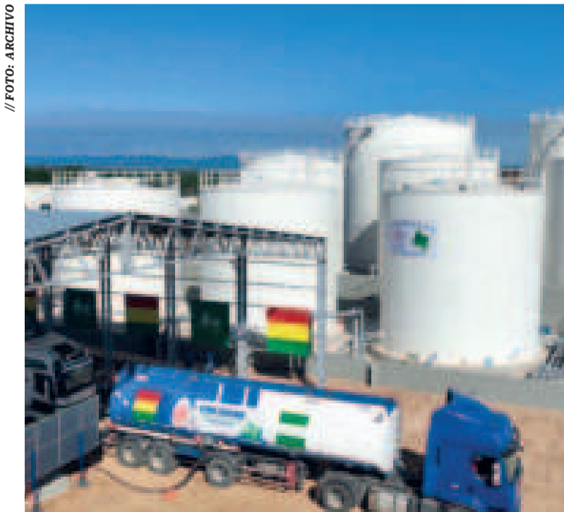
YPFB prioriza el abastecimiento de combustible al sector productivo.

Dorgathen destacó que el biodiésel no sustituye al diésel convencional, sino que se utiliza como un aditivo que reduce las importaciones de diésel fósil. En la mezcla, el biodiésel representa el 10%, mientras que el 90% corresponde al diésel fósil.