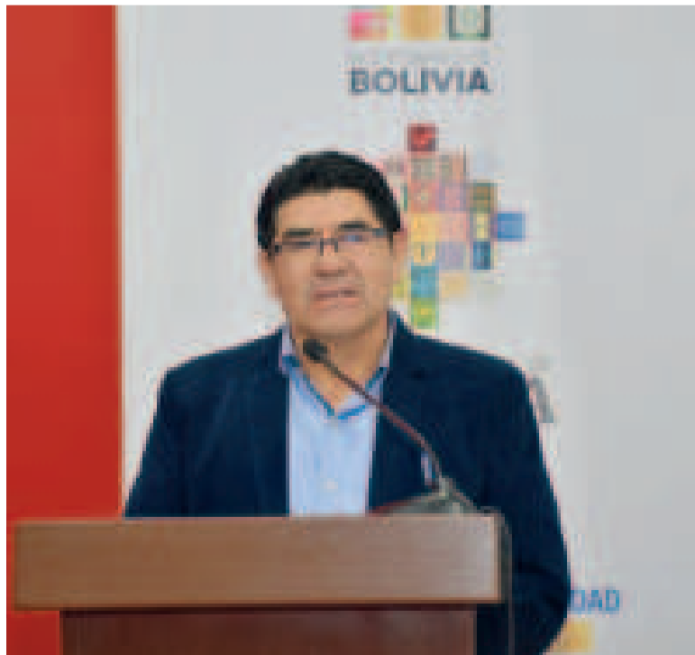
Las denuncias contra el ministro Véliz están en investigación.