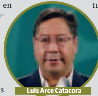
Luis Arce Catacora

“Seguimos en alerta permanente y trabajando sin tregua para mitigar los efectos de la crisis climática en el país. Hoy realizamos sobrevuelos con un helicóptero Eco Charlie de nuestra Fuerza Aérea Boliviana, en las regiones afectadas por las intensas lluvias en el departamento de Chuquisaca, para evaluar la situa-