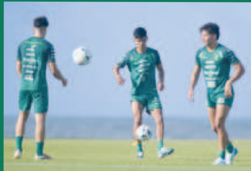
Jugadores de la Selección Sub-20 en plena tarea de dominio de balón, en Valencia.