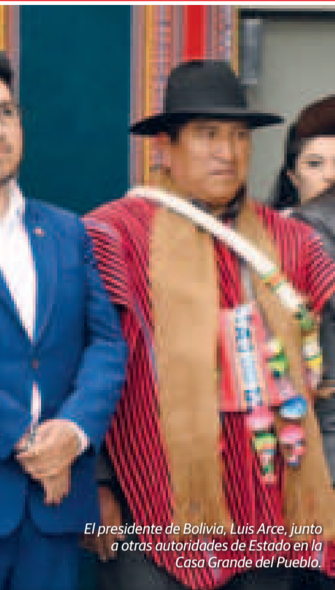
El presidente de Bolivia, Luis Arce, junto a otras autoridades de Estado en la Casa Grande del Pueblo.