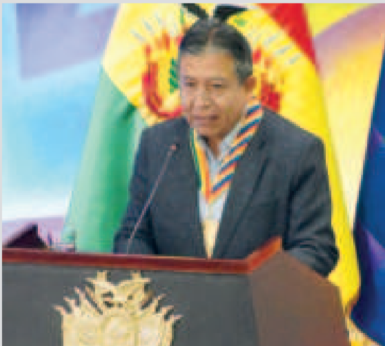
El vicepresidente del país, el jilata David Choquehuanca.