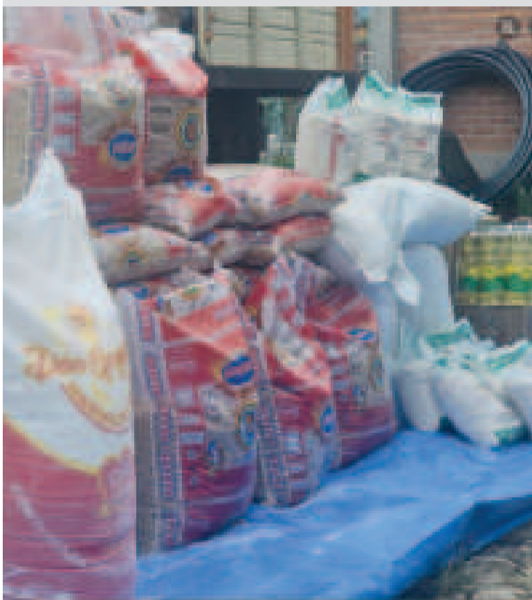
Parte de la ayuda humanitaria enviada por el Gobierno nacional a Monteagudo.