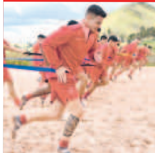
Futbolistas de Always Ready en una tarea en arena.