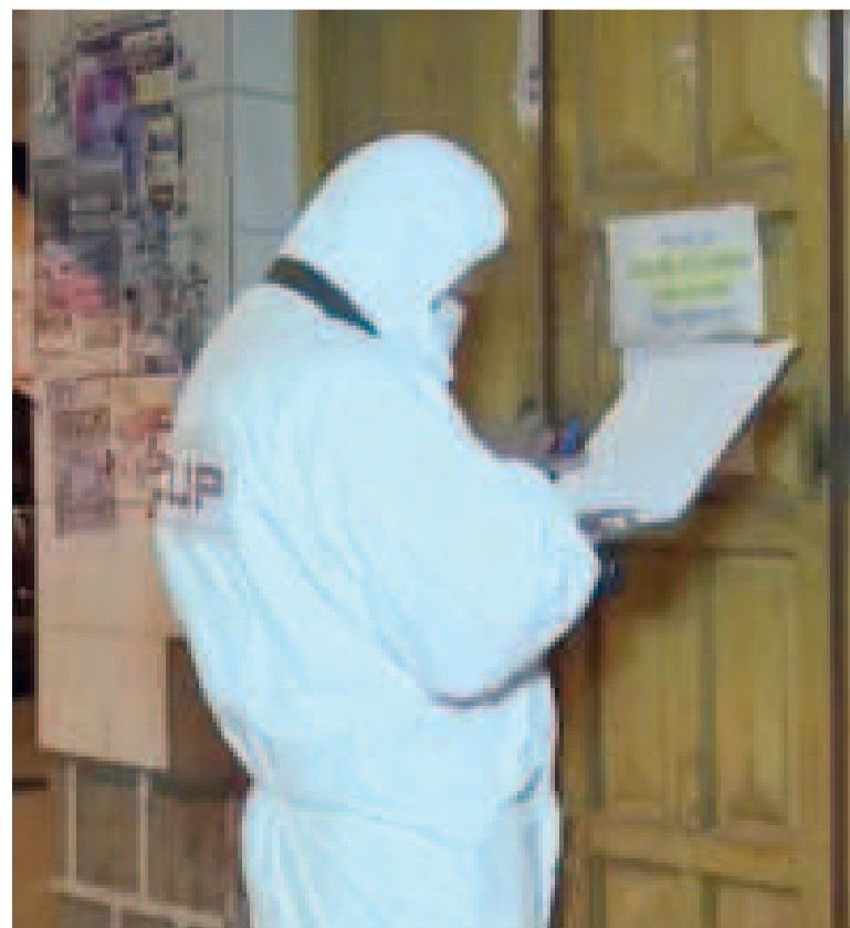
Tareas de investigación forense, en Oruro, sobre el caso de feminicidio.

Según la autopsia médico legal del IDIF, la causa de muerte es shock hipovolémico hemorrágico por hemorragia aguda interna, ruptura hepática, trauma toracoabdominal cerrado.