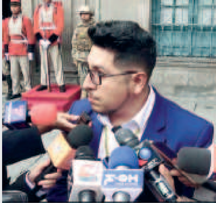
Omar Yujra, presidente de Diputados, en rueda de prensa en la plaza Murillo, ayer.

“Con el firme compromiso con el pueblo boliviano, convocamos a la 34ª Sesión Ordinaria de la Cámara de Diputados este jueves 23 de enero. En esta sesión trataremos dos importantes proyectos de ley que responden a las necesidades de nuestro pueblo”, informó Yujra.