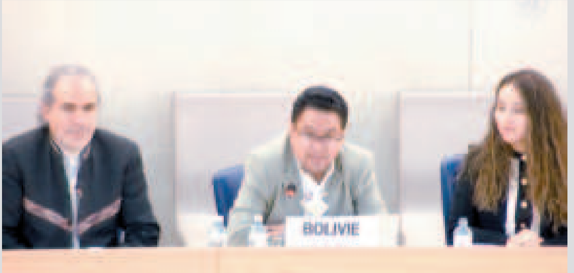
El ministro de Justicia, César Siles, en el Consejo de Derechos Humanos de las Naciones Unidas.

(OIT) sobre el Convenio 29 y el Convenio 169, asegurando su incorporación en el bloque de constitucionalidad.