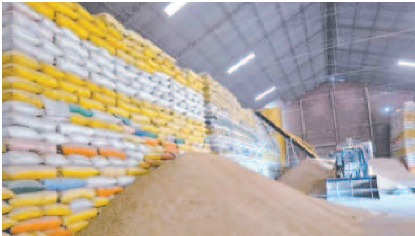
Venta de arroz en localidades rurales por Emapa.