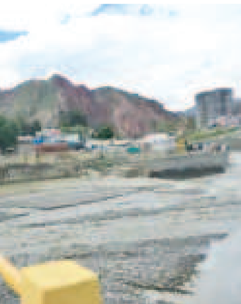
Creceda de ríos en la zona Sur de la ciudad de La Paz.

También colapsó un muro en una propiedad privada en Alto Vino Tinto, debido a filtraciones que erosionaron la estructura.