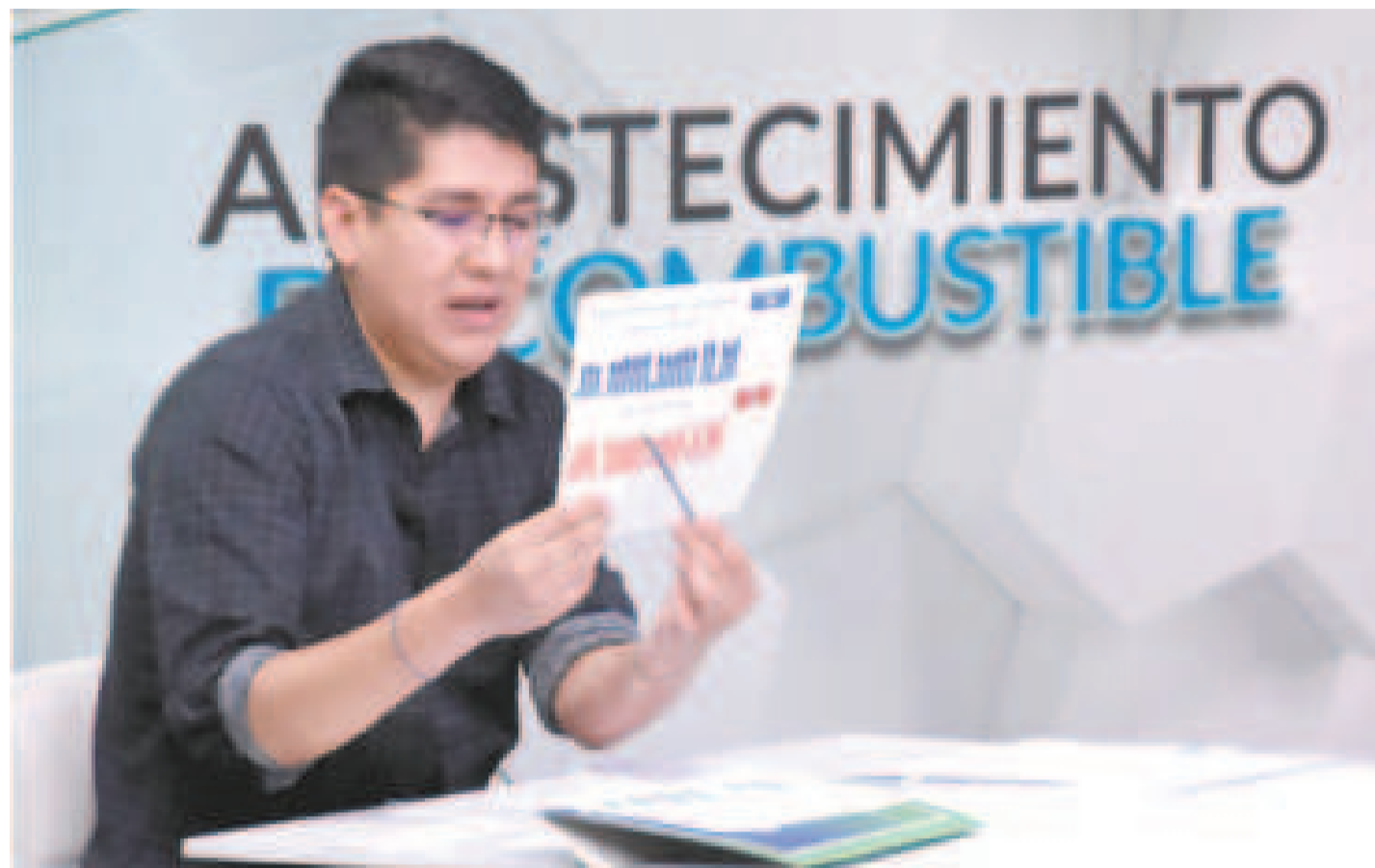
El director ejecutivo de la ANH, Germán Jiménez, en el set del programa 'Los hechos cuentan', de Bolivia TV.

“En el último trimestre de diciembre hemos incautado 25 cisternas, pero ahora estamos interviniendo estaciones de servicio. La intervención dentro de la Ley de Hidrocarburos se da por dos condiciones: discontinuidad en el servicio o desvío. Estas dos estaciones de