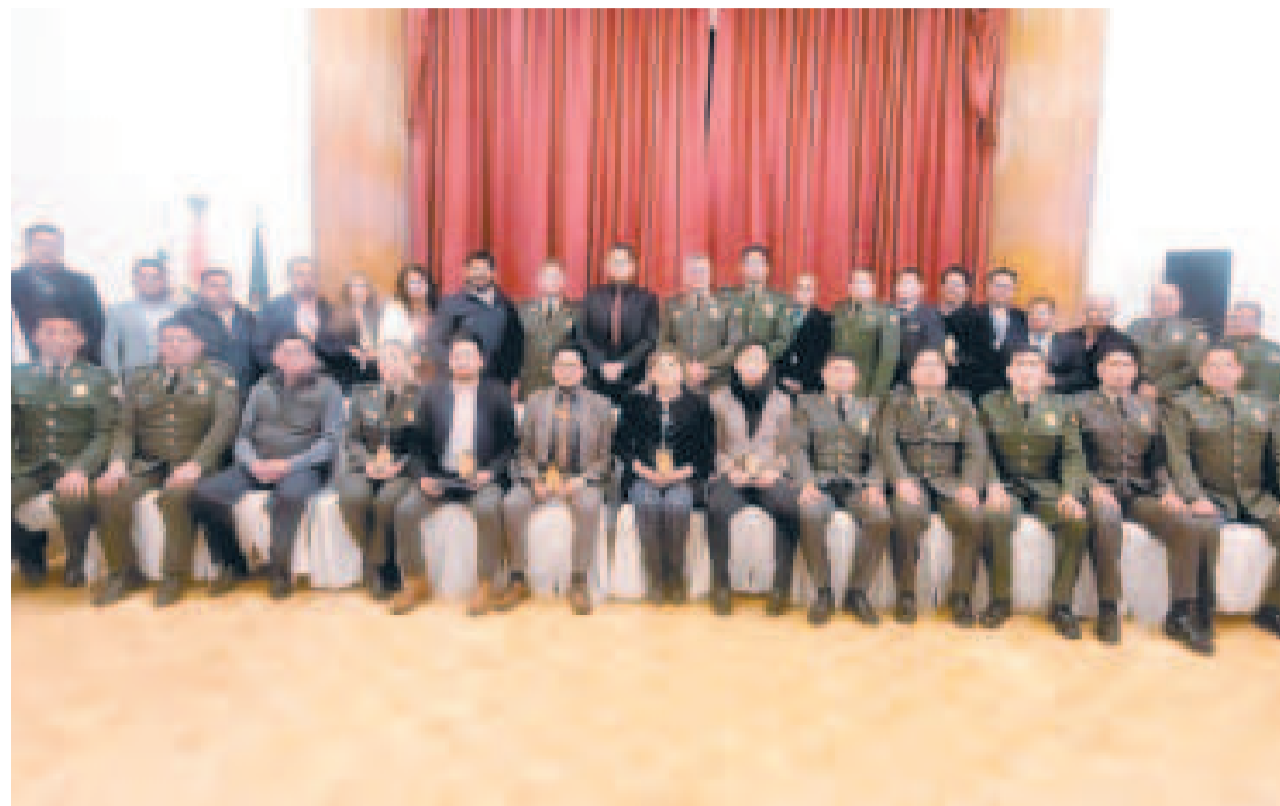
Reunión estratégica junto a jefes policiales y coordinadores del Ministerio Público.

Las divisiones policiales especializadas, junto con los fiscales asignados a cada área, serán