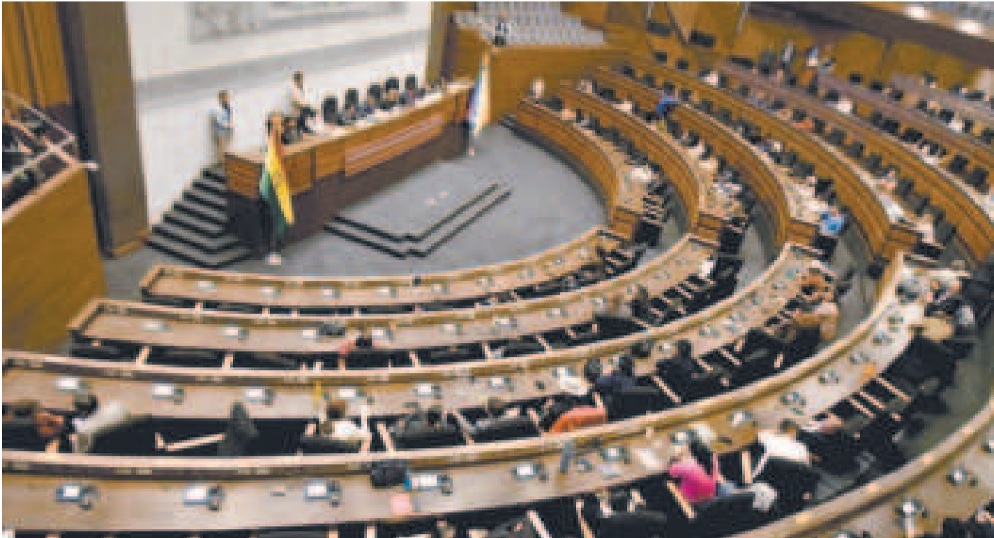
La Asamblea Legislativa paralizó la aprobación de los créditos externos por un monto total de $us 1.667 millones.