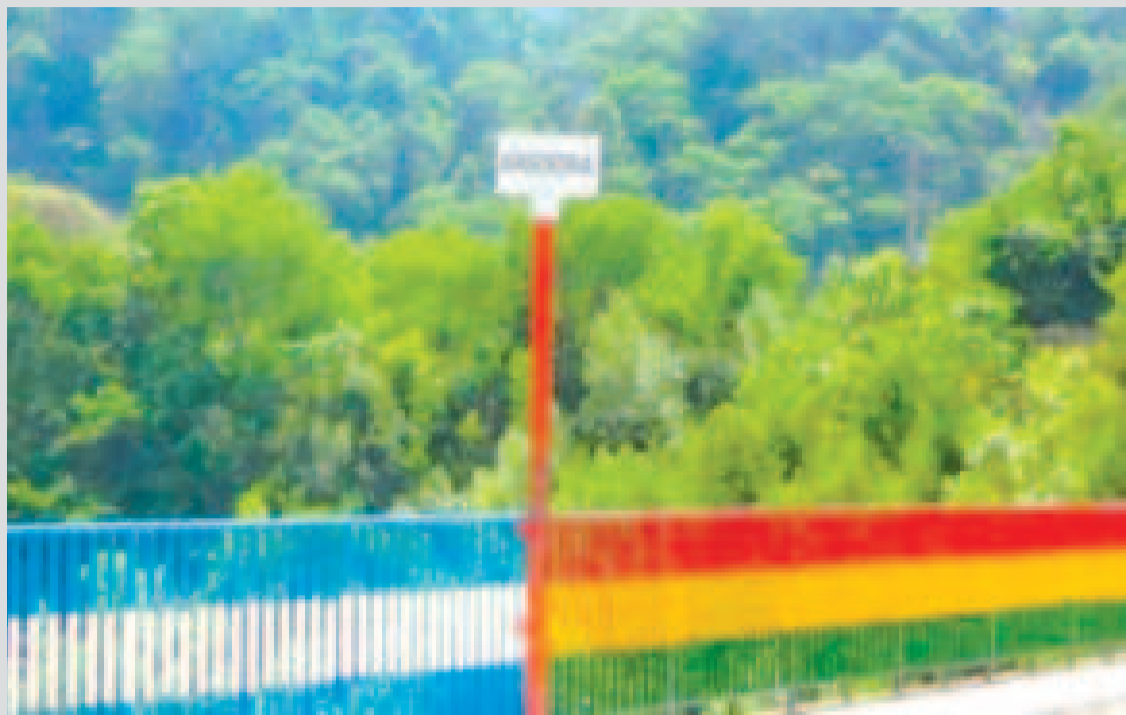
Puente fronterizo entre Bolivia y Argentina.

María Nela Prada Ministra de la Presidencia