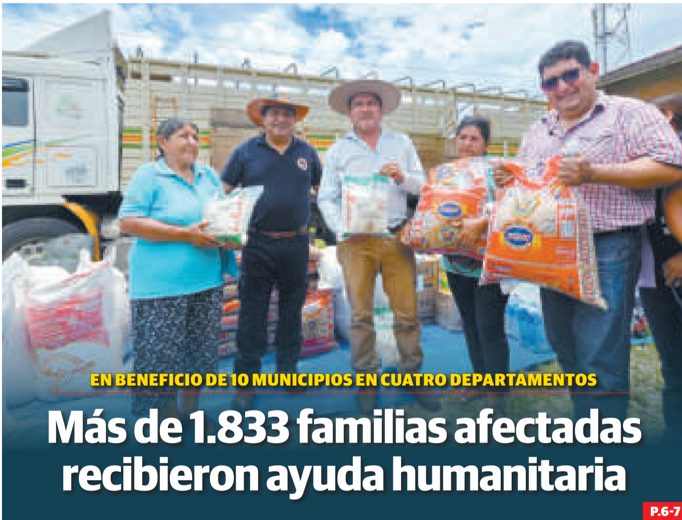
EN BENEFICIO DE 10 MUNICIPIOS EN CUATRO DEPARTAMENTOS