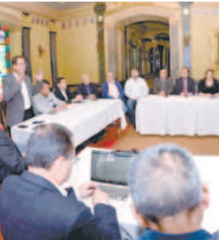
Representantes de los industriales.