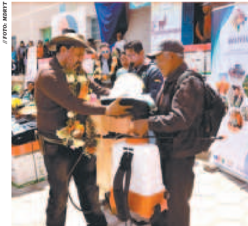
El ministro de Desarrollo Rural y Tierras, Yamil Flores, entrega equipos a un productor.