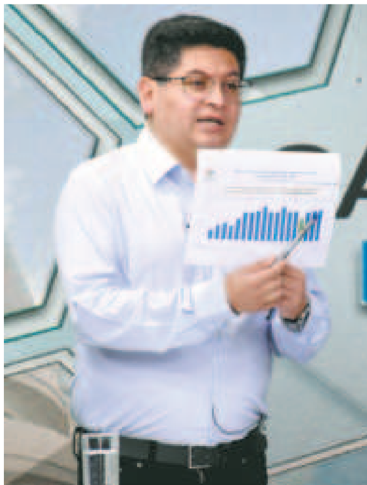
El ministro de Economía y Finanzas Públicas, Marcelo Montenegro, en entrevista en BTV.

Desde 2023, cuando se inició el bloqueo en la Asamblea, los desembolsos del exterior son menores que los pagos del servicio de la deuda externa.