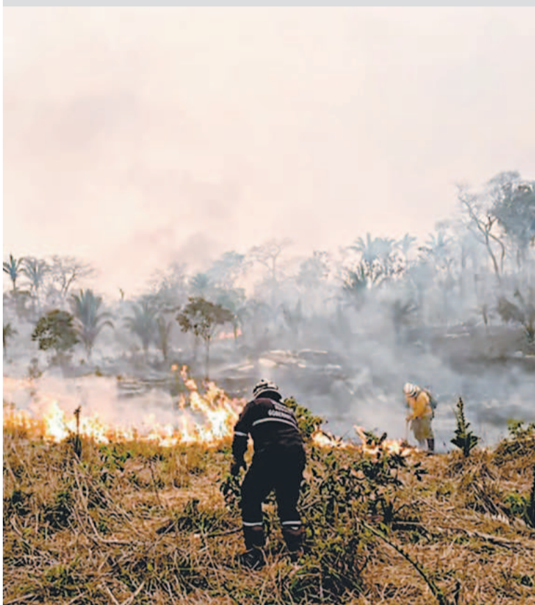
Efectivos militares luchan contra un incendio forestal en Santa Cruz.