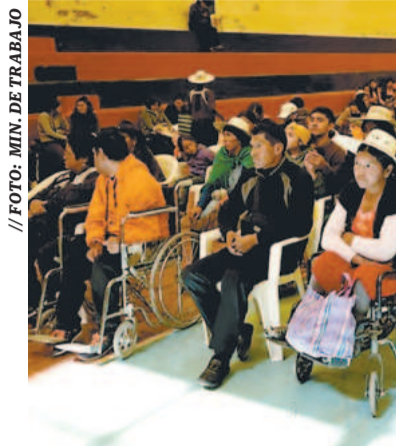
Personas con discapacidad en un evento.