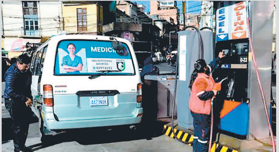
La comercialización de combustibles en una estación de servicio.

Aseguró que la institución realiza seguimiento permanente a la distribución