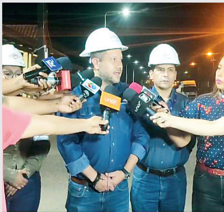
El ministro Alejandro Gallardo en rueda de prensa, en Santa Cruz, anoche.