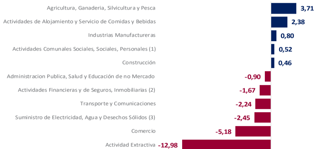
BOLIVIA: VARIACIÓN DEL PIB POR ACTIVIDAD ECONÓMICA, ENERO – JUNIO 2025 (p) (En porcentaje)

(1) Incluye las actividades: Servicios Domésticos, Educación y Salud de Mercado (2) Incluye las actividades: Inmobiliarias y Servicios Profesionales (3) Incluye las actividades: Recolección de Desechos Sólidos (p) Preliminar