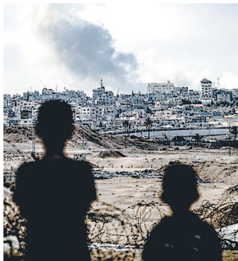
Dos niños en Gaza observan el humo tras un ataque aéreo.

Varios países, incluido Bolivia, además de organismos multilaterales abogaron por la paz y el fin del conflicto que dejó, en dos años, más de 68 mil vidas. Los ataques perpetrados por Hamás en territorio israelí el 7 de septiembre de 2023 provocaron 1.200 muertos y la toma de 250 rehenes. En tanto, la respuesta israelí cobró ya 67.000 vidas, según un reporte de las Naciones Unidas.