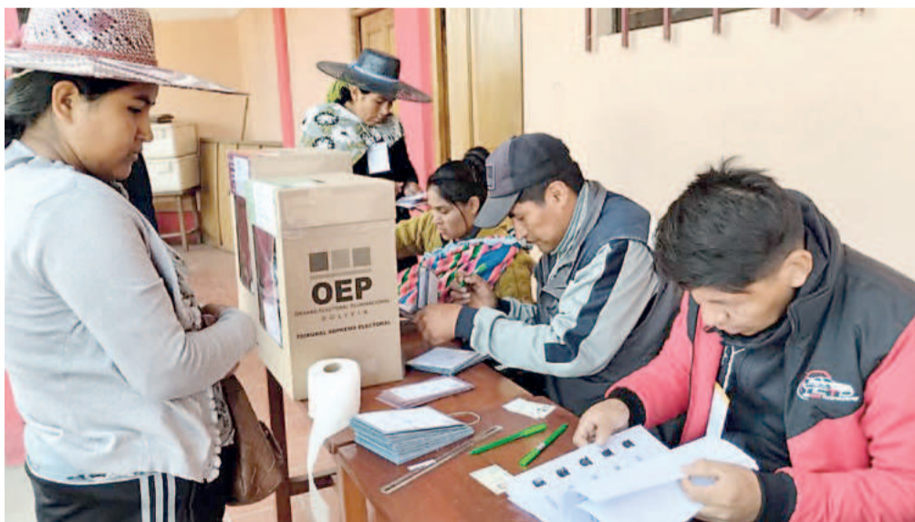
Los votantes volverán a las urnas el próximo 19 de octubre.

Ambos analistas coincidieron en que, aunque los candidatos presenten soluciones rápidas ante la crisis económica, los riesgos sociales y políticos son elevados si no se aplican con planificación y acompañamiento institucional.