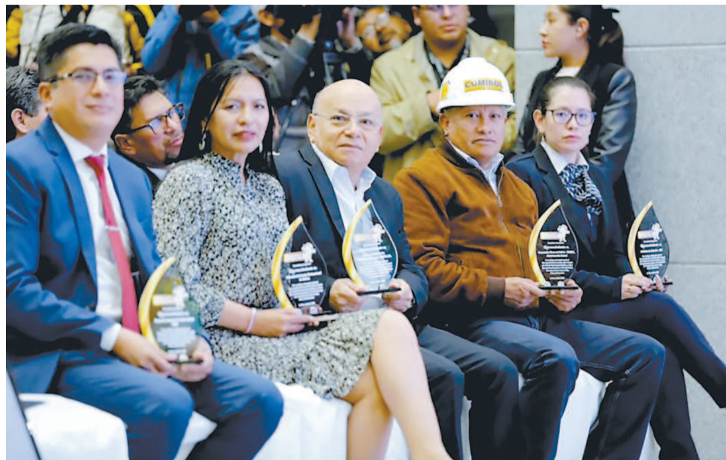
Autoridades responsables de entidades públicas con el reconocimiento entregado por el presidente Luis Arce, en Casa Grande del Pueblo.

El jefe de Estado destacó el carácter social del modelo