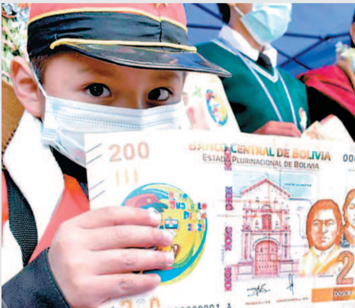
Un niño muestra un billete simbólico que representa al Bono Juancito Pinto, una conquista social.

como Jorge Quiroga, de la Alianza Libre, en caso de ser electos como presidentes en la segunda vuelta que se llevará adelante este domingo, como levantar la subvención a los hidrocarburos. También ante el llamado que hizo el presidente Luis Arce, quien pidió unidad del pueblo para defender las políti-