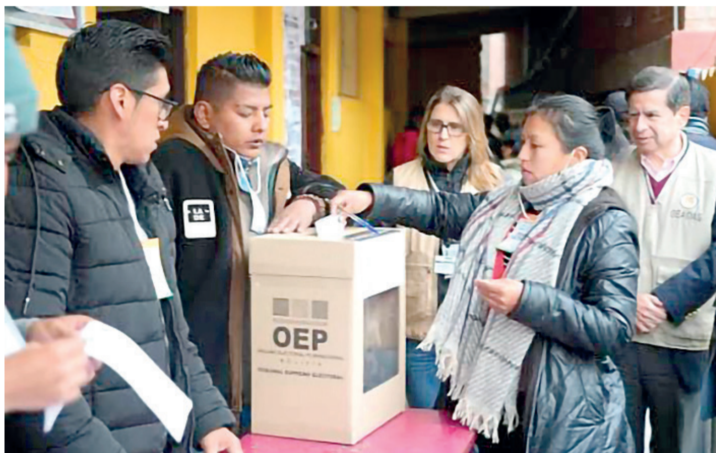
Una ciudadana emite su voto en la primera vuelta de las elecciones presidenciales, el 17 de agosto pasado.

La autoridad criticó que los candidatos de ambos frentes generen expectativas en la población respecto a soluciones inmediatas una vez que asuman la presidencia.