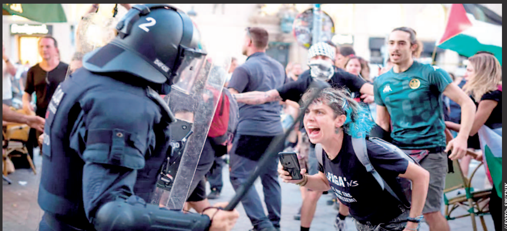
Enfrentamientos entre la Policía y manifestantes durante una protesta en apoyo a Palestina en Barcelona.