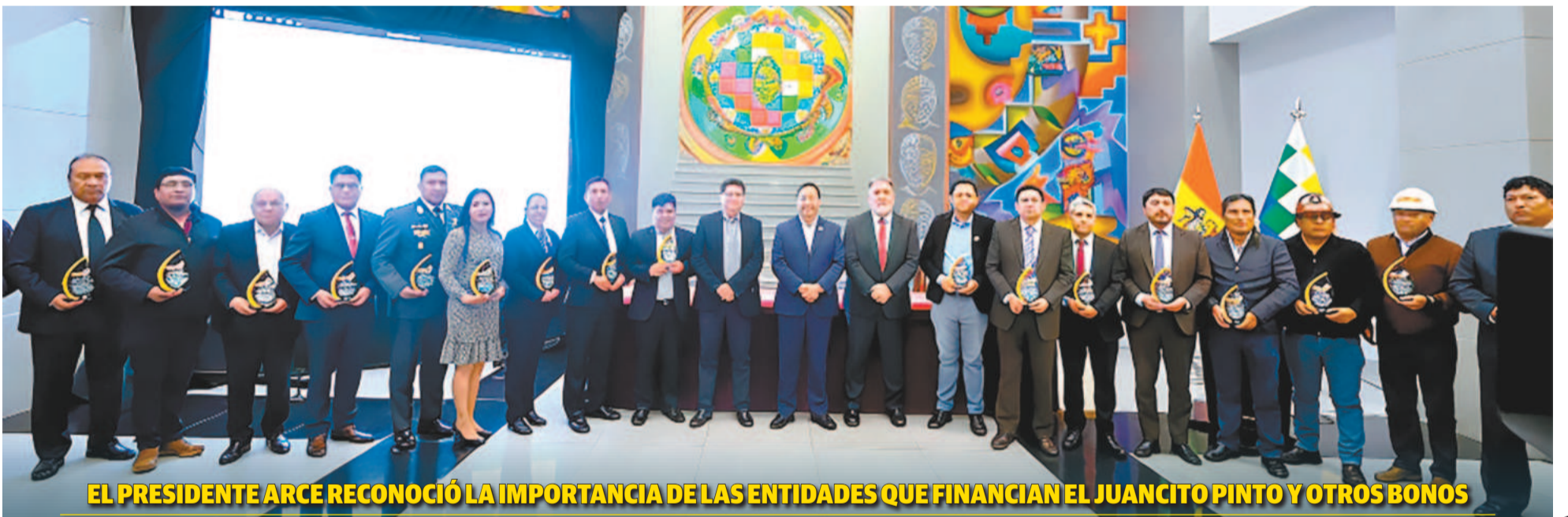
EL PRESIDENTE ARCE RECONOCIÓ LA IMPORTANCIA DE LAS ENTIDADES QUE FINANCIAN EL JUANCITO PINTO Y OTROS BONOS