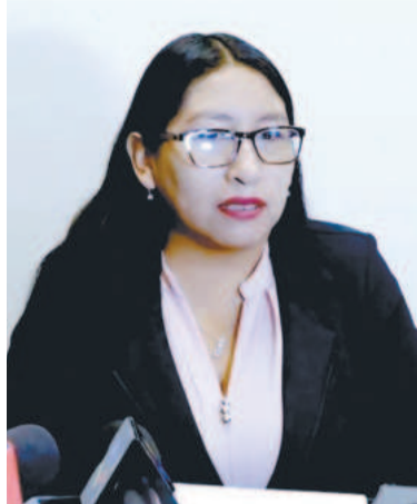
La diputada Olivia Guachalla.