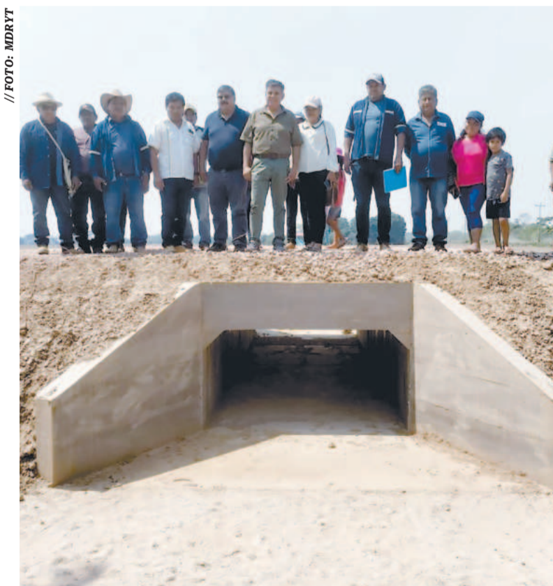
Una de las alcantarillas inauguradas.