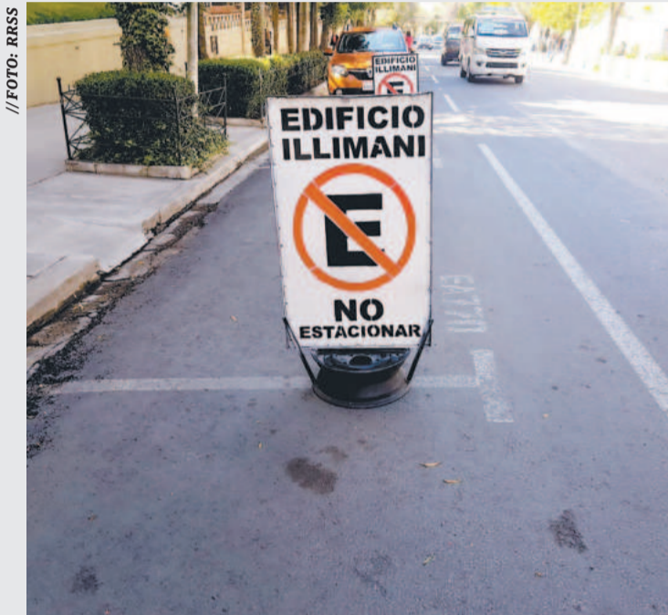
Dueños de edificios rechazaron el parqueo tarifado impuesto por la Alcaldía de La Paz.

El proyecto denominado Parqueos para Todos fue puesto en marcha por el Ejecutivo edil con el argumento de reducir el déficit de espacios de estacionamiento en la ciudad; sin embargo, los concejales aseguraron que la medida agravó el congestionamiento vehicular, afectó a