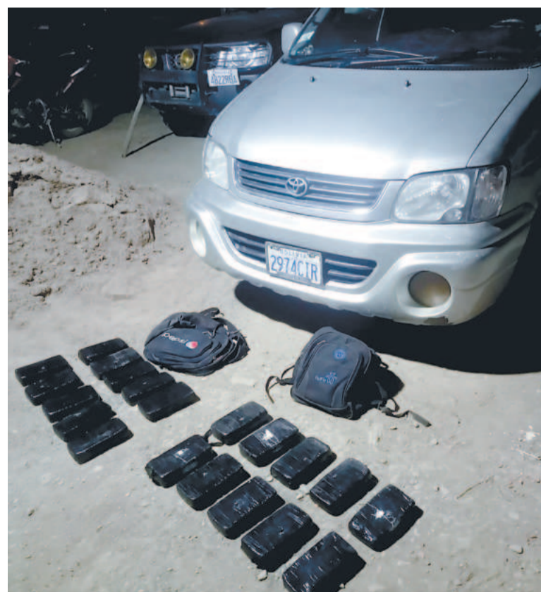
La FELCN secuestró paquetes de cocaína y un vehículo.

El Viceministro de Defensa Social y Sustancias Controladas indicó que el Gobierno nacional, en los últimos años de gestión, rompió récords en incautación, destrucción de laboratorios, fábricas y pistas clandestinas.