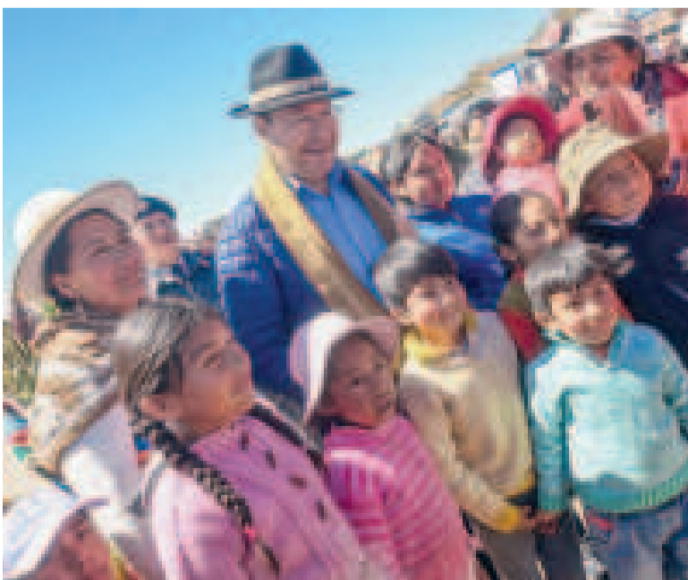
El Presidente junto a las niñas, niños y jóvenes estudiantes de Salinas de Garci Mendoza.

Por otra parte, sobre el proyecto carretero Quillacas-Salinas de Garci Mendoza, el Jefe de Estado aclaró que el Gobierno aprobó el proyecto, sin embargo está pendiente la contraparte de la Gobernación de Oruro. “Tenemos todo aprobado, pero esta es una carretera departamental, le dijimos al gobernador: queremos construir, queremos ir adelante con esto, y es indispensable que él nos pueda autorizar y dar una pequeña contraparte, no queremos que ponga mucho, queremos que nos dé una señal”, dijo Arce. El mandatario comprometió también la construcción de la nueva infraestructura para el colegio Litoral en esta región. “Venimos haciendo obras a pesar de que no tenemos la platita que teníamos antes, pero estamos haciendo todo para que de aquí en ▶