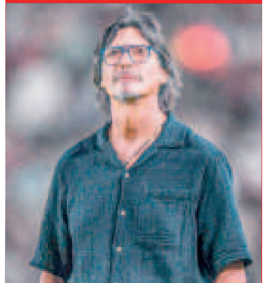
Ángel Comizzo dirigirá al seleccionado peruano.

La selección peruana está en el último puesto de las Eliminatorias al Mundial 2026. Ocupa la décima casilla con 7 puntos, el objetivo es llegar a la séptima ubicación para pelear en el repechaje a la Copa del Mundo. Por ahora, Bolivia es el que está en séptima casilla con 13 puntos, así que 6 unidades son las que separan a Perú del sueño de la Copa del Mundo.