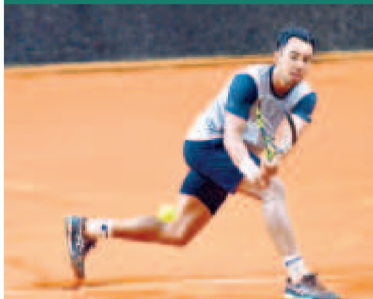
El tenista Hugo Dellien va camino al título en el Brasil Tennis Challenger.

El partido que definirá al clasificado a la final está programado para hoy en un horario por definir; después se jugará el encuentro por el título.