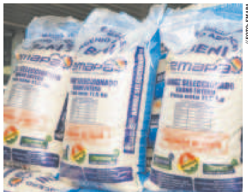
Productos de Emapa.

Como efecto de esa sequía, el país perdió "más o menos 700 mil toneladas de soya, más o menos 300 mil toneladas de arroz y 400 mil toneladas de maíz, eso ha hecho que evidentemente no tengamos suficiente alimento para engordar los animales sea pollo, cerdo o en este caso el ganado en pie, y hemos tenido vacas flacas", explicó el viceministro.