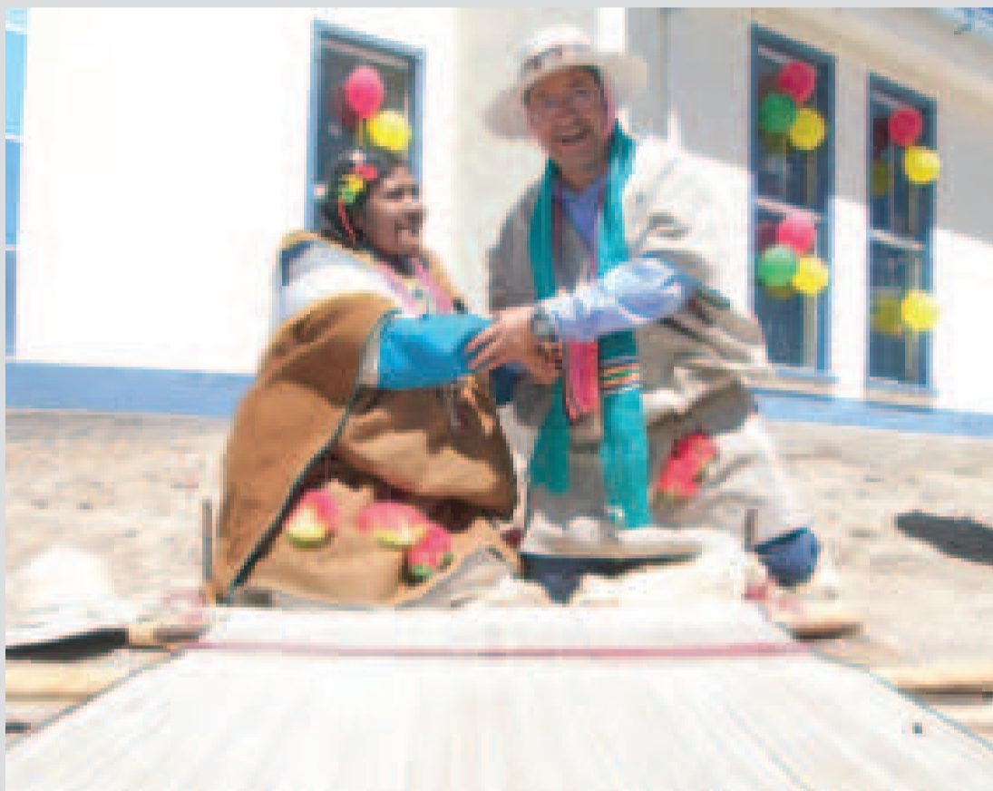
Las obras entregadas por el Jefe de Estado.

via, gracias a la vigencia de la Constitución Política del Estado promulgada en 2009.