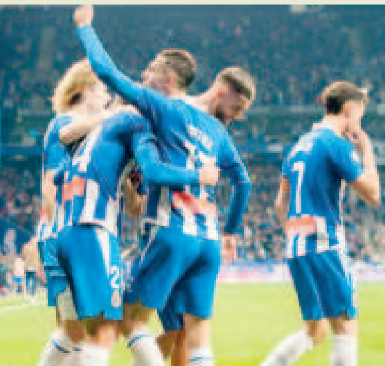
Jugadores del Espanyol celebran la gran victoria ante el Real Madrid.