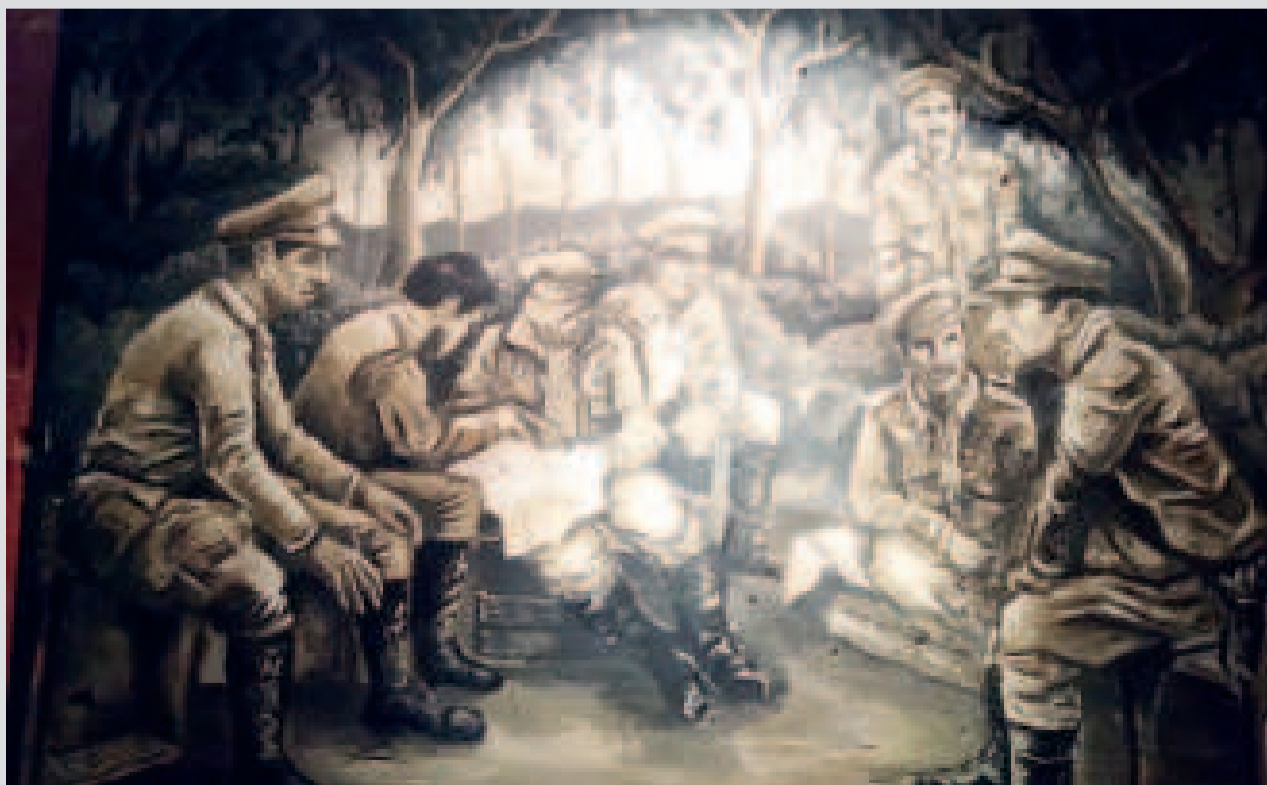
Oficiales bolivianos consultan un mapa de operaciones en la Guerra del Chaco. Dibujo que se exhibe en el Museo de Historia Militar de La Paz.