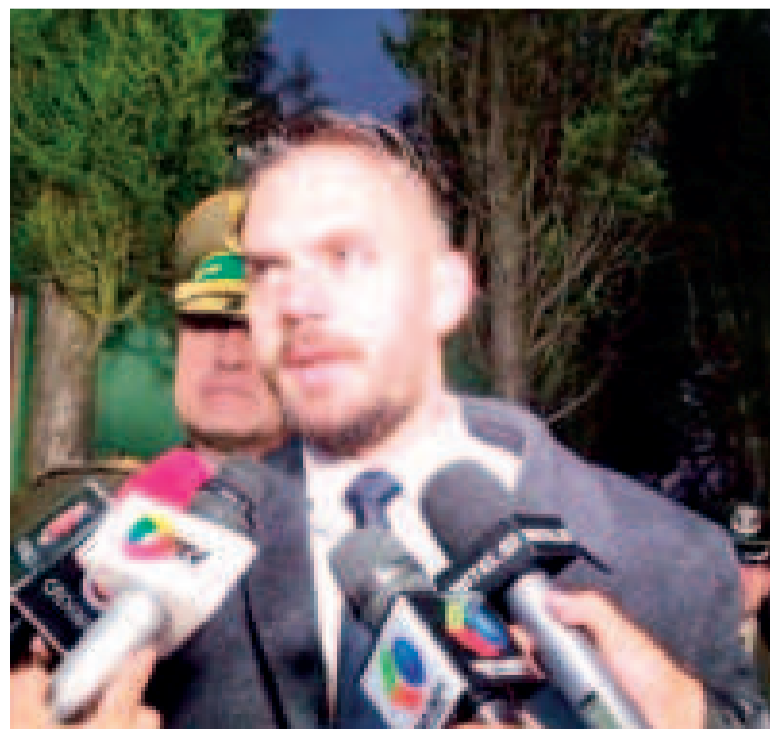
El ministro de Gobierno, Eduardo Del Castillo, en contacto con los medios.

Morales permanece desde octubre en el trópico de Cochabamba, resguardado por sectores sociales que lo respaldan.