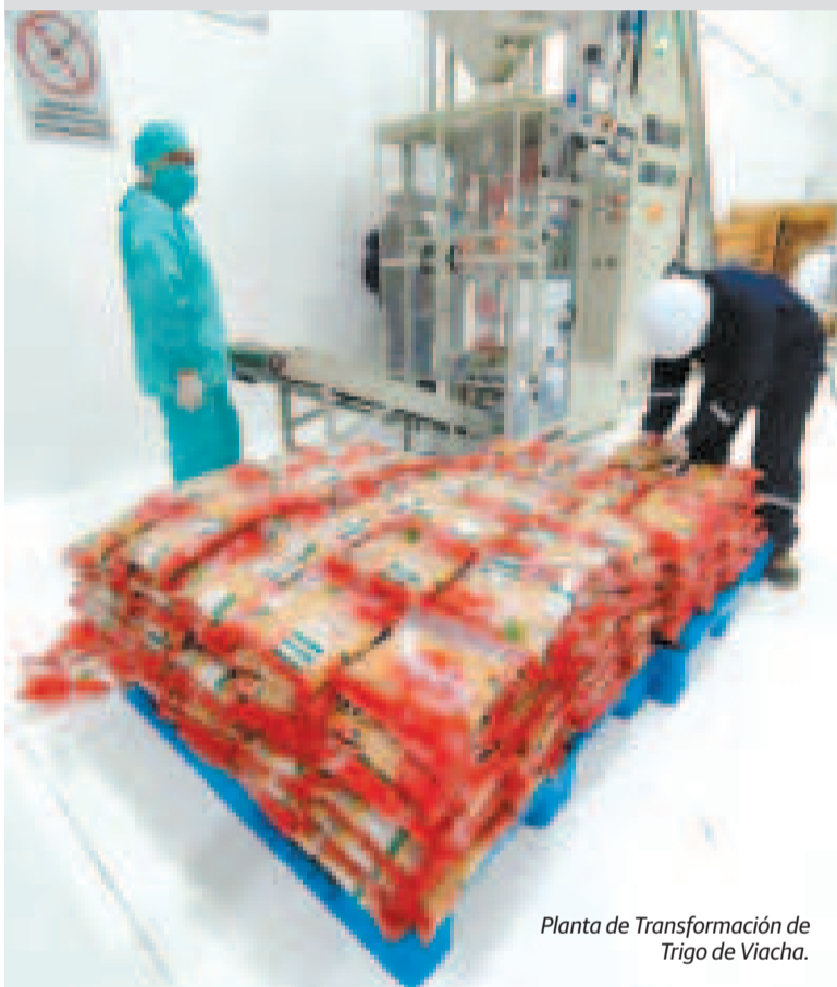
Planta de Transformación de Trigo de Viacha.