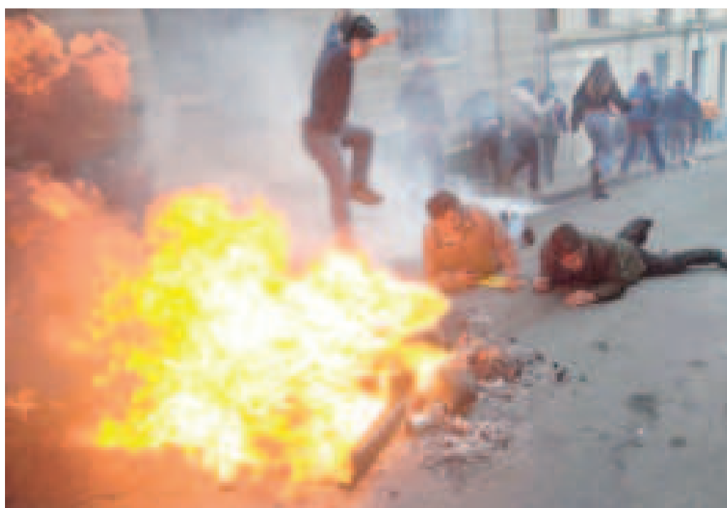
Personas tendidas en el suelo en medio de una fogata. Un joven salta ante los balines y gases lanzados por los militares el 26 de junio de 2024.