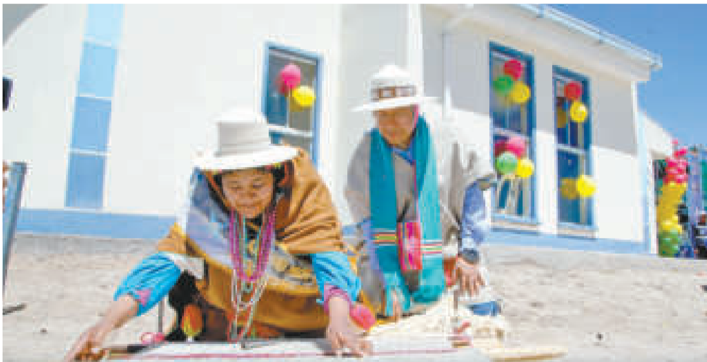
EN LOS MUNICIPIOS DE SALINAS DE GARCIMENDOZA Y URU CHIPAYA