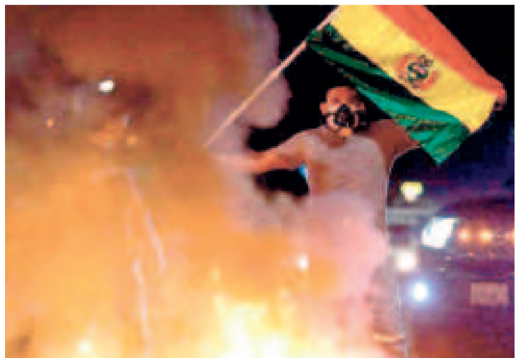
Una persona con la bandera boliviana en una movilización en Santa Cruz por la autonomía en 2008.

Aunque el principal líder de los cocalleros del Chapare cochabambino se retractó, sectores sociales y políticos pidieron investigar por terrorismo de Estado al expresidente porque las advertencias ponen en riesgo la democracia.