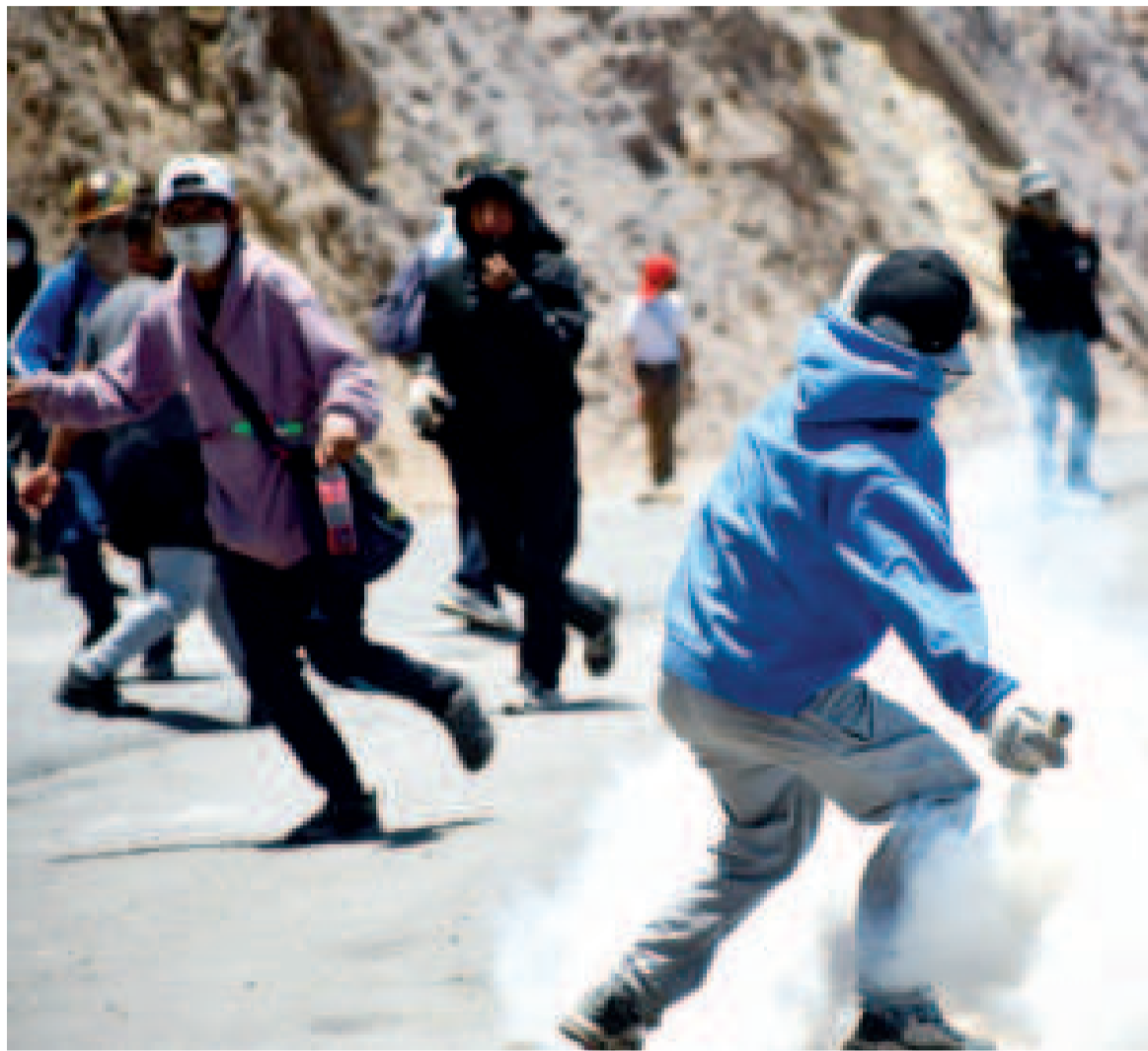
Un grupo de seguidores de Evo Morales en un punto de bloqueo en Parotani, Cochabamba.

pluralidad y el pluralismo político, económico, jurídico, cultural y lingüístico, dentro del proceso integrador del país”.