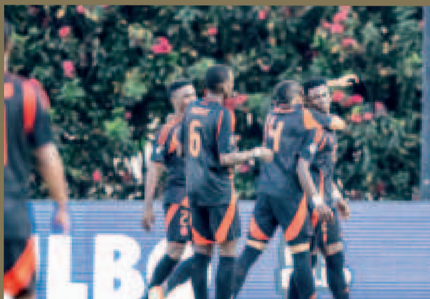
Los jugadores de la selección colombiana Sub-20 festejan el triunfo sobre Brasil.

Colombia y Brasil se enfrentaron en la última jornada del Grupo B