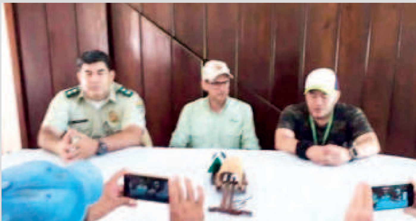
Comisión de Lucha Contra el Abigeato de la Federación de Ganaderos del Beni, en rueda de prensa.

La Fiscalía informó que la investigación sigue en curso con el objetivo de determinar si existen más personas involucradas en la red delictiva.