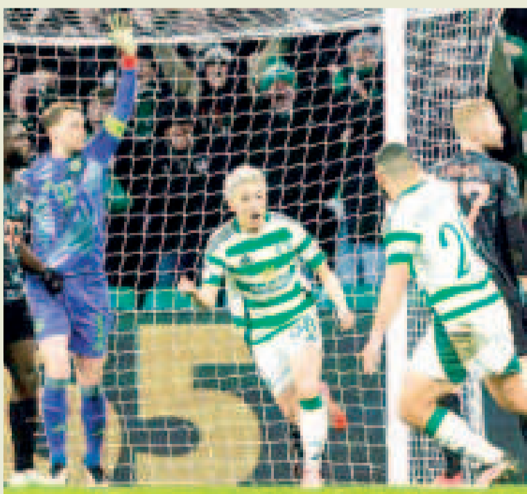
Jugadores del Celtic celebran el gol del descuento frente a Bayern Múnich.