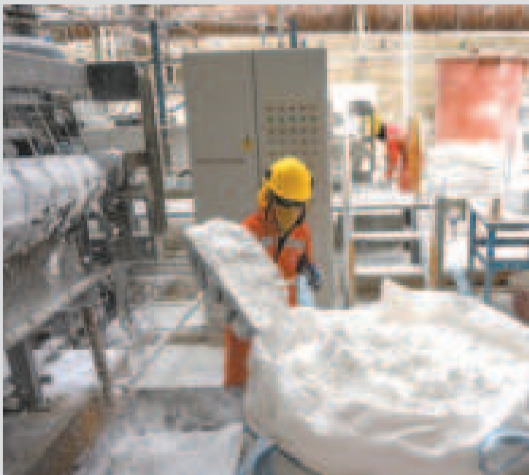
Proceso de industrialización del litio boliviano.