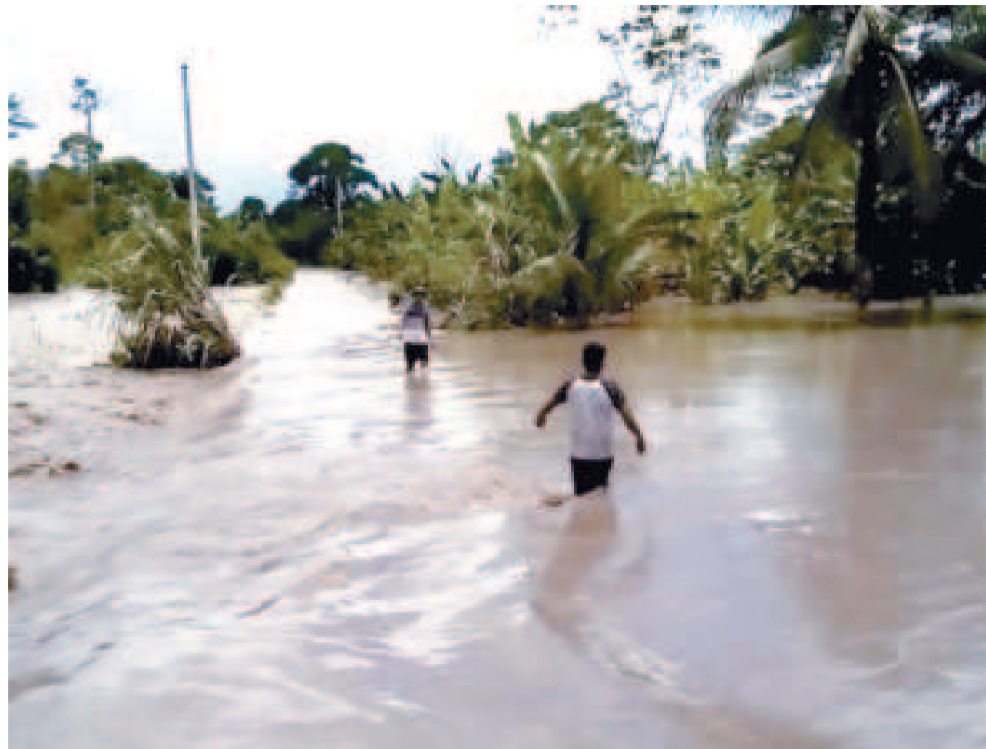
Desbordes en Santa Cruz por la crecida de los ríos.

El ascenso de caudal podría afectar a las áreas cercanas a Catavi, Chayanta, San Pedro, Ravelo, Potolo, Tinguipaya,