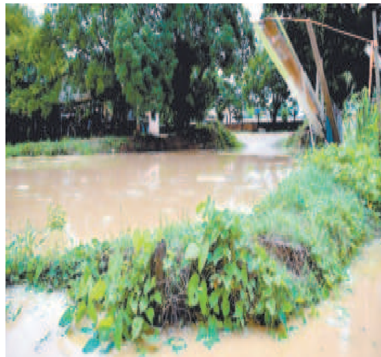
Las regiones del oriente fueron las más afectadas por los desbordes.