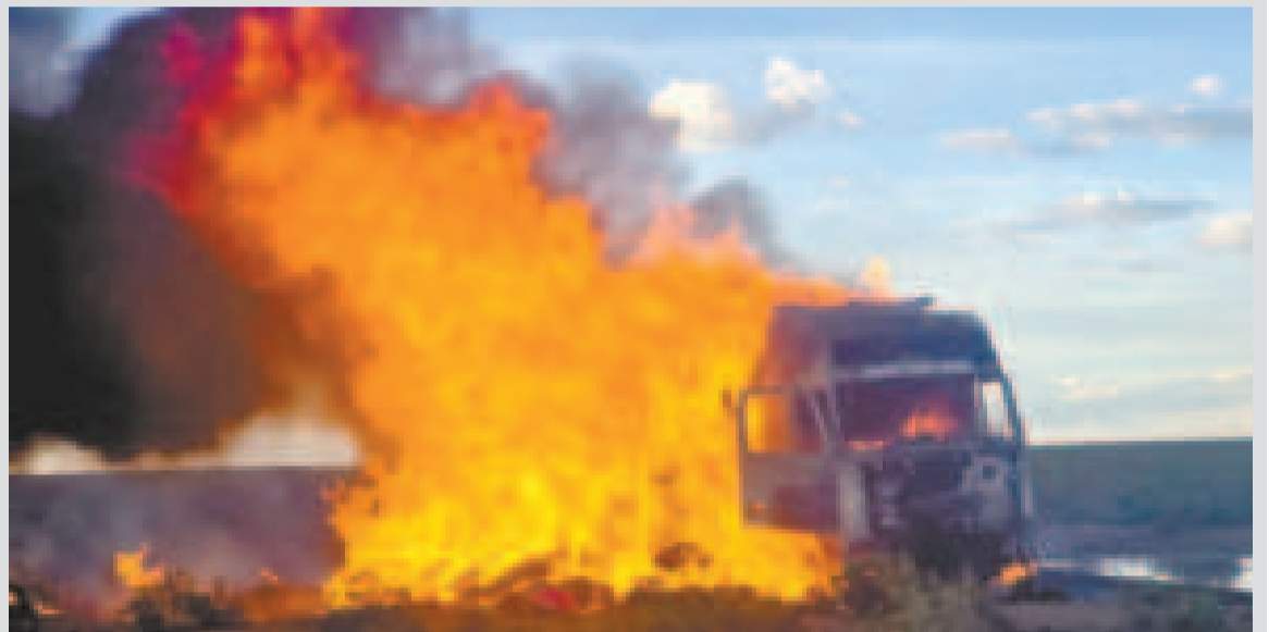
Un camión con mercadería de contrabando arde en llamas.

Los operativos han sido reforzados en las principales zonas fronterizas con Chile, Argentina, Paraguay y Perú, donde las redes de contrabando han intentado operar con mayor intensidad.