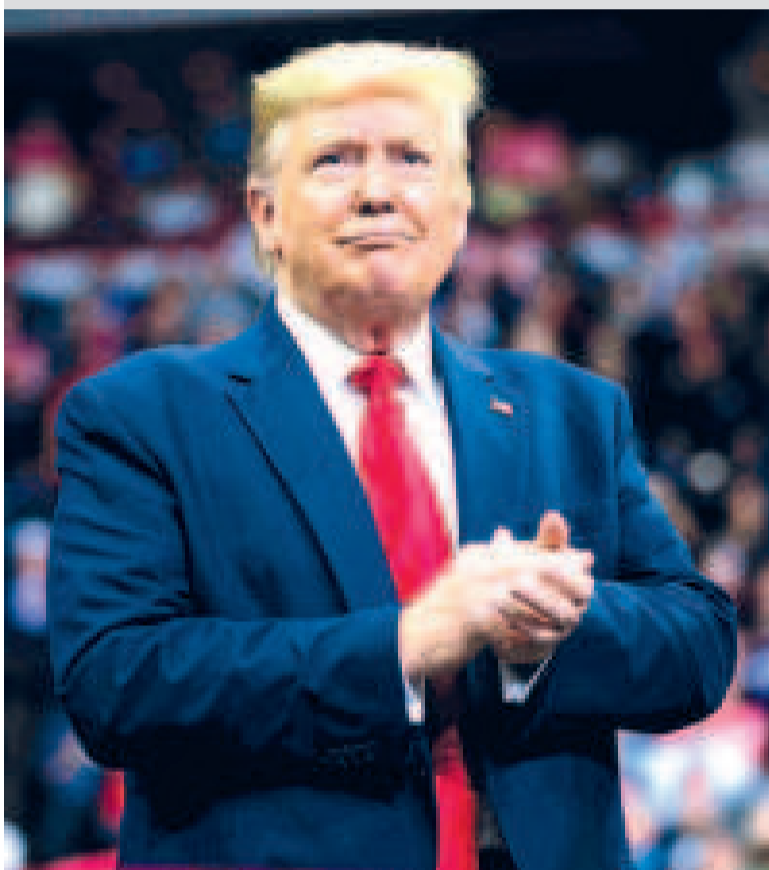
El presidente de Estados Unidos, Donald Trump.