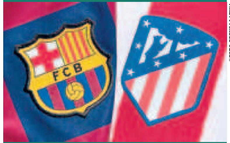
Barcelona y Atlético de Madrid definirán a un finalista de la Copa del Rey.

Sin embargo, el espíritu ofensivo insuflado por Flick a su plantilla tiene desbordados en ataque al polaco Robert Lewandowski, el brasileño Raphinha, el jovencito Lamine Yamal, y la colaboración esencial de Pedri como conductor en el medio campo.