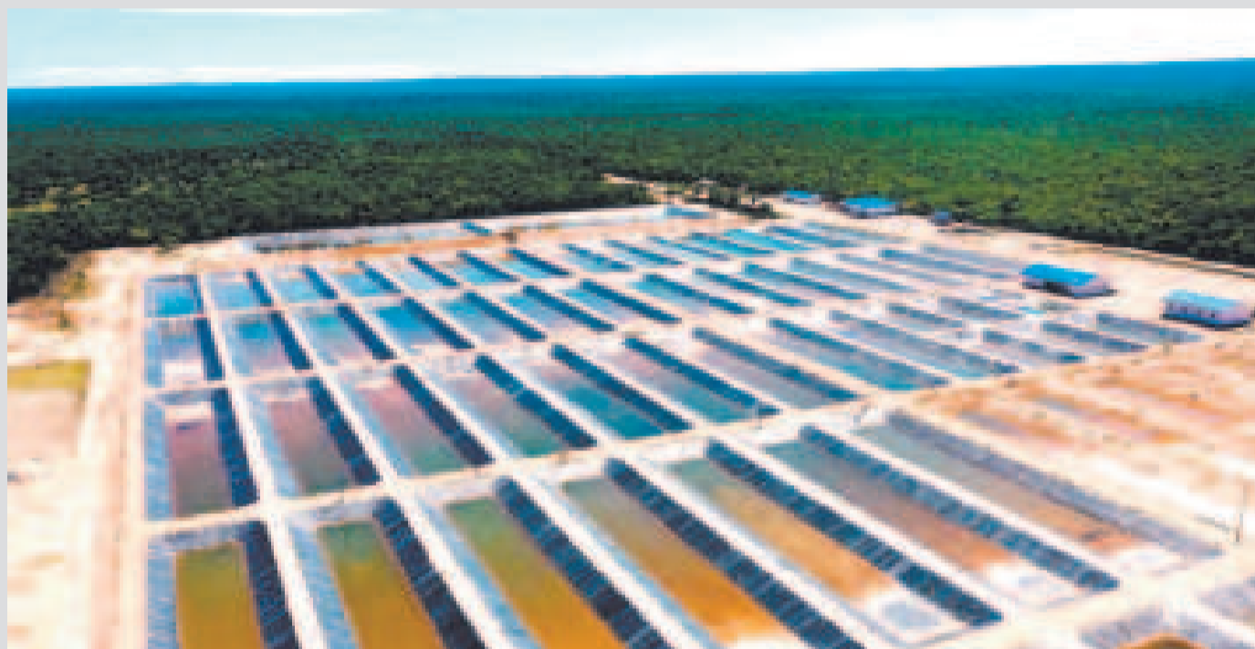
El llenado de las piscinas registra un importante avance en la Planta Piscícola de Villa Montes.

La edificación de esta industria, en tierras chapacas, alcanza un 79,65% de avance físico y un 84,72% en términos financieros.