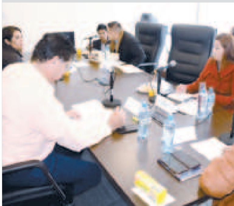
La sesión de la Comisión de Ética.