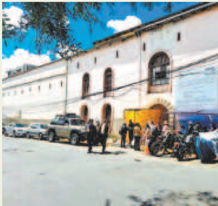
El penal de San Pedro de La Paz.

Limpias rechazó la comparación y la calificó como irresponsable. “Queremos dejar claro que en Bolivia no se gobierna con odio ni represión, sino con reinserción y respeto a los derechos humanos.