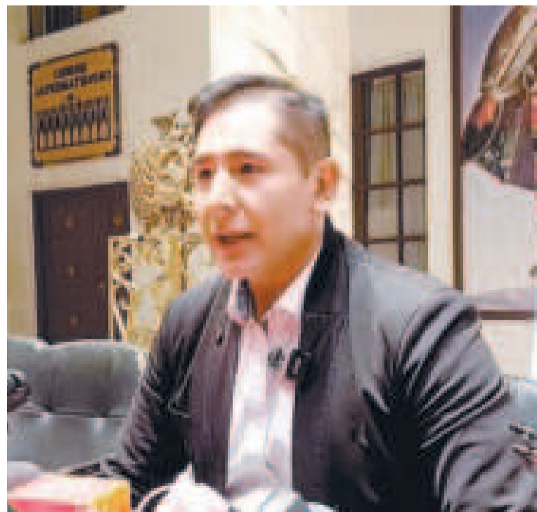
El viceministro de Energías Alternativas, Álvaro Arnez, en conferencia de prensa.

Ambos contratos deberán ser aprobados en la Asamblea Legislativa para poder entrar en vigencia y ejecución.