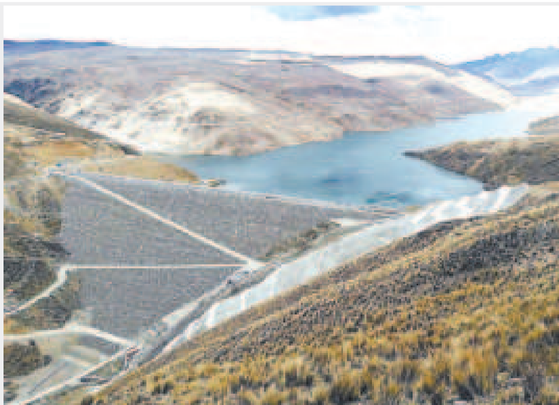
Represa de Misicuni en Cochabamba.

La feria ofrecerá una destacada oferta gastronómica, incluyendo api y tendrá un espacio de juegos para niños. Además se habilitarán puntos de atención en salud para atender cualquier eventualidad.