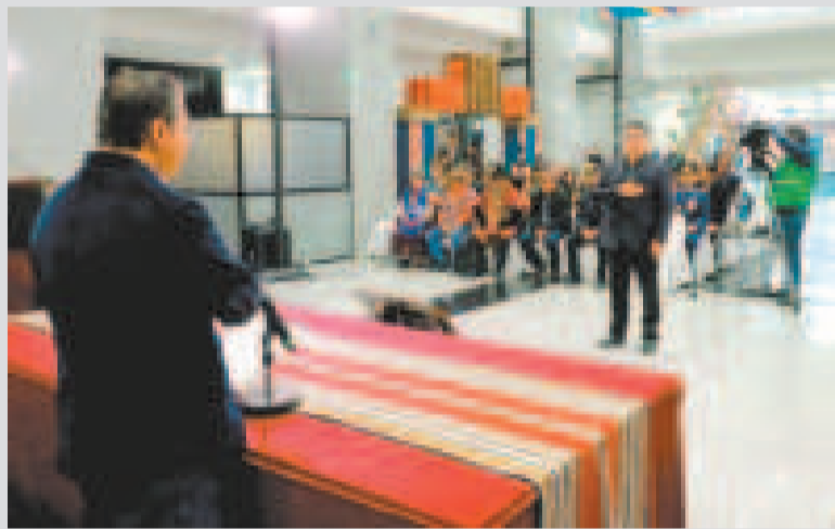
Acto de posesión de la nueva autoridad en la Casa Grande del Pueblo.

La nueva autoridad posesionada recientemente estará a cargo de continuar las políticas de diversificación de la economía del país.