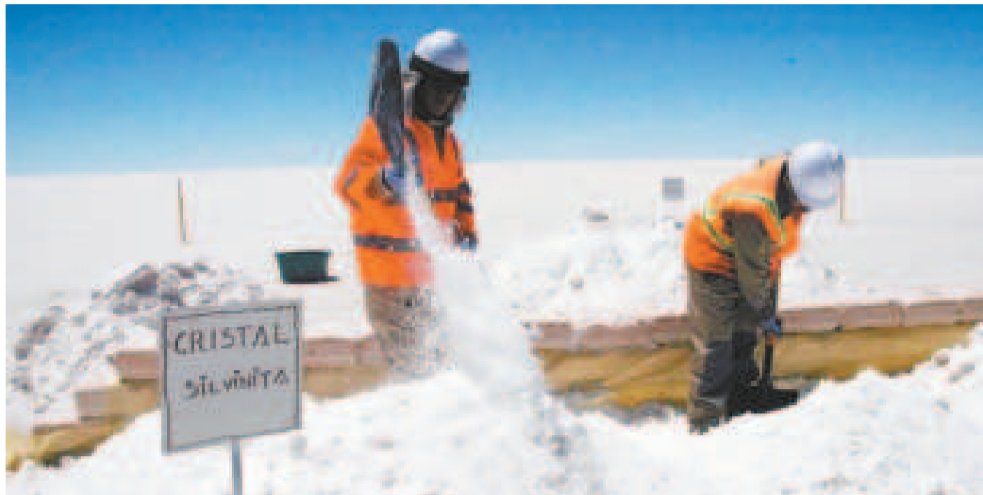
Trabajadores en la planta de litio en el salar de Uyuni, Potosí.