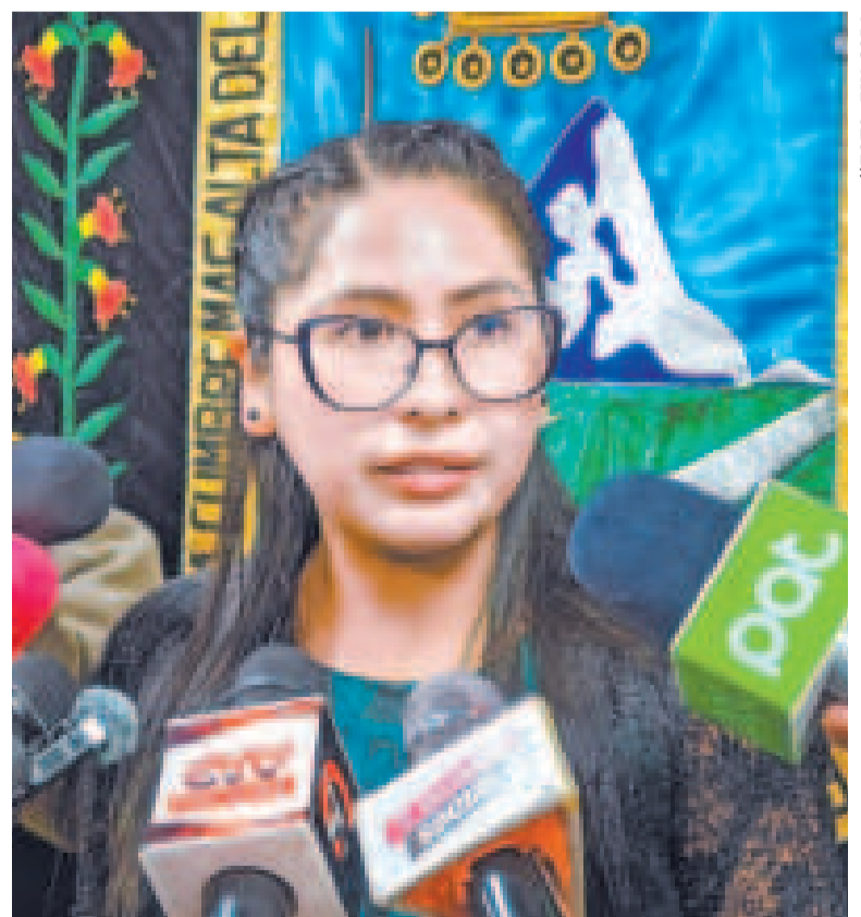
Eva Copa, alcaldesa de la ciudad de El Alto.

Ávila indicó que hay dos partidos más que trabajan para registrar firmas y militantes. Además, expuso que el TSE es respetuoso con el trámite que se tiene.