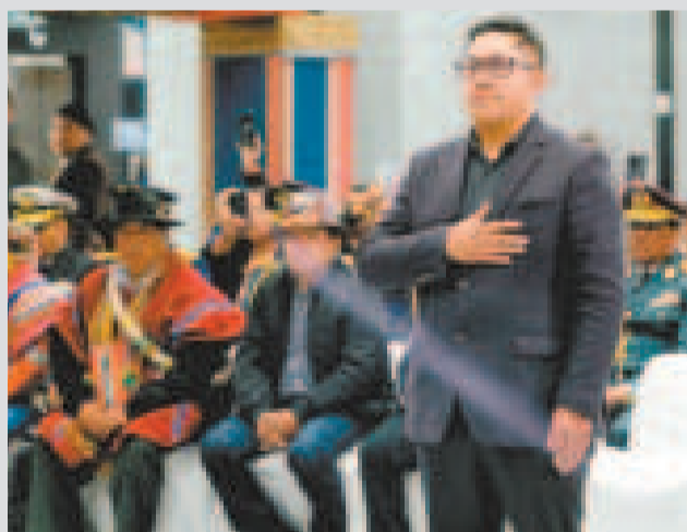
Zenón Mamani, nuevo ministro de Desarrollo Productivo y Economía Plural.