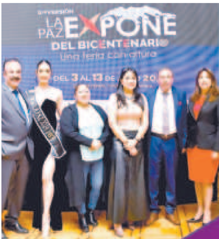
Lanzamiento de la VIII Feria La Paz Expone 2025.