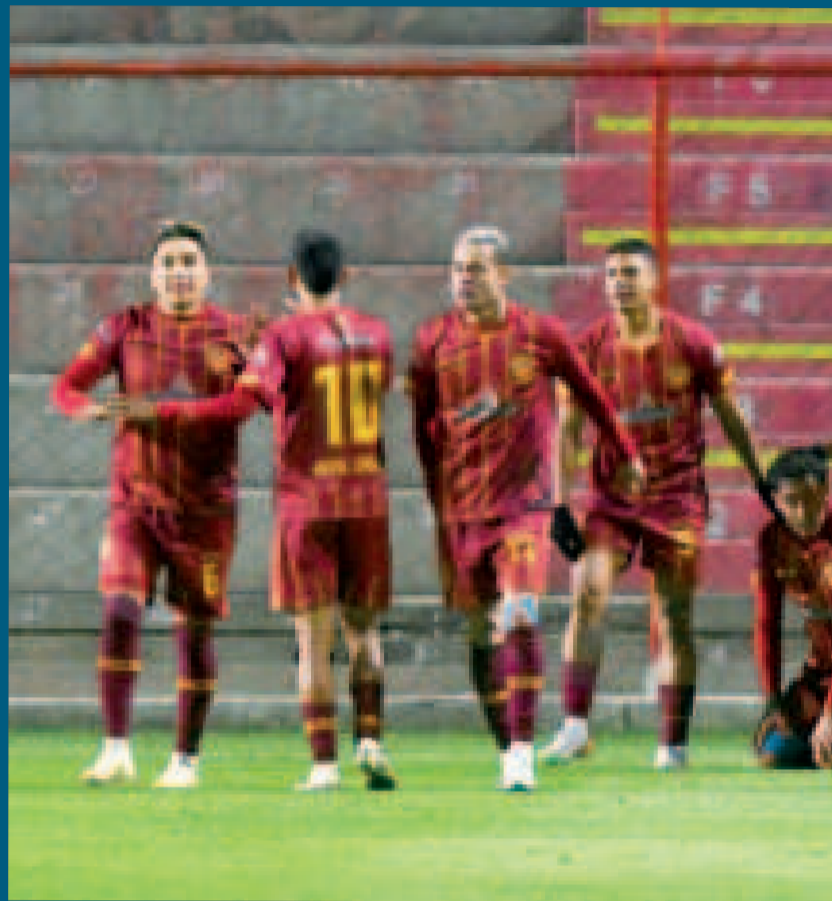
Jugadores de Totora Real Oruro celebran el triunfo en condición de visitante.