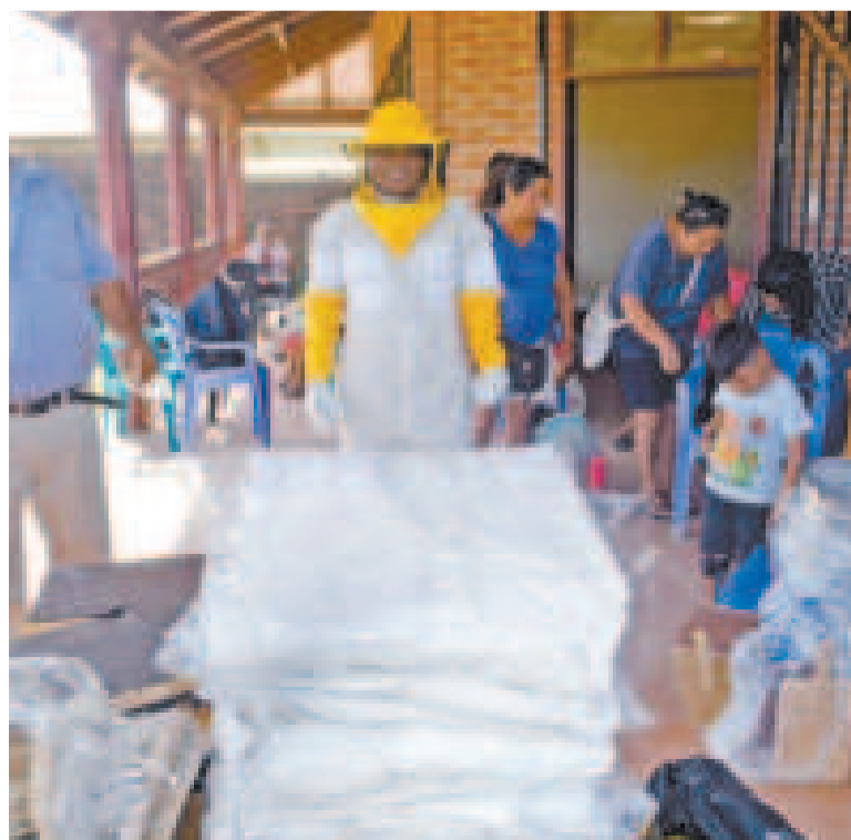
Parte del equipamiento que recibieron las productoras de miel en San Julián.

Según el Ministerio de Desarrollo Rural, el Gobierno se acerca más a la meta de impulsar el crecimiento económico en las zonas productivas y garantizar que los esfuerzos del Estado se traduzcan en mejoras reales para quienes trabajan día a día en el campo.