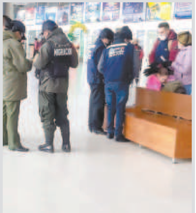
Control en la Terminal Metropolitana de El Alto.

Responsable de Comunicación de la Terminal