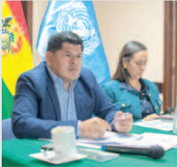
El viceministro Jaime Mamani y la representante de la UNODC en Bolivia, Mónica Mendoza.

nica Mendoza, con el objetivo de hacer seguimiento al proyecto Apoyo de la UNODC a la Implementación de la Estrategia contra el Tráfico Ilícito de Sustancias Controladas y Control de la Expansión de Cultivos de Coca 2021-2025 (BOL/AB6).