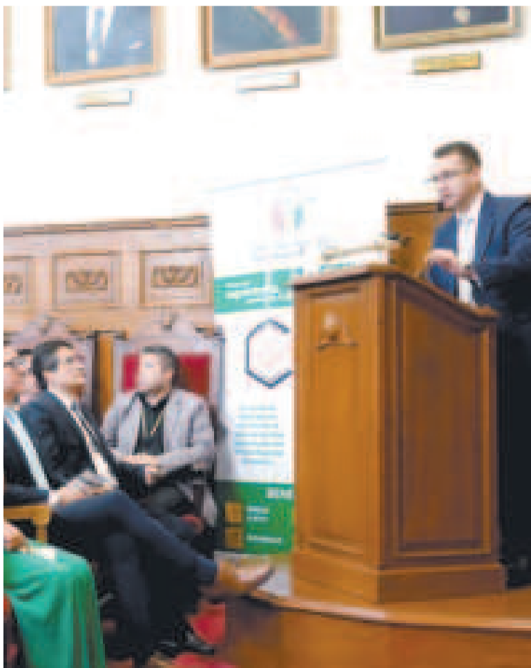
El presidente del TSJ, Romer Saucedo, durante la presentación.