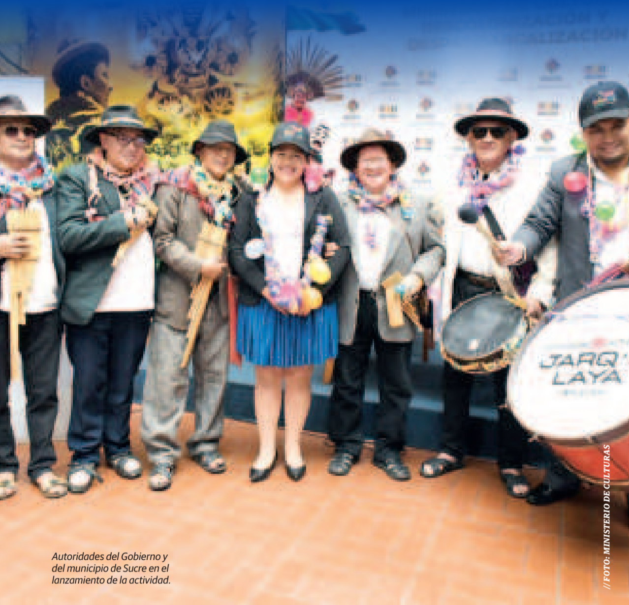
Autoridades del Gobierno y del municipio de Sucre en el lanzamiento de la actividad.