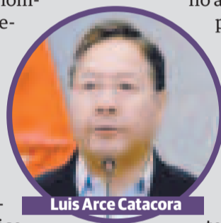
Luis Arce Catacora

Se trata del segundo pronunciamiento público de una organización que respalda la eventual candidatura a la reelección del presidente Arce, de cara a las elecciones generales del 17 de agosto de este año. El 10