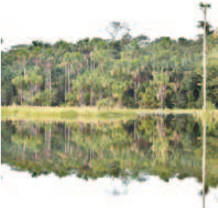
La Reserva Nacional de Vida Silvestre Amazónica Manuripi.