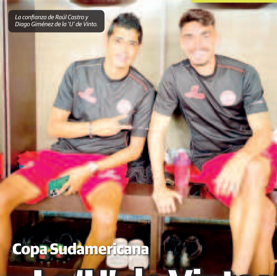
El entusiasmo de los jugadores del elenco potosino.