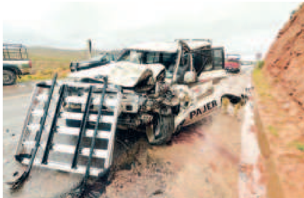
Estado de la vagoneta que impactó con el ómnibus de transporte público.

FALLECIDOS Y 22 HERIDOS es la cifra de muertos por el embarrancamiento de un bus que colisionó con una vagoneta a la altura de la localidad las Leñas, a 90 kilómetros de distancia de la ciudad de Potosí.