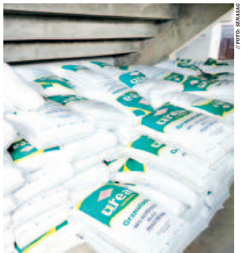
Los sacos de fertilizantes entregados a los productores de algodón.

Pese a que Bolivia está libre de la plaga mencionada, el Senasag tomó medidas preventivas con la instalación de más de 400 trampas en las zonas productoras, como Santa Cruz, Chuquisaca, Tarija y en la frontera con Argentina.