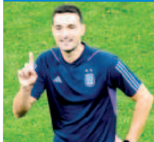
Lionel Scaloni, entrenador de Argentina.

La Albiceleste visitará el viernes 21 a Uruguay en el estadio Centenario de Montevideo; y el martes 25 será local en el estadio Monumental ante Brasil, en el clásico sudamericano.