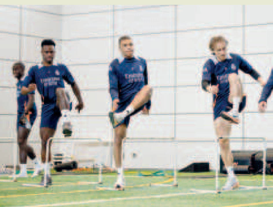
Vinicius Jr. (izq.) comparte la práctica del Real Madrid con sus compañeros Kylian Mbappé y Luka Modric.