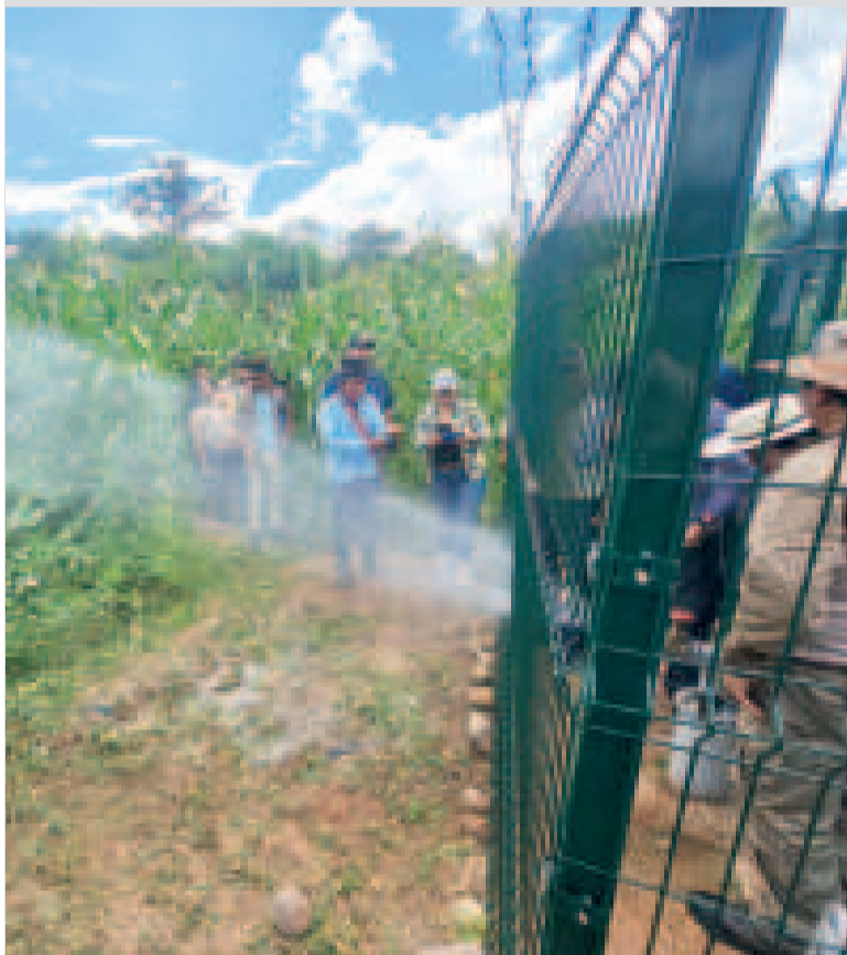
El agua de uno de los sistemas subterráneos entregados.