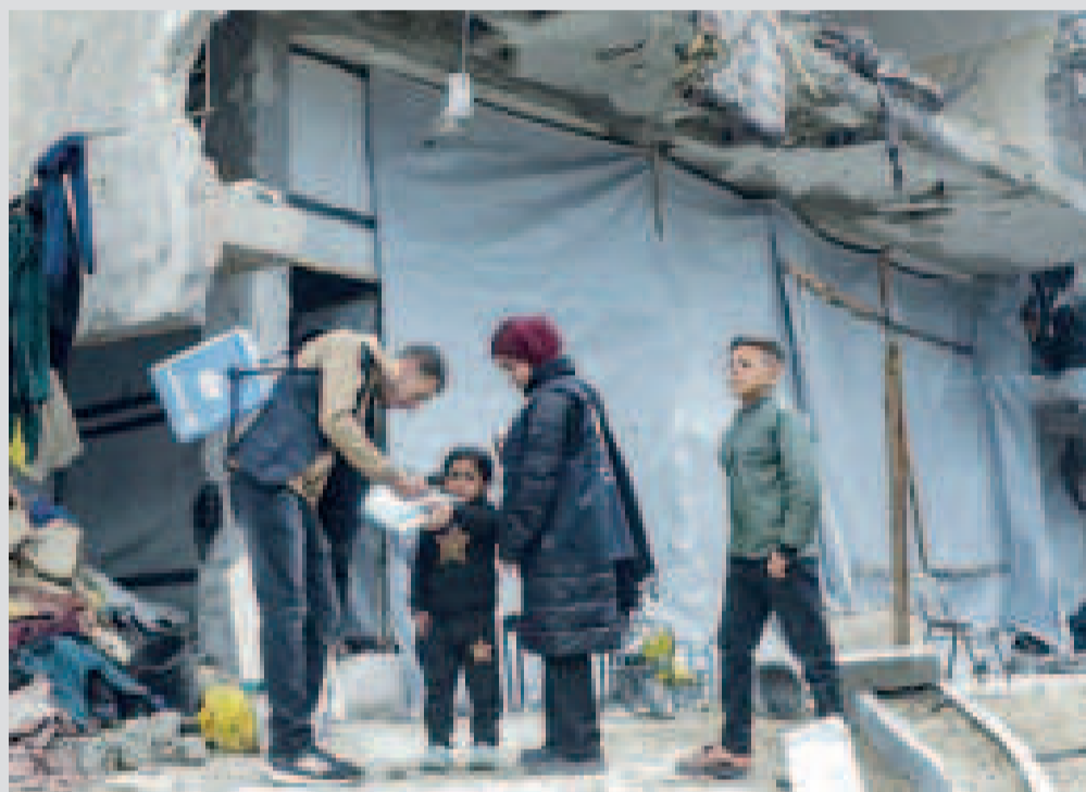
Un niño es vacunado contra la polio en Jabalia, en el norte de la Franja de Gaza.

Sus palabras se producen después de que varios familiares de los secuestrados el 7 de octubre le dieran la espal-