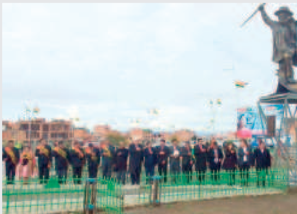
Inicio de los festejos por los 40 años de aniversario de El Alto con la iza de banderas en el distribuidor el Mallku.

Con la consigna “El Alto de pie, nunca de rodillas”, más de 220 urbanizaciones participaron en el desfile que recorrió desde la extranca Senkata hasta la avenida Integración.