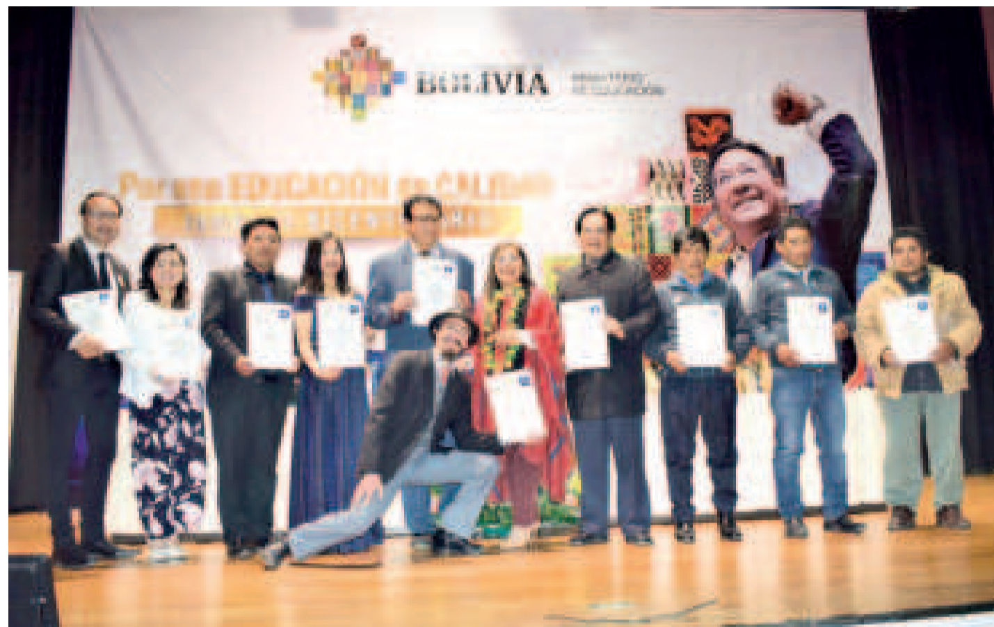
Entrega de certificados de competencia a trabajadoras y trabajadores paceños de distintos rubros laborales en La Paz.

“Son algunas actividades planificadas para resaltar este año importante que es el Bi-