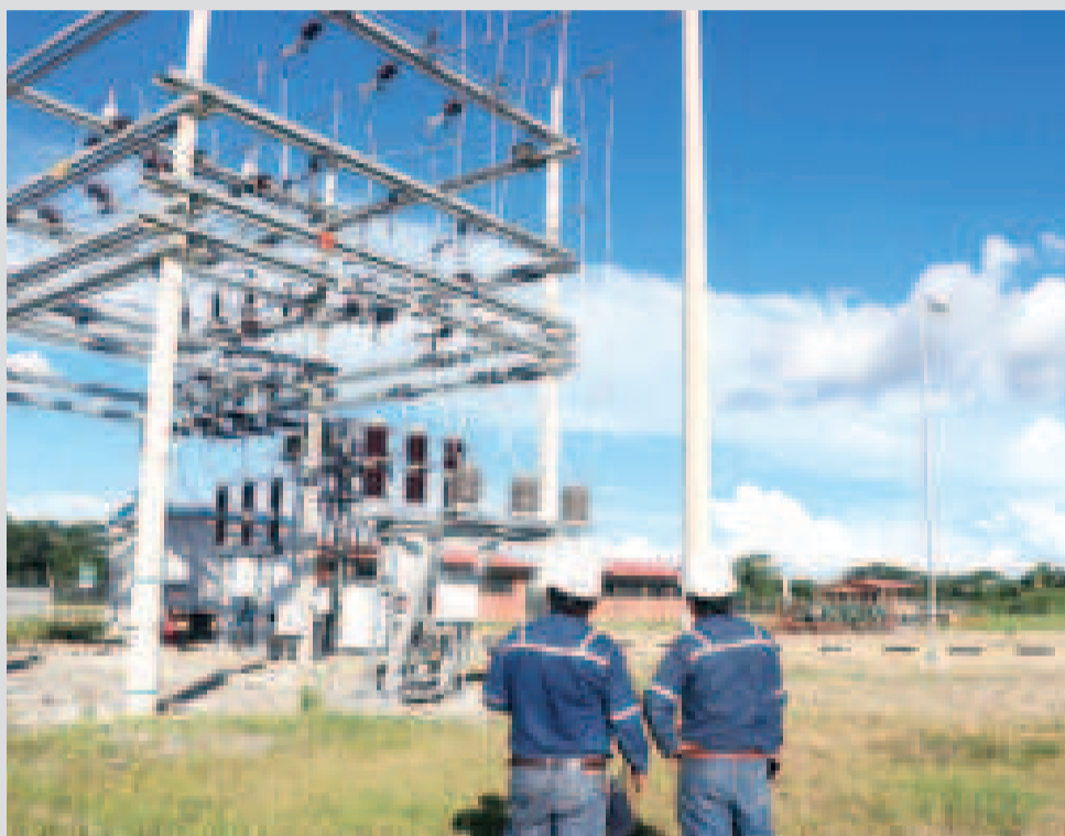
Infraestructura de electrificación en el área rural.

El ministro de Hidrocarburos y Energías, Alejandro Gallardo, reportó que en el área rural se llegó al 86,5%, y al 99,3% en zonas urbanas.