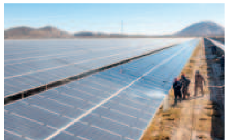
Un proyecto de energía solar de ENDE.

“Posterior a 2034 ya estaríamos entrando a lo que será una