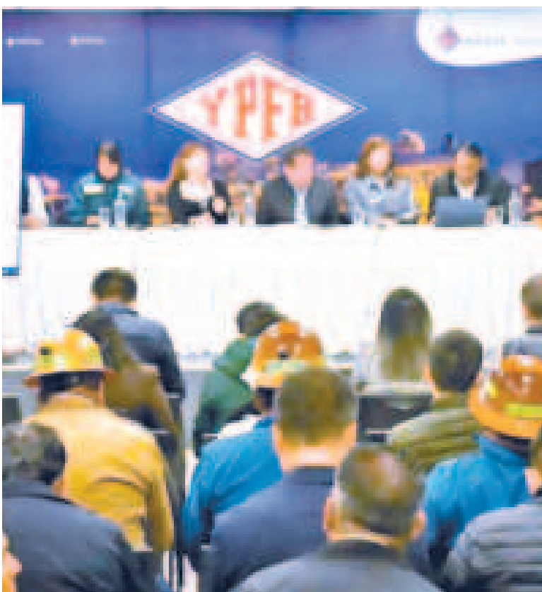
El taller que se desarrolló en La Paz.