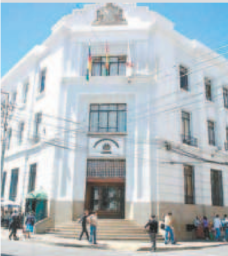
Fachada de la Fiscalía General del Estado.