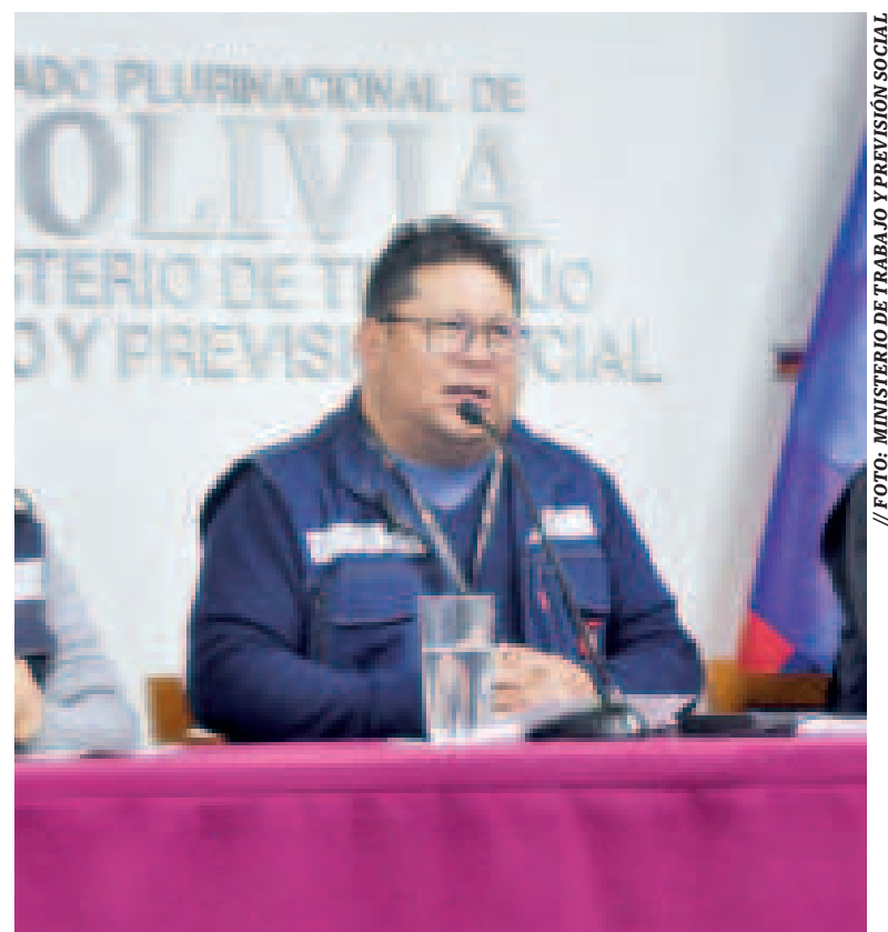
El Ministro de Trabajo en conferencia de prensa.

“Todo esto tiene como fin colaborar con nuestros compañeros trabajadores y trabajadoras para que puedan asistir regularmente a sus fuentes de trabajo, puedan asistir cómodamente a sus fuentes de trabajo”, enfatizó.