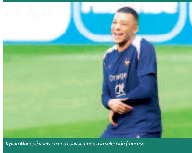
Kylian Mbappé vuelve a una convocatoria a la selección francesa.

Delanteros: Bradley Barcola, Ousmane Dembélé, Désiré Doué, Randal Kolo Muani, Kylian Mbappé, Michael Olise y Marcus Thuram.