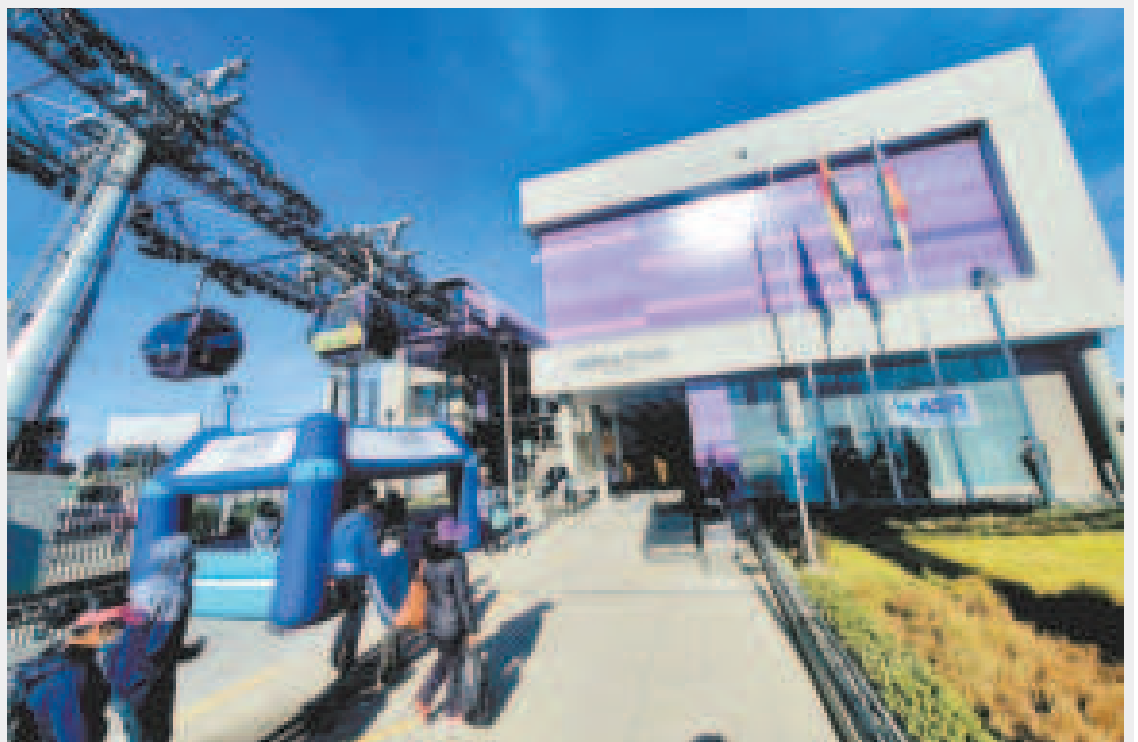
Una estación de la línea Morada de Mi Teleférico.