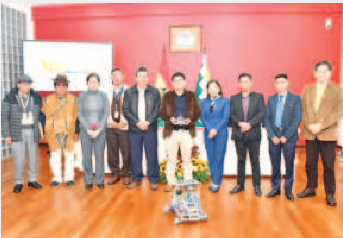
Autoridades del Ministerio de Educación inauguran el XI Encuentro Plurinacional de Maestras y Maestros Educa Innova.