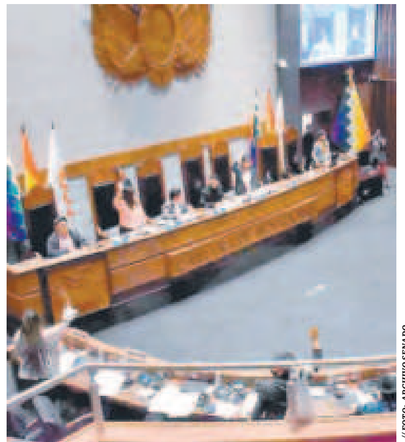
El Senado en una sesión.