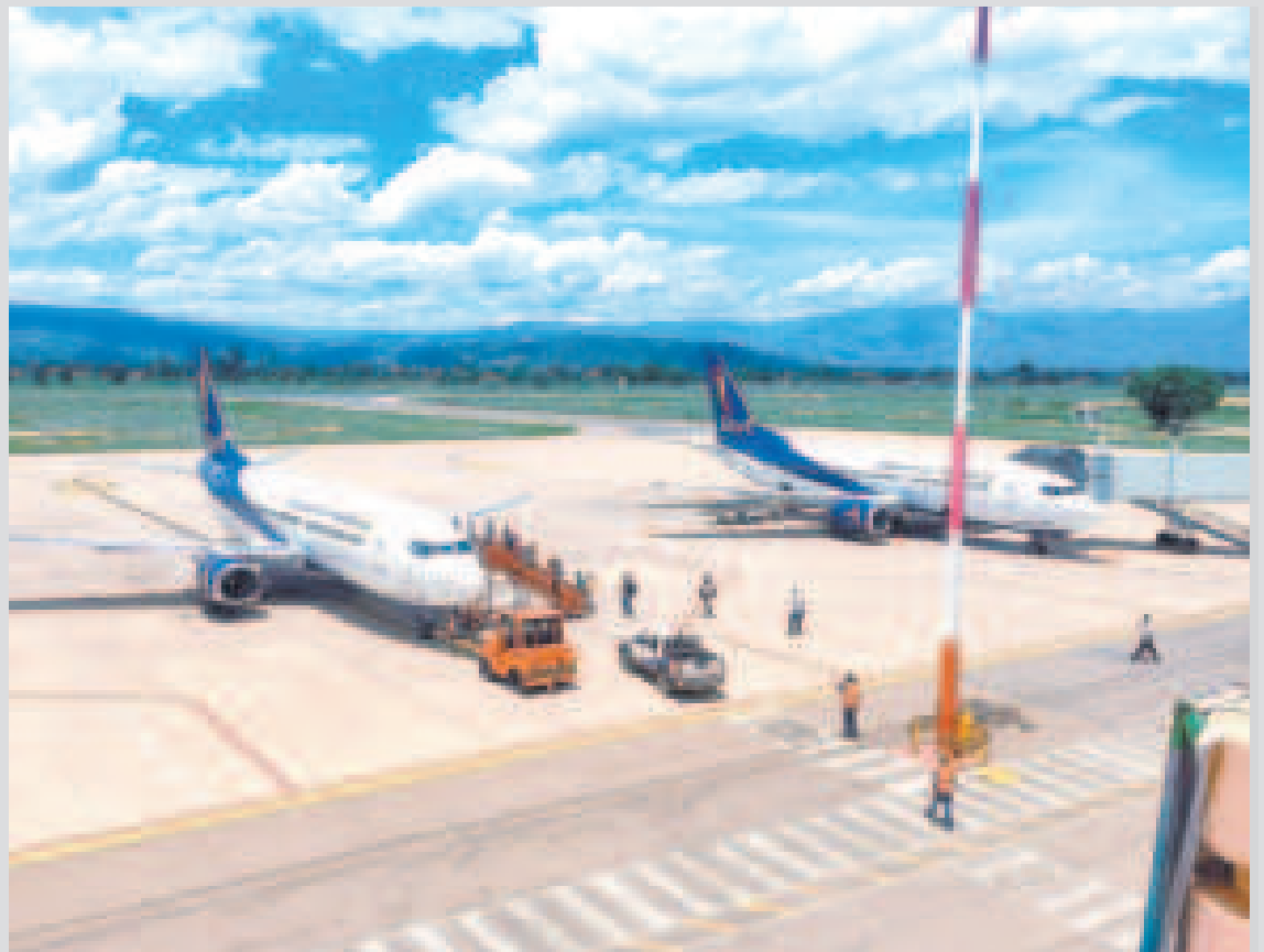
Aviones de la empresa aérea estatal BoA.