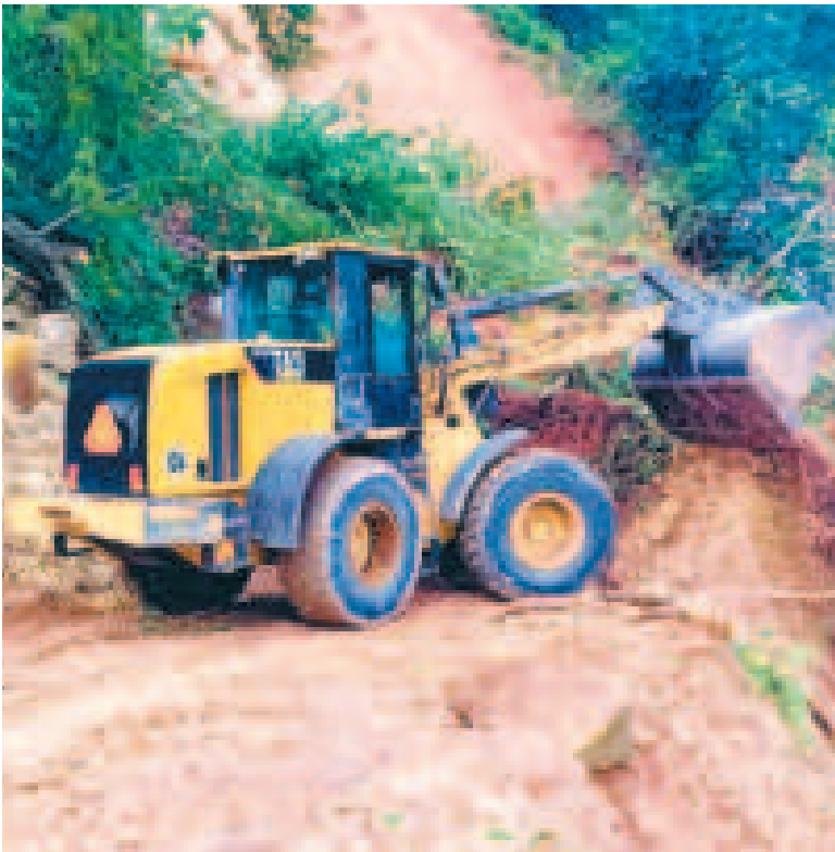
Los trabajos de emergencia por los derrumbes en carreteras.