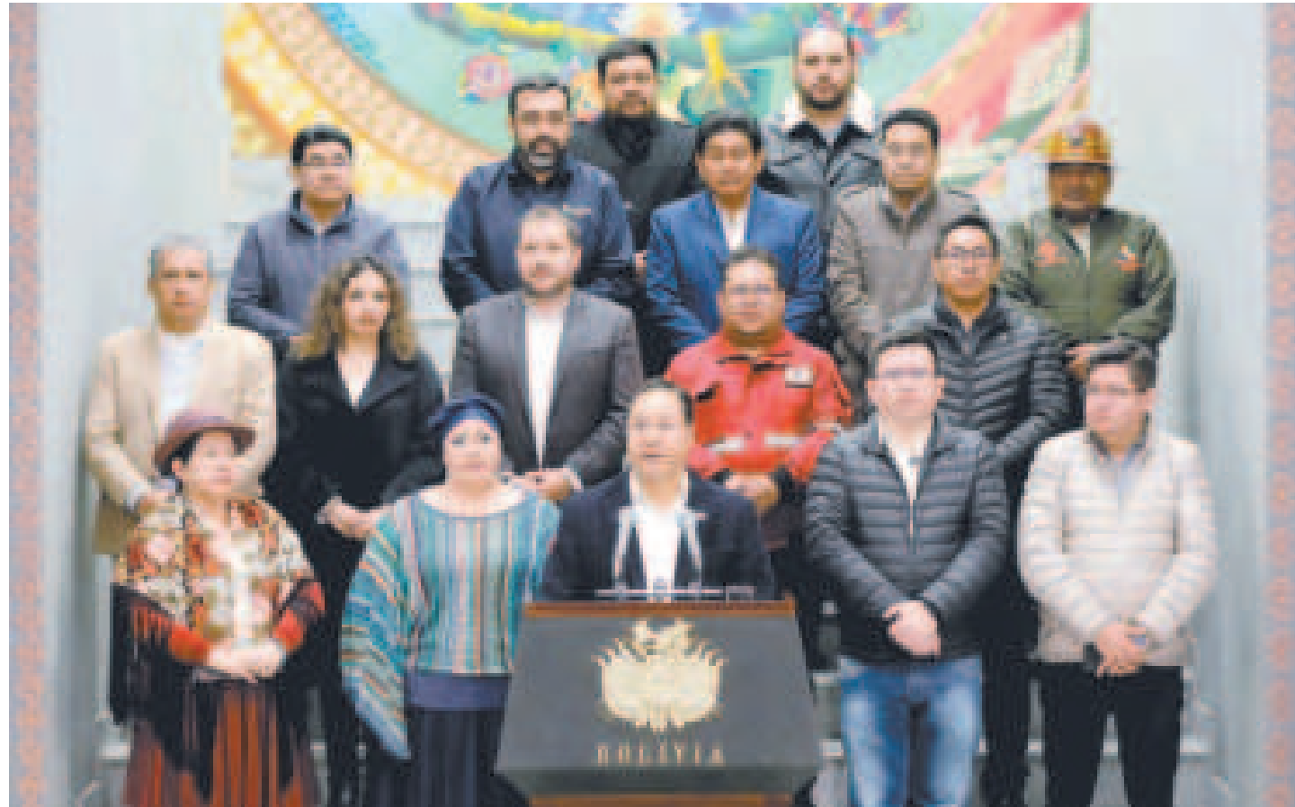
El presidente Arce junto a sus ministros en la Casa Grande del Pueblo.

“Para nosotros (como COD) en Tarija son totalmente acertadas estas 10 medidas que anunció el presidente Arce, que van a garantizar y tranquilizar a todos los ciudada-