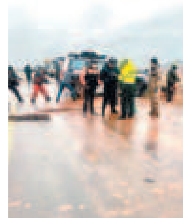
Accidente de tránsito.

“No podemos seguir permitiendo este tipo de crímenes atroces contra la niñez. Una niña de un año y tres meses no podía hablar, ni siquiera gritar y el padrastro de 17 años que, sin piedad, la viola y posteriormente la mata (...). Si bien el Código Niño, Niña y Adolescente dice ‘a los 16 años la pena máxima es de seis años’, por encima de nuestras normativas se encuentran los estándares internacionales”, aseveró en entrevista con Bolivia TV.