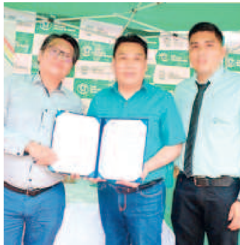
Entrega del reconocimiento a la CBES por parte de la autoridad de la Asuss.