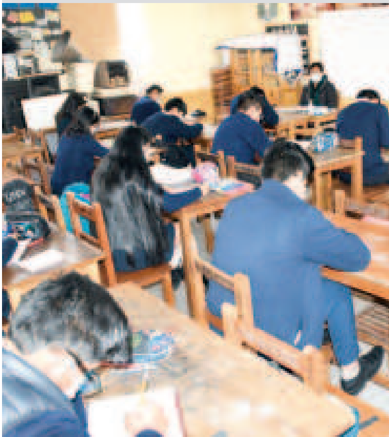
Las direcciones departamentales de educación decidirán la modalidad de clases.