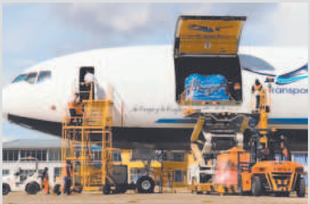
Los puentes aéreos para el traslado de alimentos son una estrategia para garantizar la seguridad alimentaria.

En ese sentido, la medida del puente aéreo busca paliar esta crisis y garantizar el abas-