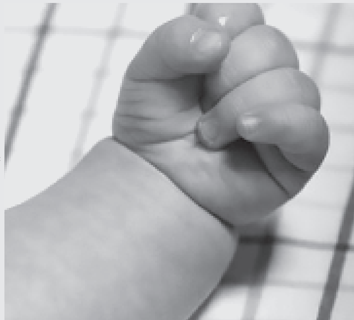
Infanticidio de una bebé de un año y tres meses en Santa Cruz.