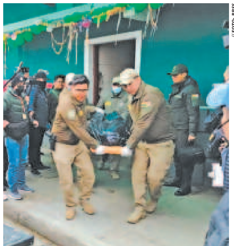
Efectivos de la FELCC en el levantamiento del cuerpo de la víctima.

Por su parte, la dirigente de las trabajadoras nocturnas lamentó la trágica muerte de su compañera y expresó su preocupación por la seguridad en estos establecimientos. Explicó que los cuartos cuentan con botones de pánico para casos de emergencia, pero sospecha que la víctima fue atacada de manera sorpresiva, sin oportunidad de activarlo.