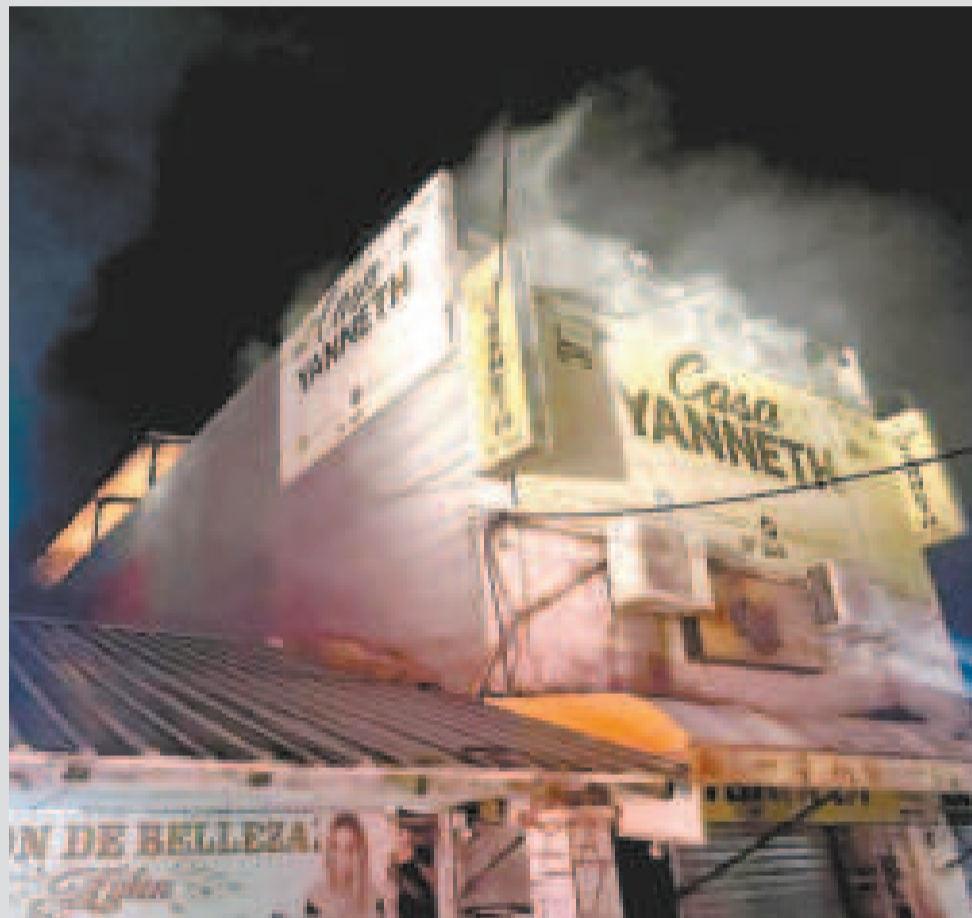
Incendio de magnitud en el antiguo mercado Los Pozos.

El centro comercial afectado albergaba múltiples puestos de venta y locales comerciales. Se espera que en las próximas horas se realicen peritajes para determinar el origen del siniestro y evaluar los daños materiales ocasionados.