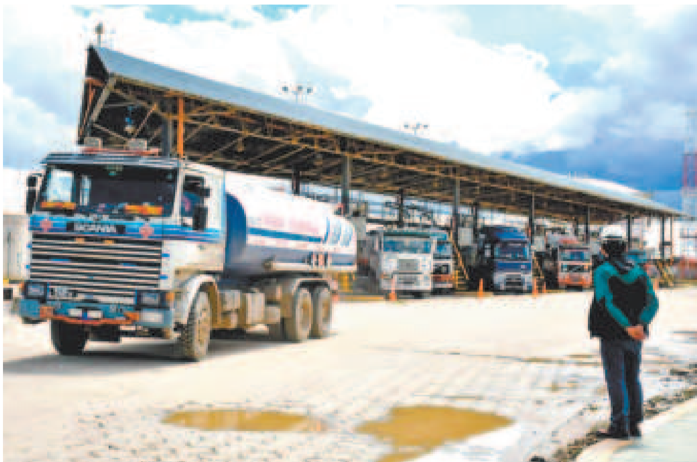
Un camión cisterna de combustibles en la planta de almacenaje Senkata, El Alto, de YPFB.

Se confirmó que acabó el desembarque del primer buque en Arica con 47 millones de litros y seguirá el segundo navío en los próximos días.