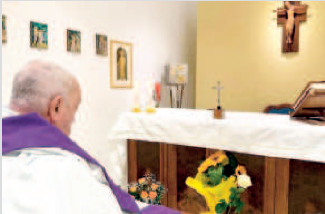
El Vaticano comparte la primera foto del Papa luego de un mes hospitalizado.

El pontífice sigue hospitalizado por una neumonía bilateral. Los médicos confirmaron que el Santo Padre está progresando en su recuperación.