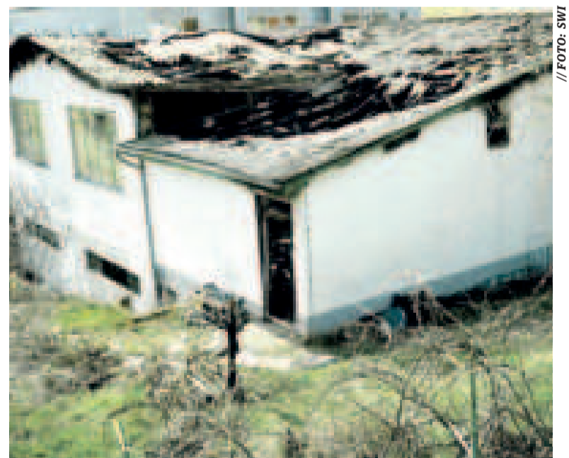
La discoteca de Macedonia del Norte.

"Lo más probable es que las chispas llegaran al techo hecho de un material fácilmente inflamable, y luego, en muy poco tiempo, el fuego se extendió por toda la discoteca y se formó un humo espeso", agre-