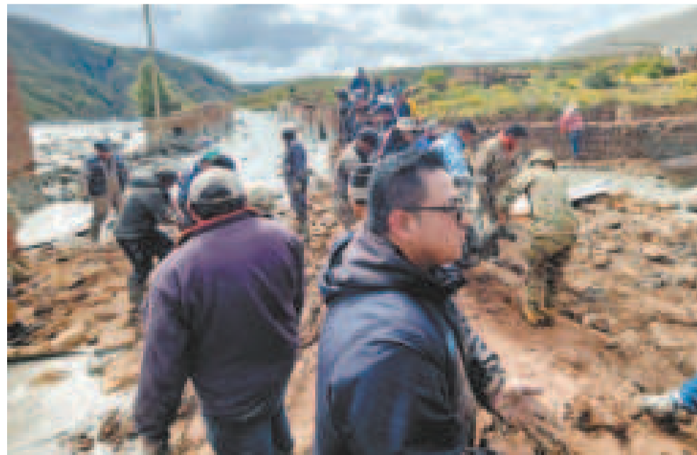
Apoyo a las familias damnificadas por la mazamorra en Llalagua.