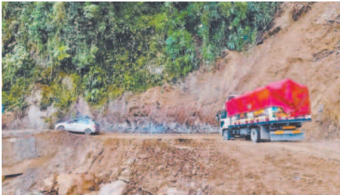
La ABC informó que se dio transitabilidad a todo tipo de vehículos en la progresiva 102+680 Abra de las Brujas, tramo Caranavi-Alto Beni.

Claure aseguró que el tránsito en este sector ya no sufrirá nuevas interrupciones y anunció que los trabajos reconstructivos comenzarán de inmediato, apenas cesen las lluvias, con recursos del Tesoro General de la Nación, gracias al Decreto 5350 aprobado por el gobierno de Luis Arce.