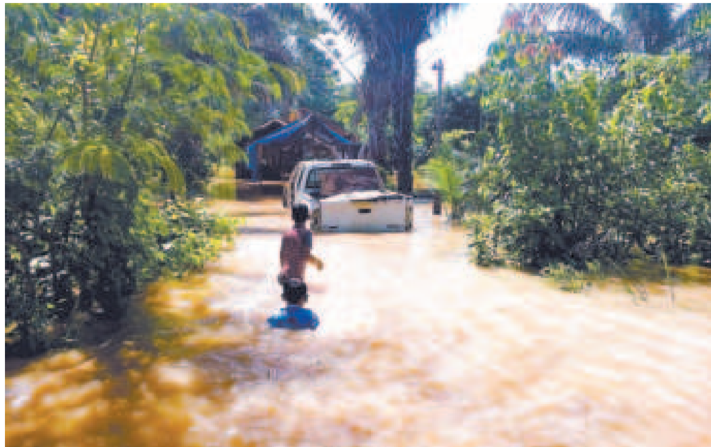
El dirigente de la FAM-Bolivia destacó que los municipios enfrentan una emergencia crítica, con más de 130 afectados y pérdidas materiales incalculables.

“Estamos en emergencia, no tenemos los recursos nece-