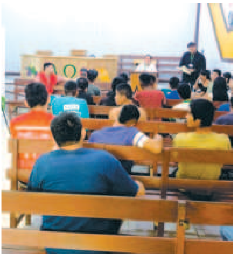
Jornada de socialización dirigida a privados de libertad del penal de Mocoví.