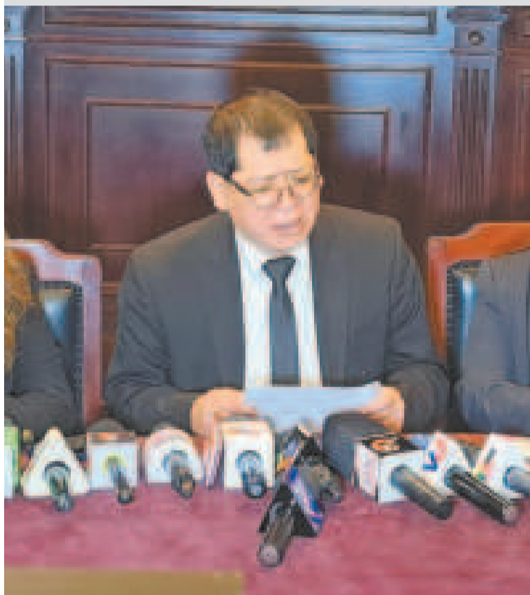
Autoridades del Tribunal Departamental de Justicia de La Paz.