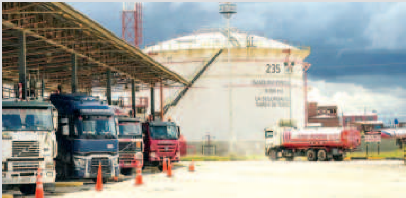
Cisternas en la planta de Senkata de la ciudad de El Alto.

El Presidente confirmó que durante esta semana se recibirán más de 46,4 millones de litros de diésel y 20,4 millones de litros de gasolina.