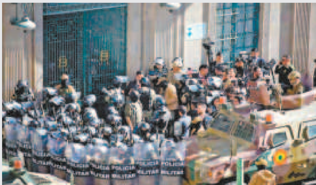
Intento de golpe de Estado del 26 de junio de 2024.

que no se replica en las circunstancias actuales.