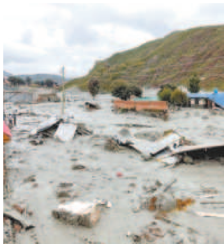
Desastre por la mazamorra.

Las afectaciones se reportan en las nueve regiones de Bolivia y dos de ellas, La Paz y Chuquisaca, se han declarado en “emergencia departamental”, señaló.