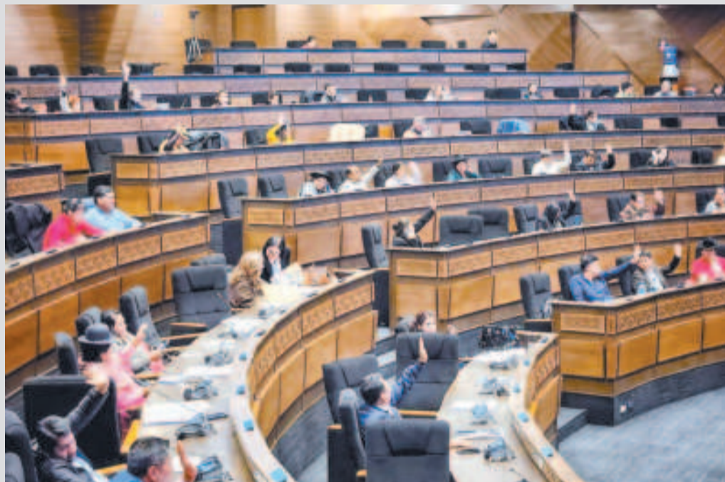
La Asamblea Legislativa demora la aprobación de varios créditos externos.

El proyecto de ley que respalda este crédito fue presentado el año pasado, y aunque fue aprobado por la Cámara de Diputados en enero de este