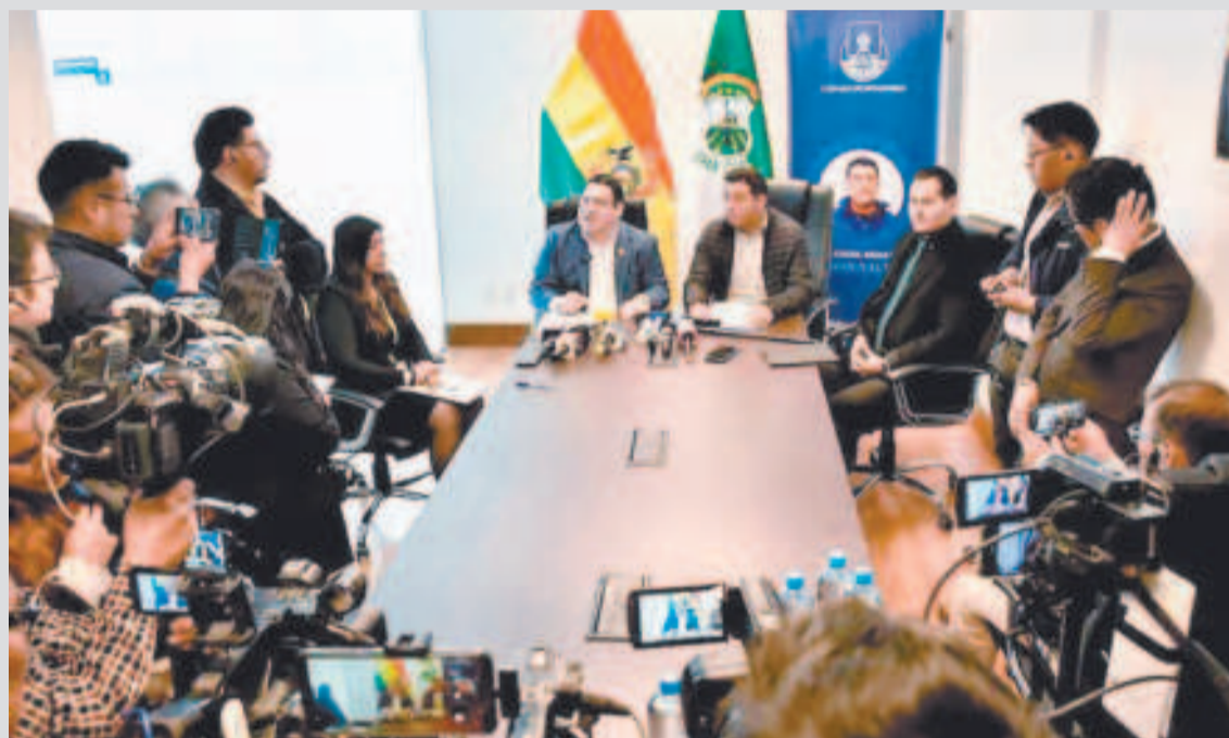
El fiscal general del Estado, Roger Mariaca, presenta el proyecto de ley.

penal de herramientas modernas y efectivas para enfrentar la violencia sexual digital, protegiendo a las víctimas desde el primer momento y promoviendo una respuesta coordinada del Estado y la sociedad”, sostuvo.