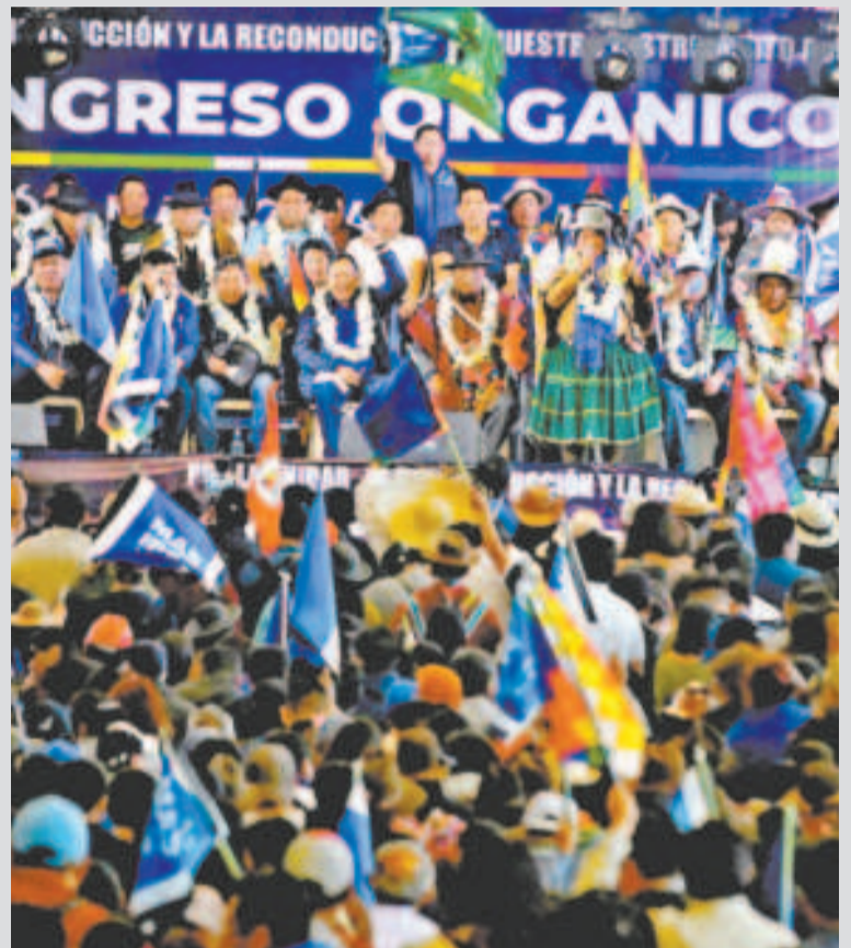
El presidente Luis Arce y el vicepresidente David Choquehuanca en el congreso del MAS.