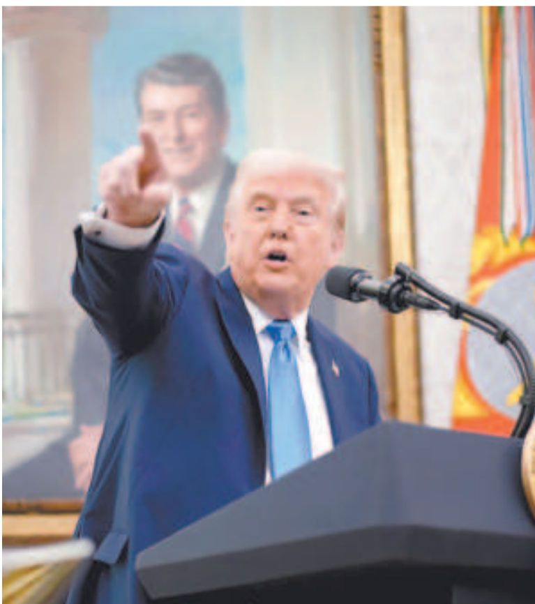
El presidente estadounidense, Donald Trump.