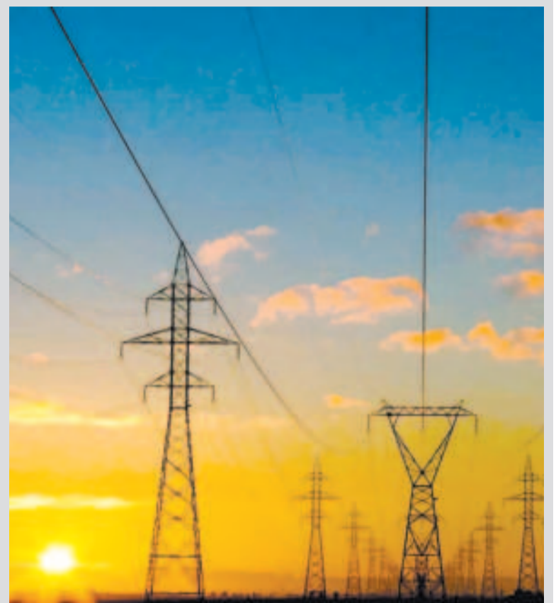
Instalaciones energéticas rusas que fueron blanco de ataques.

Los recientes ataques contra instalaciones energéticas rusas son una muestra de que el líder ucraniano, Volodimir Zelenski, no quiere la paz, al tiempo que proyecta una imagen de inestabilidad y doble discurso, dijeron a Sputnik las internacionales María Teresa Gutiérrez del Cid y Talya Iscan.