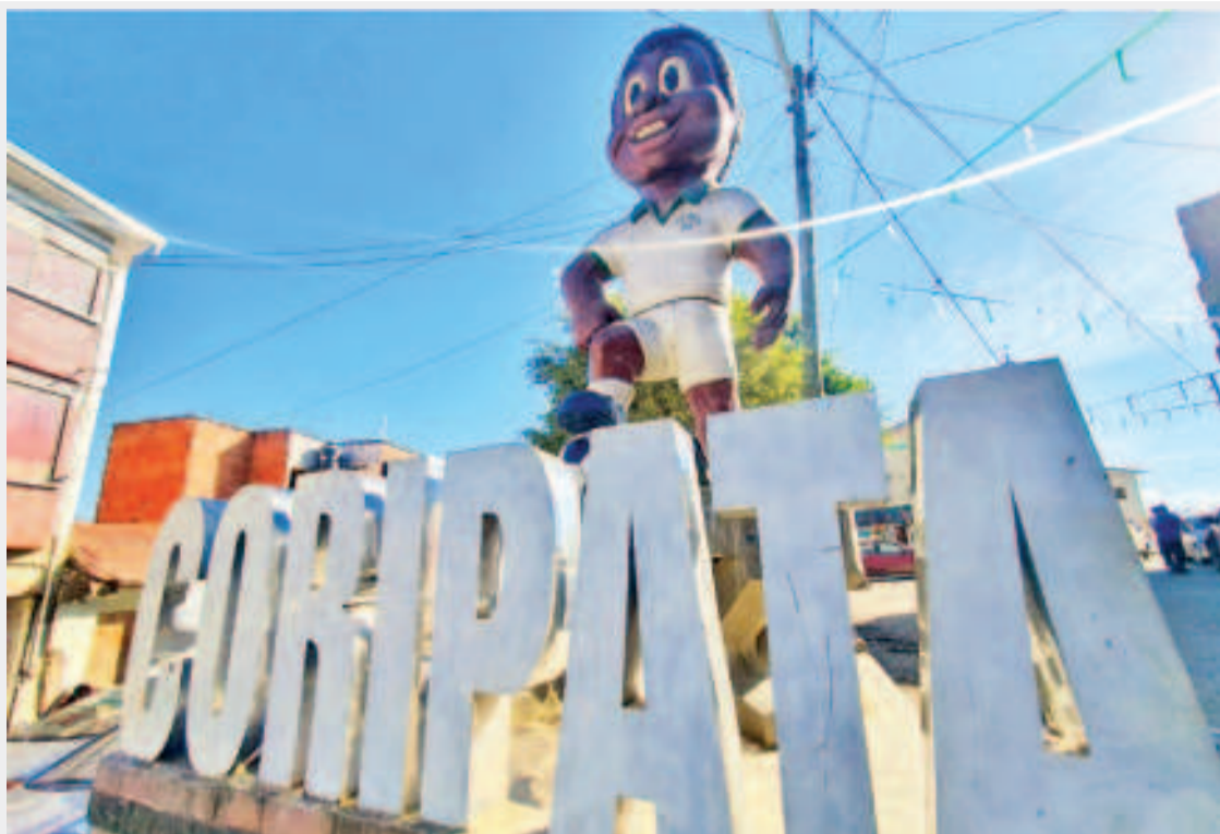
Coripata, localidad ubicada en la región Nor Yungas, de La Paz.