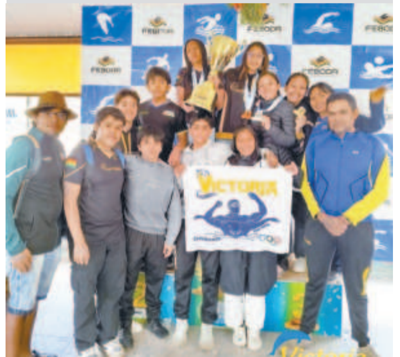
Integrantes del equipo Victoria que ganó el Circuito Nacional.

La siguiente parada será la tercera fecha que se desarrollará el sábado 24 de mayo en una sede por definir.