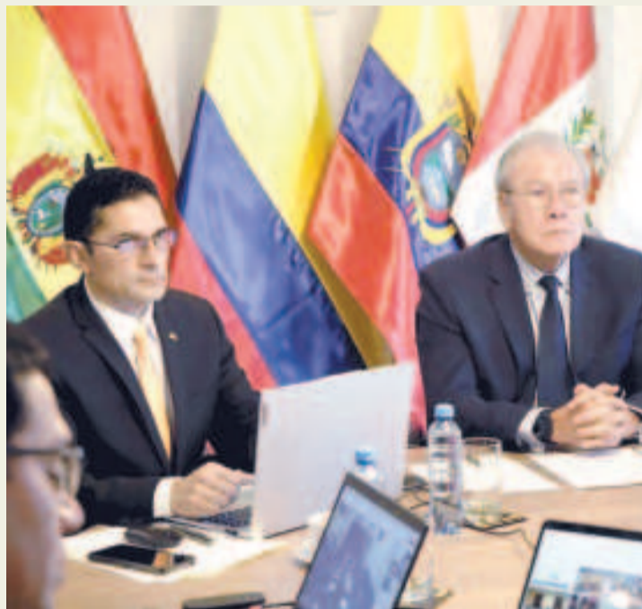
Reunión de la Comunidad Andina de Naciones en Quito, Ecuador.

el corto plazo. En ese sentido, destacó la reciente firma de un memorando de entendimiento entre la Secretaría General de la Comunidad Andina y la Oficina de las Naciones Unidas contra las Drogas y el Delito (ONUDD), que facilitará la colaboración en la lucha