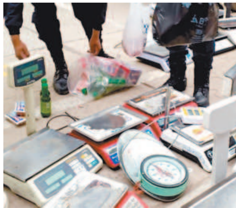
Las balanzas descalibradas que fueron decomisada en los controles.

Las autoridades hicieron un llamado a los comerciantes para que cumplan con las normativas vigentes y exhortaron a la ciudadanía a denunciar cualquier irregularidad en los mercados. Anunciaron