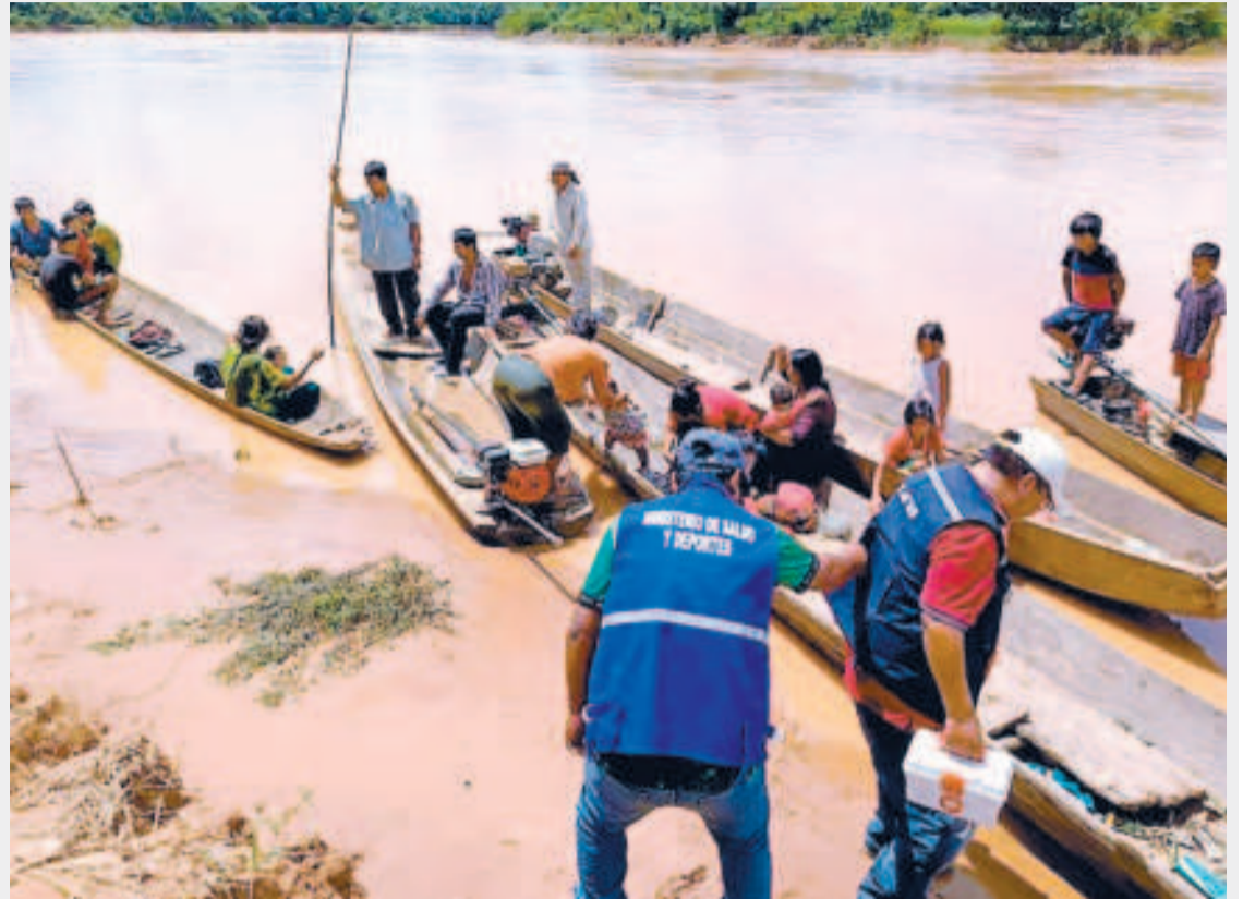
Brigadas médicas recorren varios municipios y comunidades afectados por las inundaciones.

El Senamhi recordó que se mantiene la alerta roja hasta el 5 de abril por el inminente desborde en la cuenca de los ríos Pilcomayo, Grande, Parapetí (Chuquisaca), Ichilo, Chapare, Coroico, Boopi, Tipuani, Mapiri, Rapirrán, que afecta a los departamentos de Tarija, Chuquisaca, Potosí, Cochabamba, Beni, norte y Yungas de La Paz y Pando.