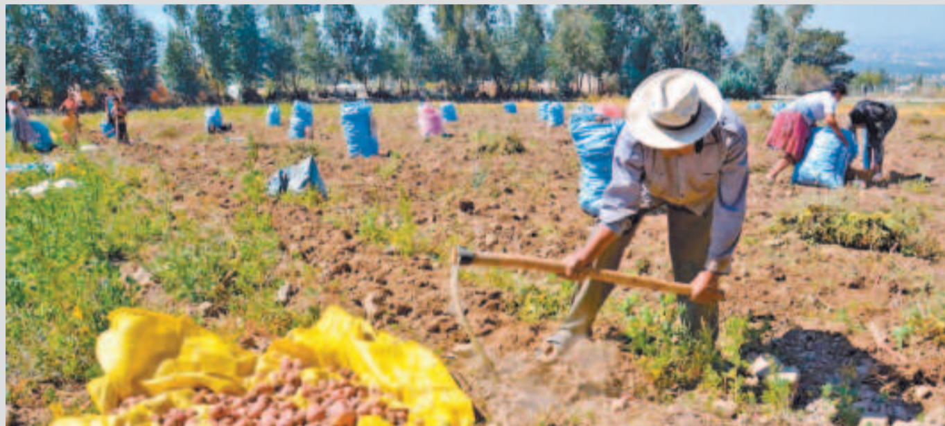
Comunidad de San Lucas.

A través del Fondo de Desarrollo Indígena se pretende fomentar la producción de alimentos frente a la afectación por las lluvias y otros fenómenos del clima.