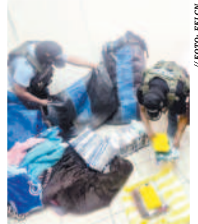
La droga incautada.

proyectos de conservación, de rehabilitación de las carreteras en el país; luchar contra la corrupción y trabajar en las obras como el asfaltado La Joya-Choquechambi; la carretera Botijlaja-Caquiaviri; los tramos I y II de la carretera Escoma-Charazani; el tramo II de la carretera Unduavi-Chulumani; la doble vía Confital-Bombeo; el tramo I de la carretera doble vía Oruro-Challapata (Oruro-Cruce Vinto-Cruce Huanuni); la ampliación a ocho carriles de la carretera La Paz-Oruro (tramo Senkata-Apacheta); y la doble vía Sucre-Yamparáez, considerada una obra del Bicentenario.