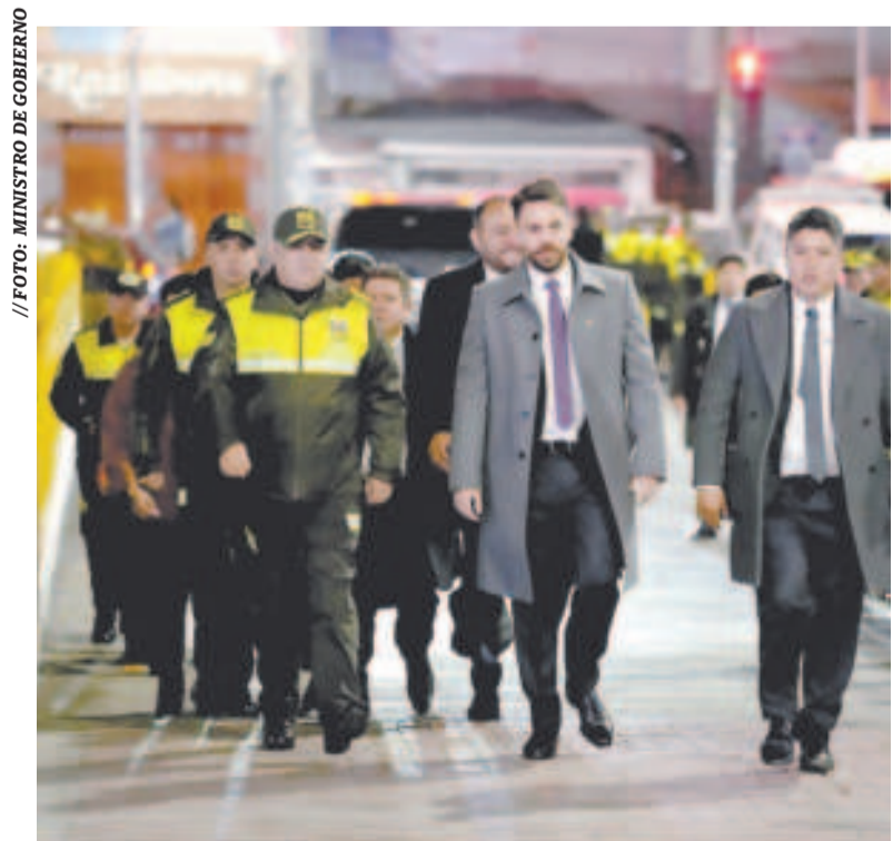
El ministro de Gobierno, Eduardo Del Castillo, y jefes policiales.

Detalló que el plan comprende la prevención antes que la represión; fortalecer la investigación de casos y la desarticulación de bandas organizadas, además de una coordinación internacional.