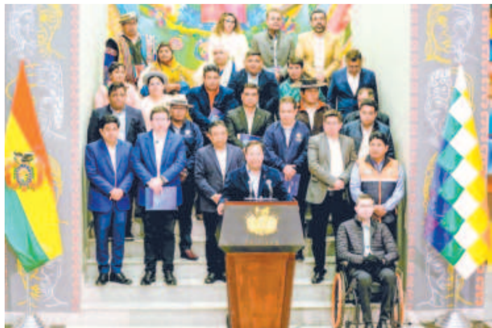
El presidente Luis Arce junto a las autoridades de los gobiernos autónomos a la finalización del Consejo Nacional de Autonomías.