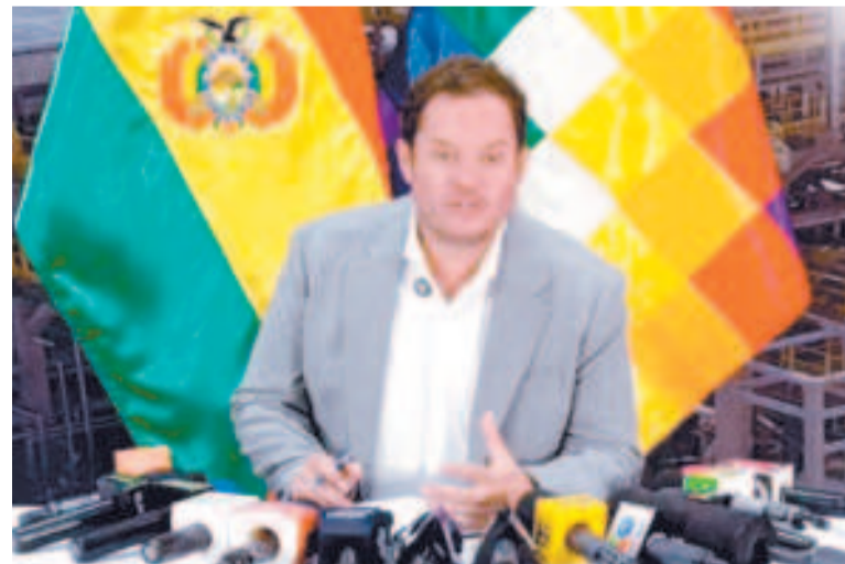
El presidente de la estatal petrolera, Armin Dorgathen.

La semana pasada, la Confederación Nacional Hidrocar-