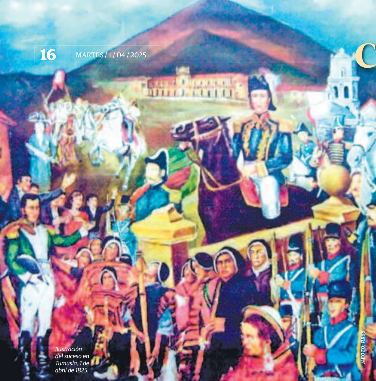
Ilustración del suceso en Tumusla, 1 de abril de 1825.