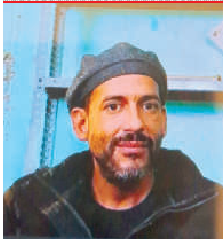
El encarcelado gobernador Fernando Camacho.