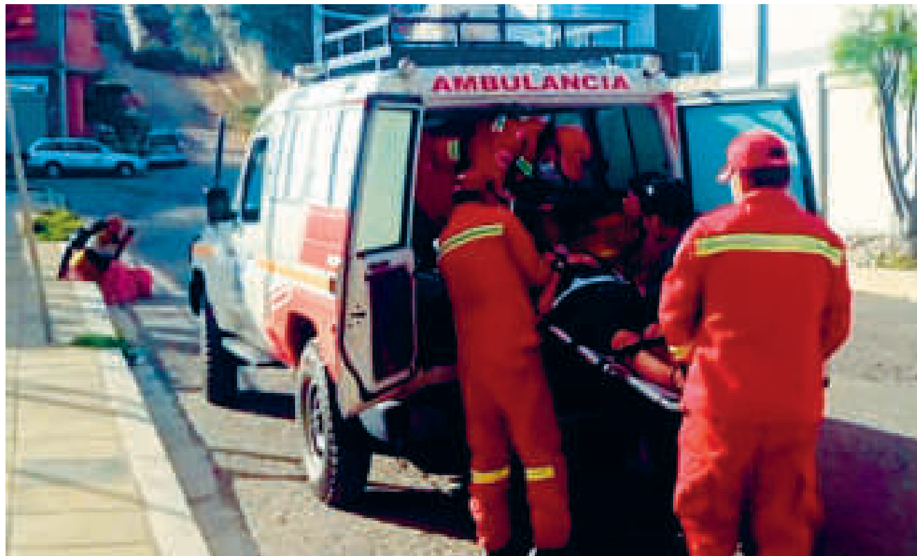
Una ambulancia brinda socorro a una de las estudiantes afectadas.