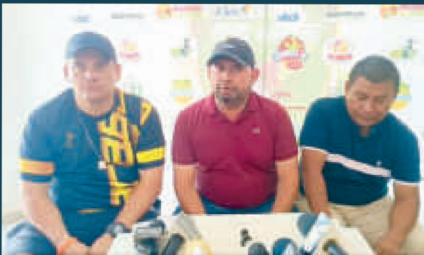
Dirigentes del club Libertad Gran Mamoré, en la conferencia de prensa.