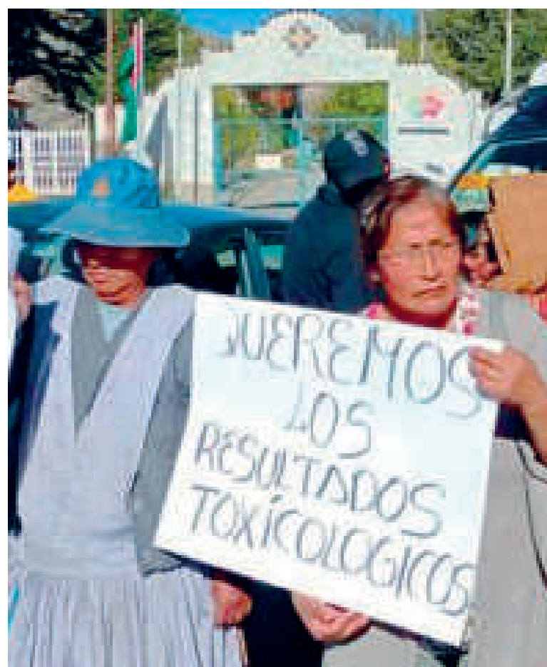
Padres de familia, durante una de sus manifestaciones.

Actualmente, la investigación está en manos del Ministerio Público, cuyos peritos efectuaron una recolección de muestras de agua y otros elementos en este establecimiento educativo.