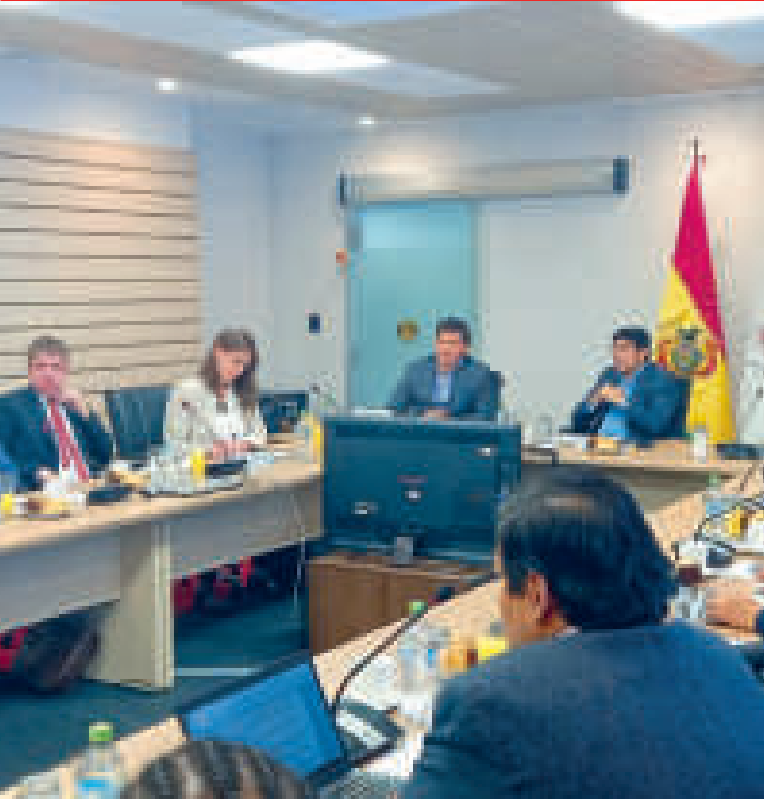
Reunión entre el GruS y el ministro de Hidrocarburos y Energías, Franklin Molina.