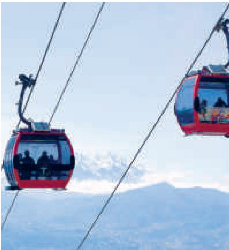
El servicio de Mi Teleférico será normal el domingo.