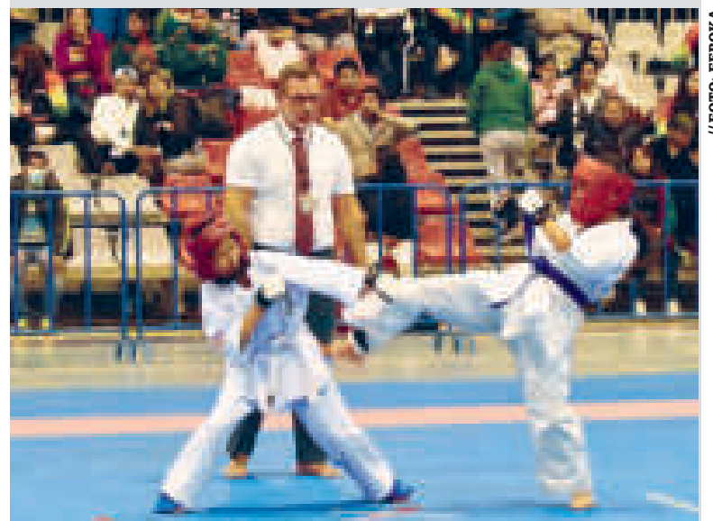
Los karatecas menores de 13 años competirán por el título en Sucre.

"En este campeonato celebramos no solo la competencia, sino también los valores esenciales del karate: el respeto, la perseverancia y la camaradería", apuntó el titular de la Feboka.