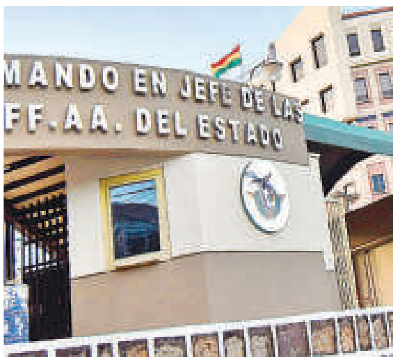
La fachada principal del Comando en Jefe de las FFAA del Estado.