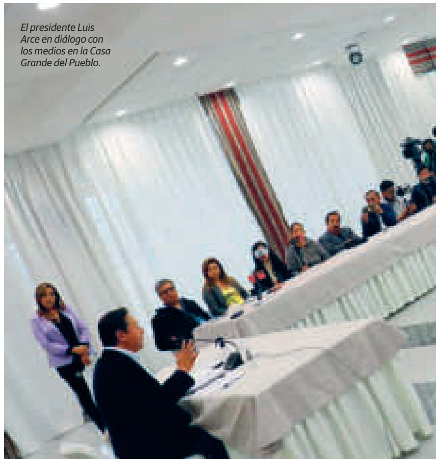
El presidente Luis Arce en diálogo con los medios en la Casa Grande del Pueblo.

El Primer Mandatario explicó que en una reunión de cancilleres la CAN debe responder a la propuesta de Bolivia, y si es positiva, adelantó que habrá cambios en la cancillería.