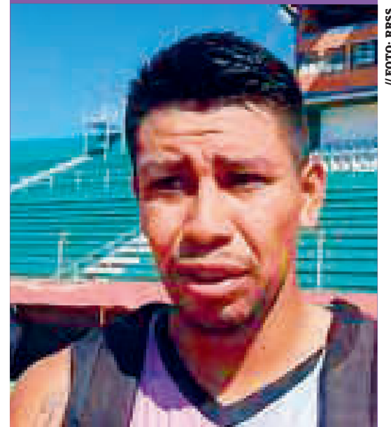
Carrillo dice que no aceptó la propuesta.

La situación del futbolista se agrava, al igual que la de los otros tres jugadores implicados —así lo denunció la dirigencia del club Libertad Gran Mamoré—, por las sanciones que podrían recibir y cortar su carrera deportiva.