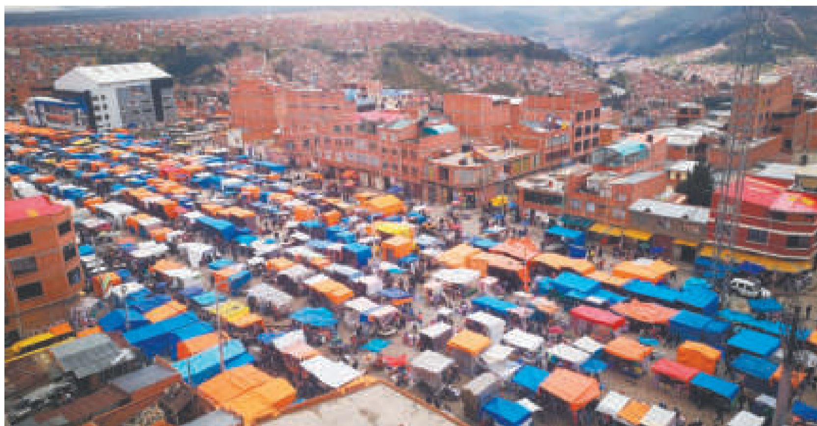
◀ La feria 16 de Julio, en El Alto

El Presupuesto General del Estado (PGE) 2023 asigna un total de Bs 7.410 millones para los cinco bonos sociales: Renta Dignidad, Juana Azurduy, Juancito Pinto, Subsidio Universal Prenatal por la Vida y el bono mensual para personas con discapacidad.