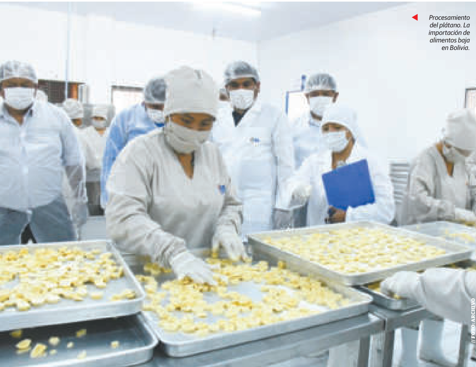
◀ Procesamiento del plátano. La importación de alimentos baja en Bolivia.