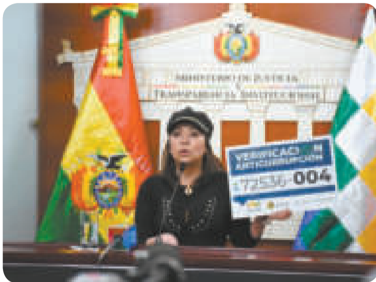
La Viceministra de Transparencia presentó la línea de verificación anticorrupción para que la población haga sus denuncias.

“Somos también conscientes de que aún tenemos muchos males que superar y muchos enemigos que vencer, entre ellos la corrupción, la peor de las herencias coloniales”, dijo la autoridad durante su mensaje presidencial al país por los 198 años de independencia de Bolivia.