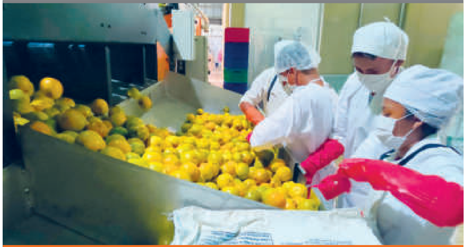
● Los productores se benefician con capacitación y tecnología.