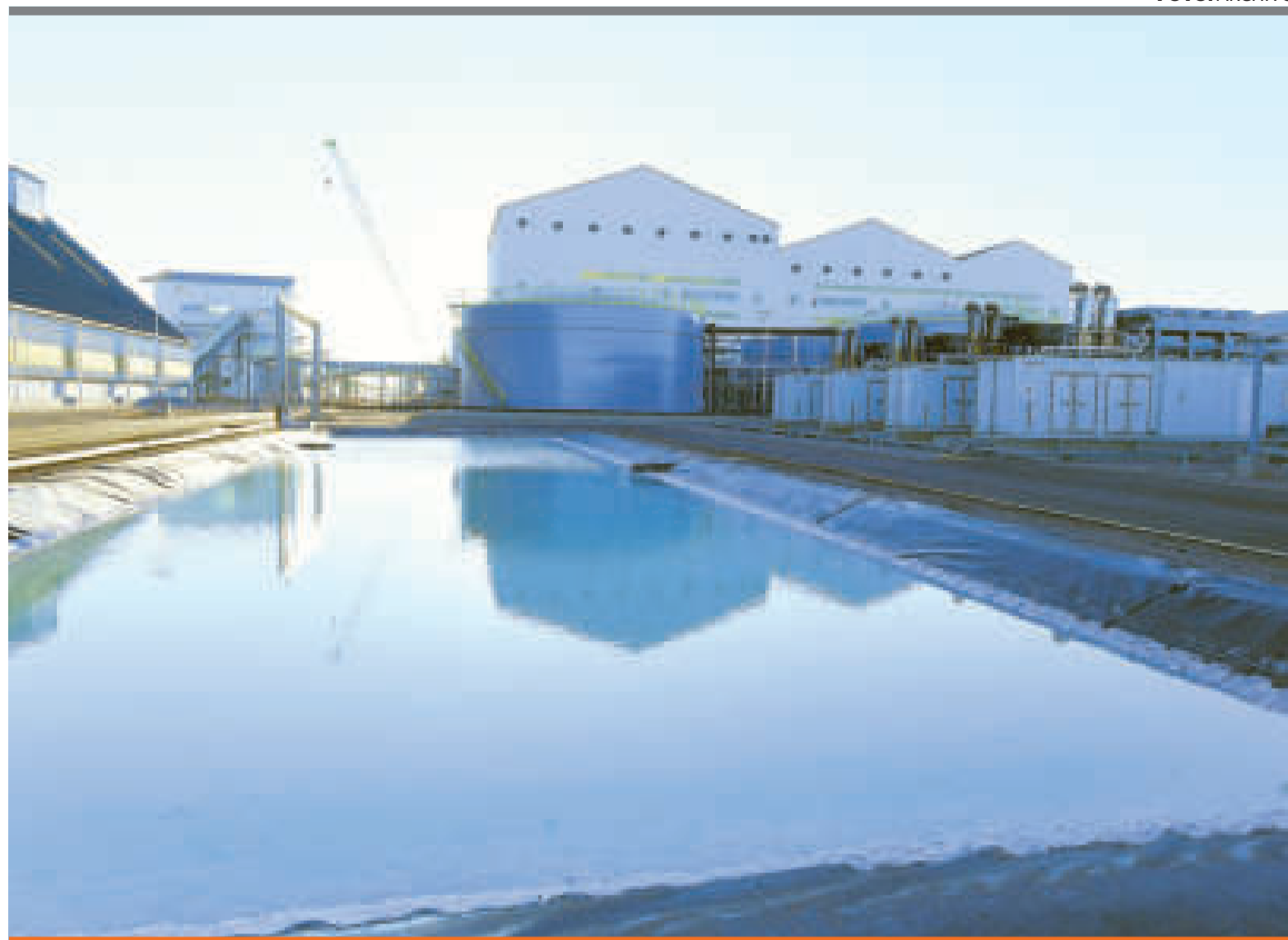
● El complejo industrial de carbonato de litio, en Llipi.