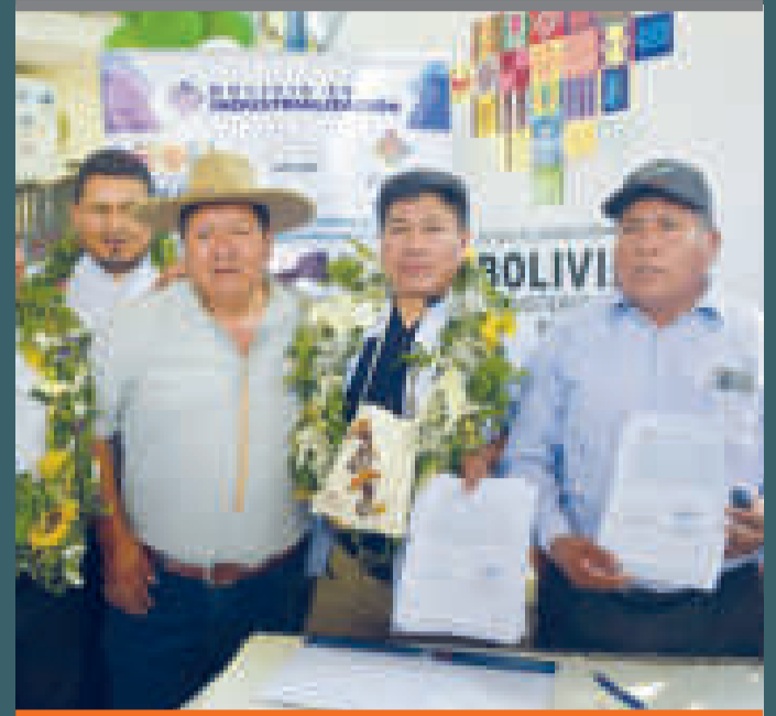
Autoridades firman el convenio con los productores.