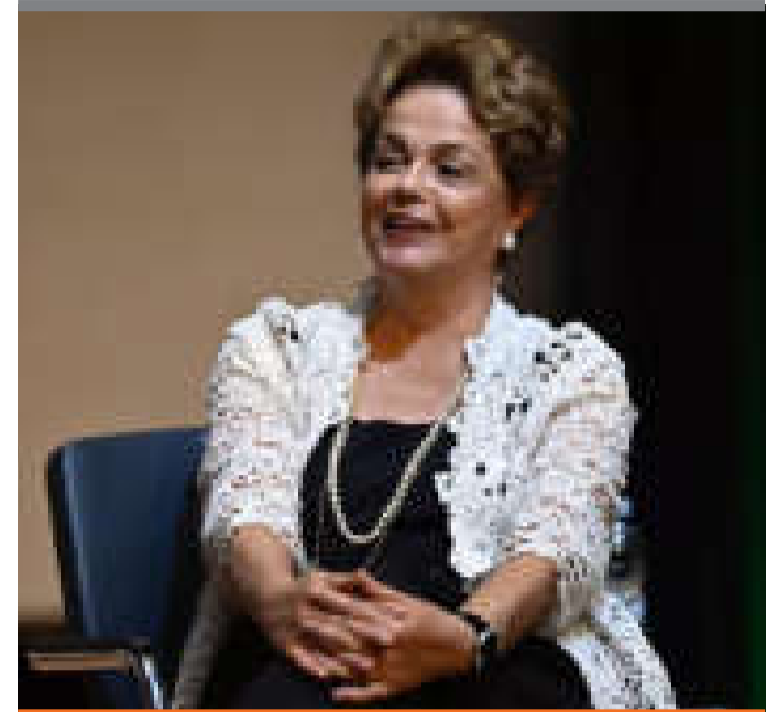
● Dilma Rousseff , presidenta del Banco de Desarrollo.

Irán, Argentina y Argelia han solicitado formalmente su ingreso en el bloque, y unos 20 países más han anunciado sus planes de adhesión, entre ellos Bolivia, Emiratos Árabes Unidos, Indonesia, Turquía, Túnez y Venezuela.