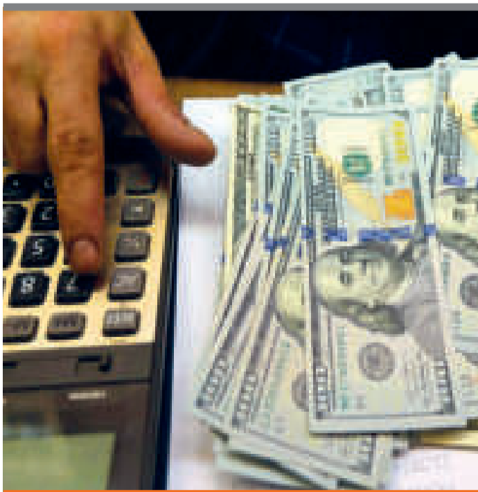
● La última cuota fue de $us 189 millones.