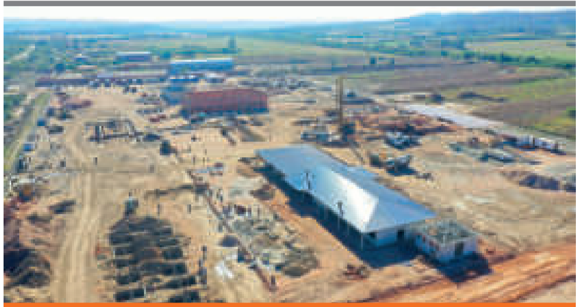
● Edificación de una de las 24 plantas.