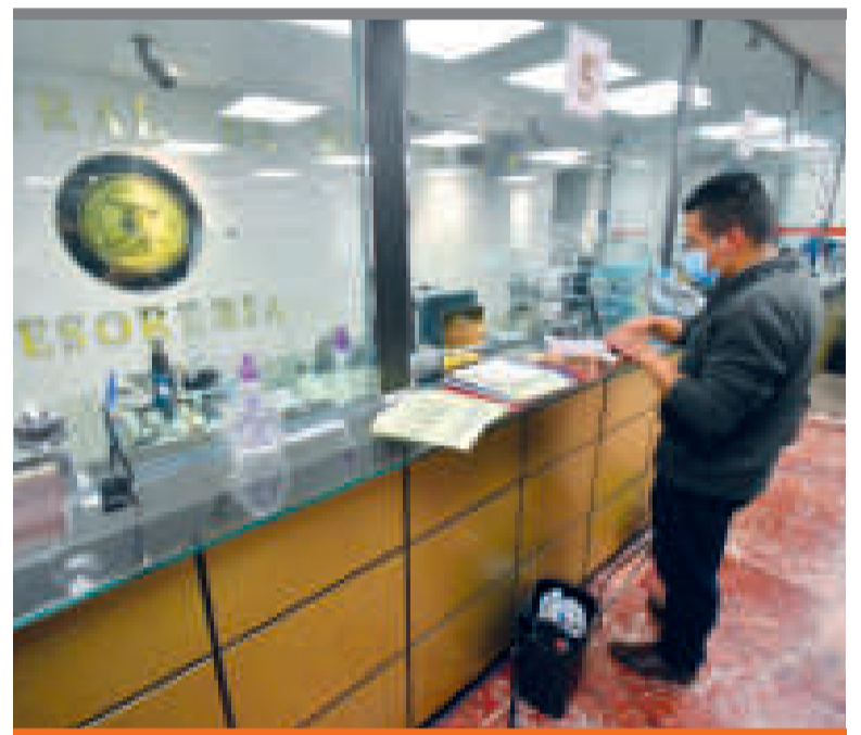
● La cantidad de depósitos bancarios se incrementó también.