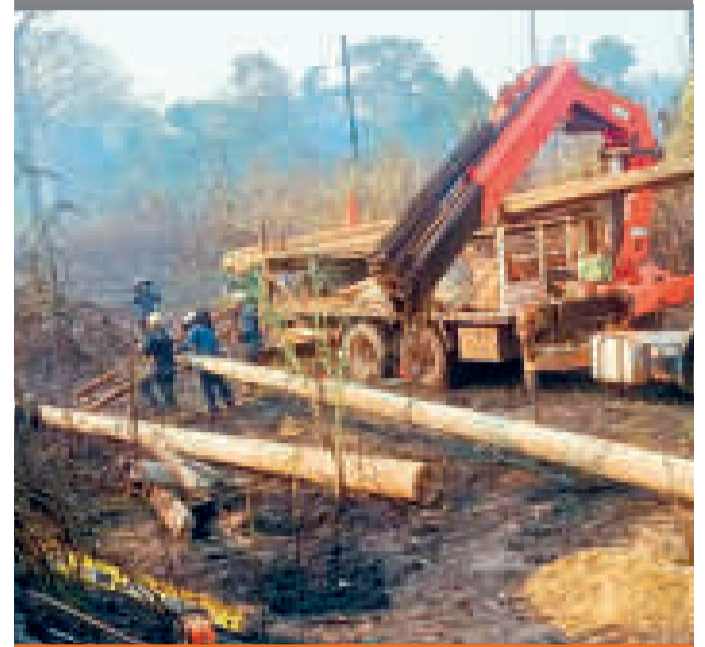
● La zona donde se registraron chequeos en Puerto Rico, Pando.