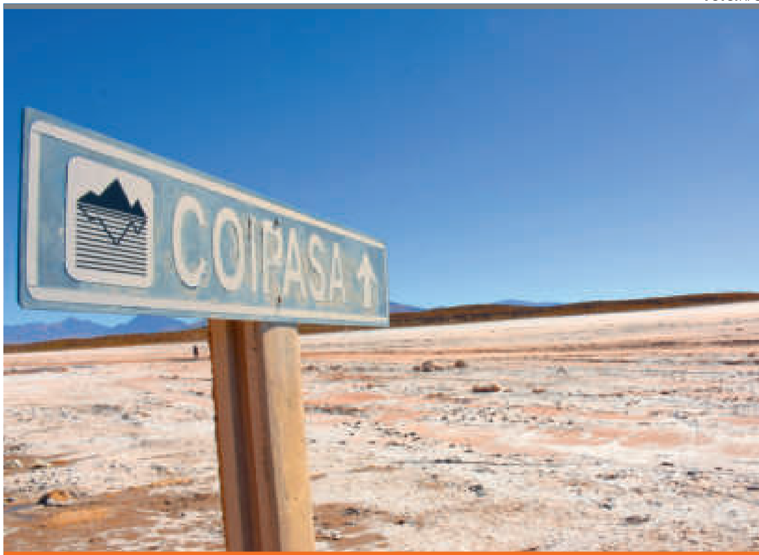
● El salar de Coipasa está ubicado en el departamento de Oruro.

“La primera empresa de litio que va a invertir aquí, en