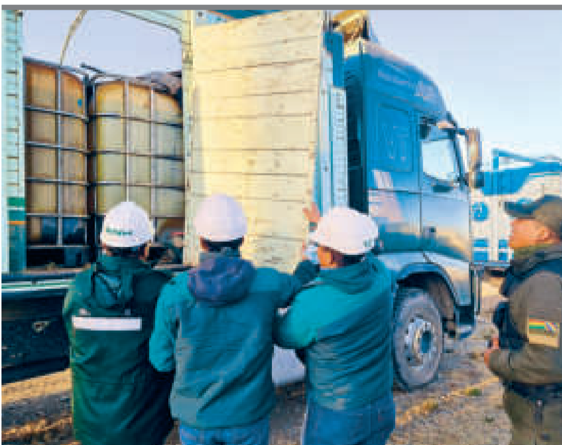
● Parte del combustible incautado en La Paz.

MIL LITROS DE DIÉSEL FUERON INCAUTADOS EN LA PAZ EN DOS OPERATIVOS DE LA SEMANA PASADA CON APOYO DE LAS FFAA.