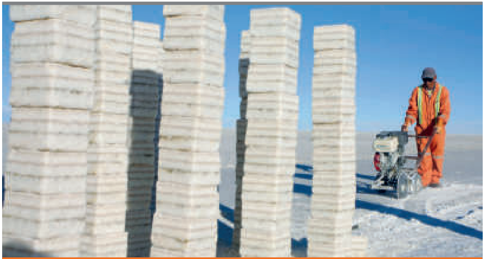
● El salar de Uyuni, en Potosí, tiene la mayor cantidad de litio certificada del país, 21 millones de toneladas.

“Hay países donde se han dado (el plazo) de que hasta 2030 tiene que haber un cambio en la matriz hacia vehículos híbridos o eléctricos”.