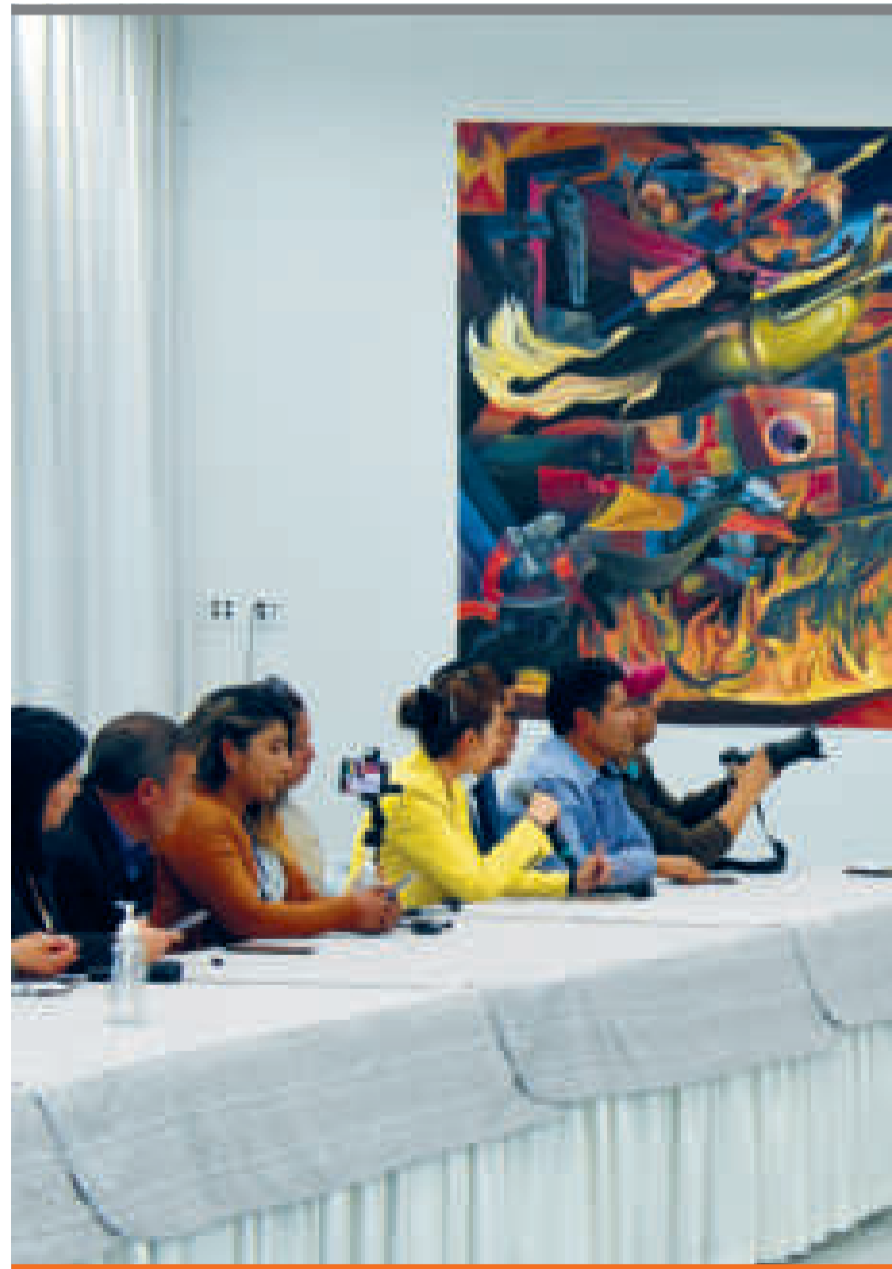
El Primer Mandatario recibió a los periodistas para explicar los alcances de la adhesión.