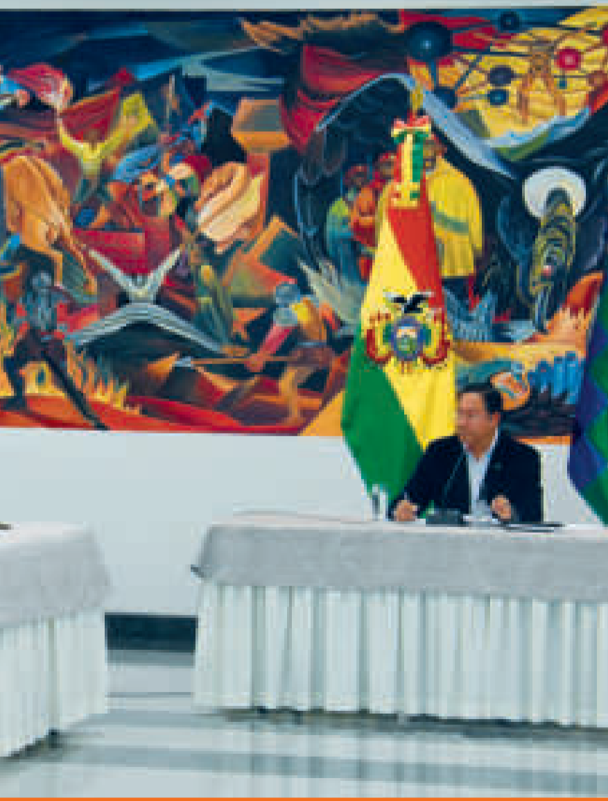
ión de Bolivia a los Brics.