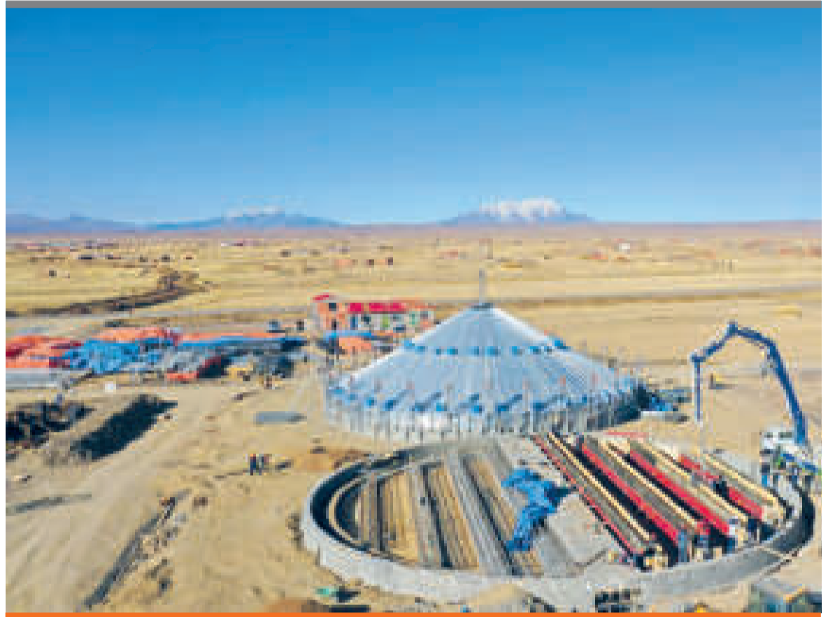
Una buena parte de las plantas de industrialización están en ejecución o en diseño final.