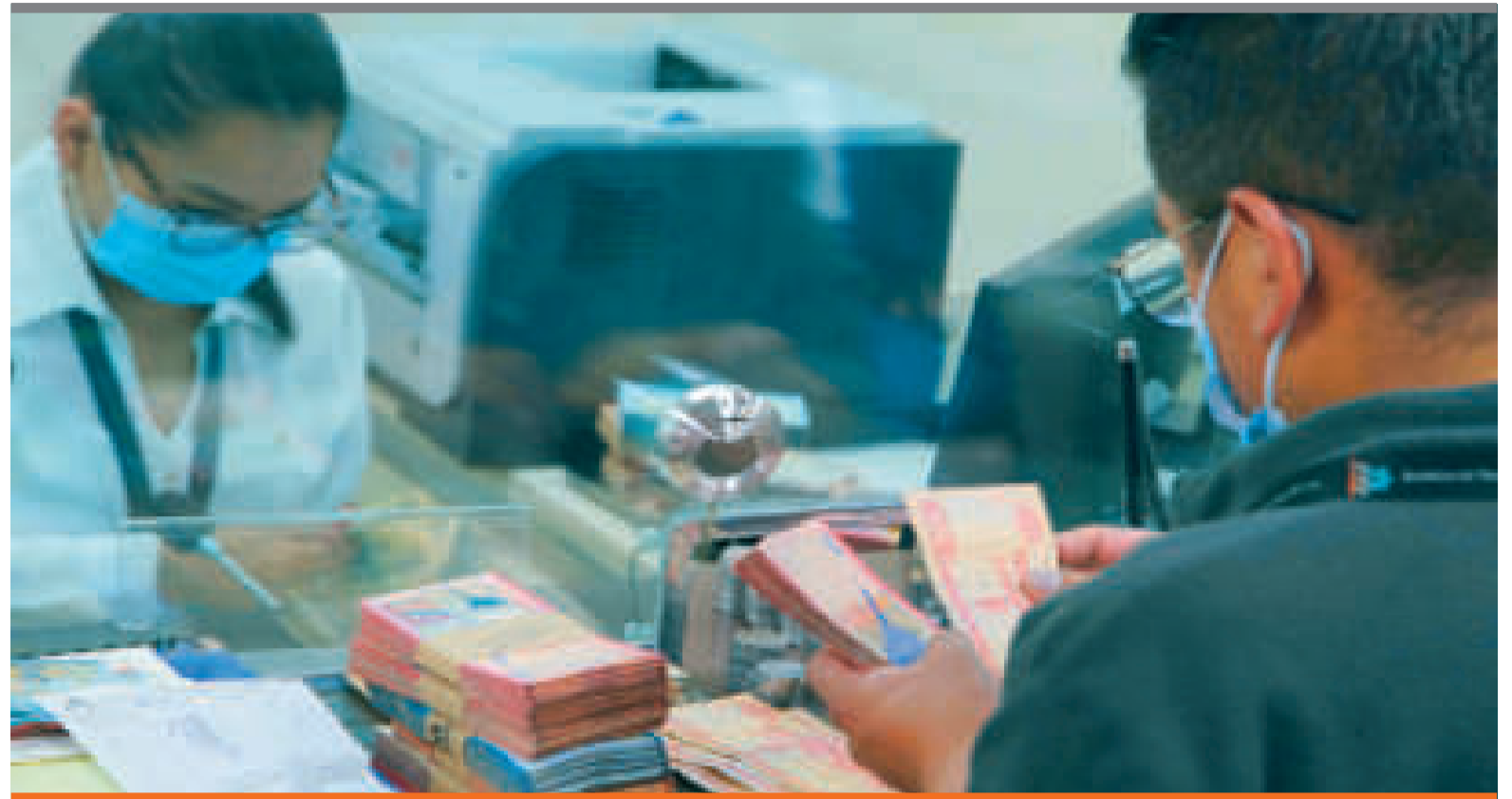
● Gran porcentaje de los depósitos bancarios se efectúan en moneda nacional.