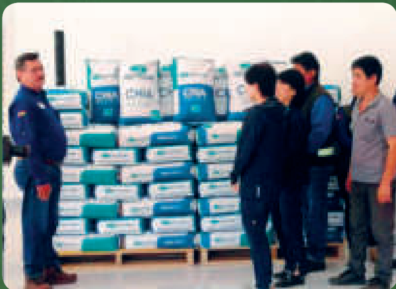
Una comisión de China verifica la chía nacional de exportación.