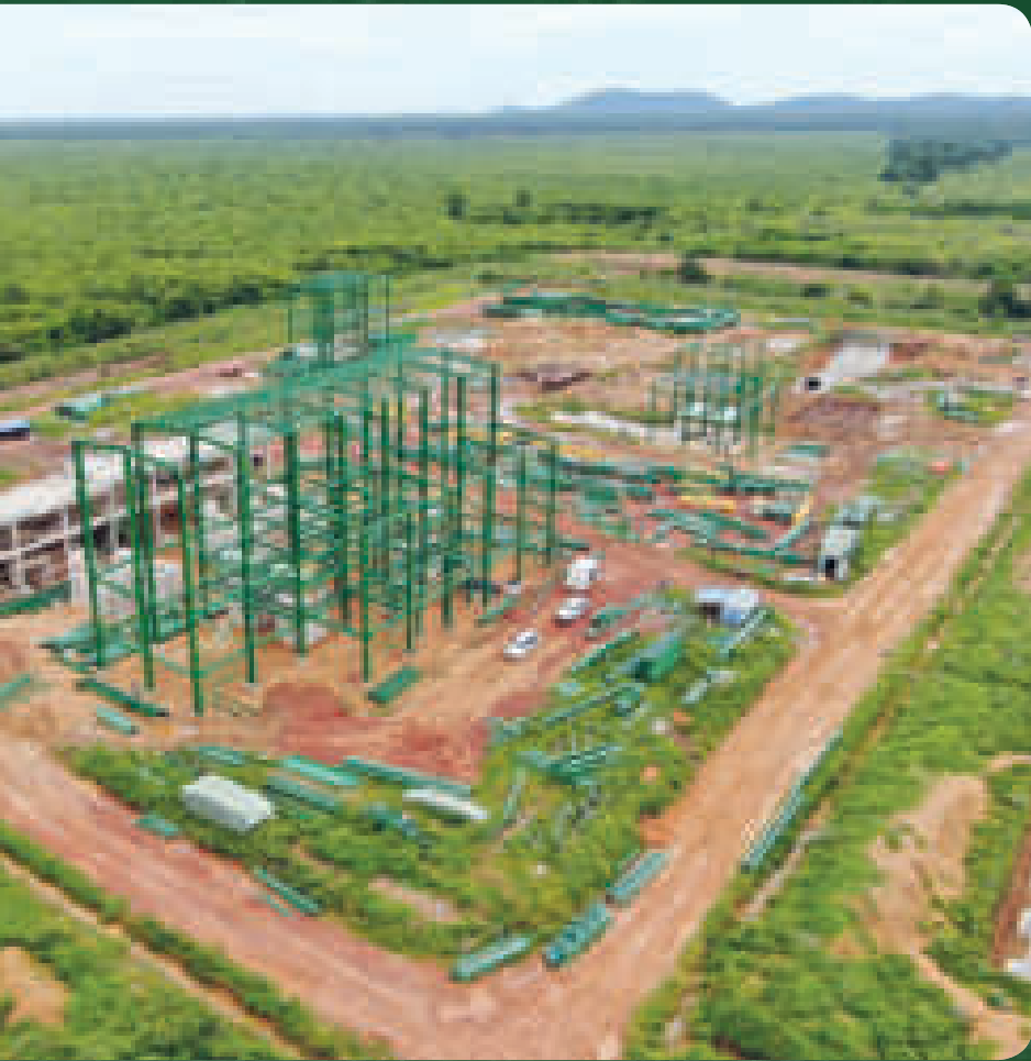
◀ El complejo del Mutún, que está en construcción, se encuentra en el municipio de Puerto Suárez.