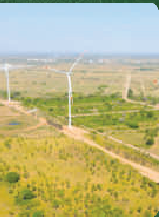
◀ Uno de los parques eólicos instalados en el departamento cruceño.