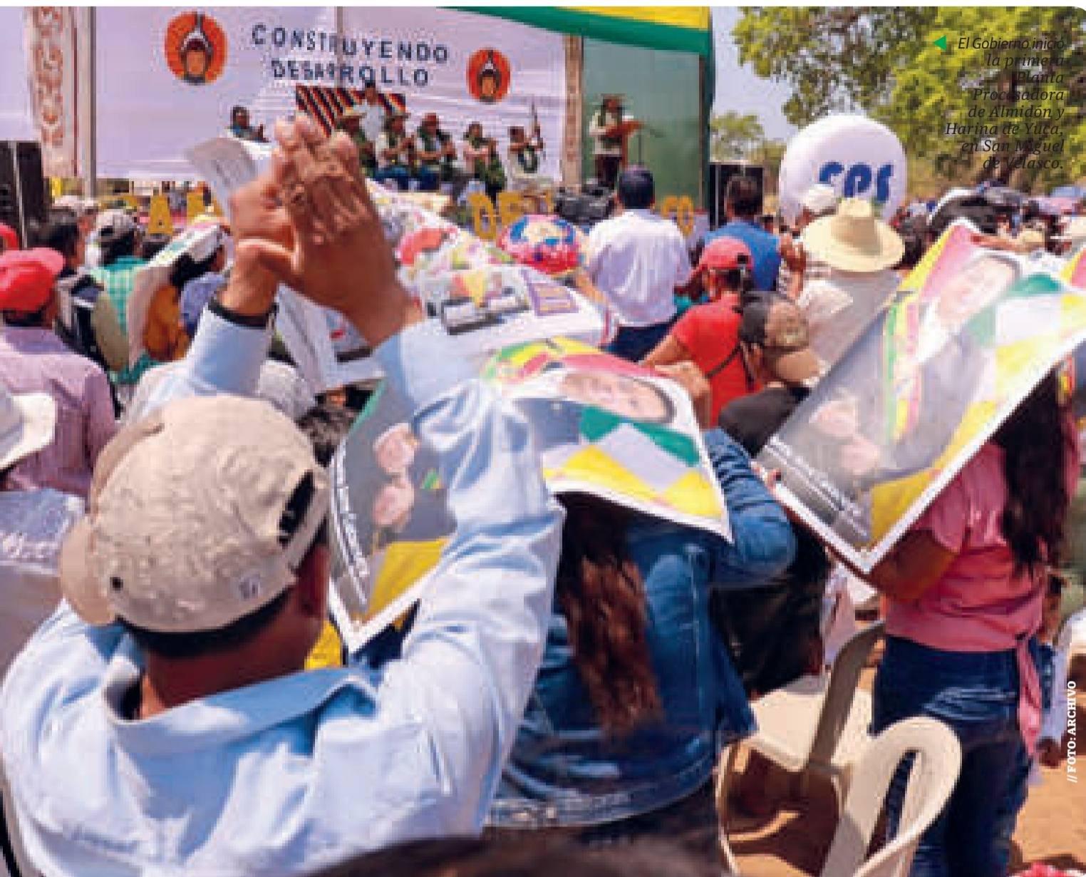
El Gobierno inició la primera Planta Procesadora de Almidón y Harina de Yuca, en San Miguel de Velasco.