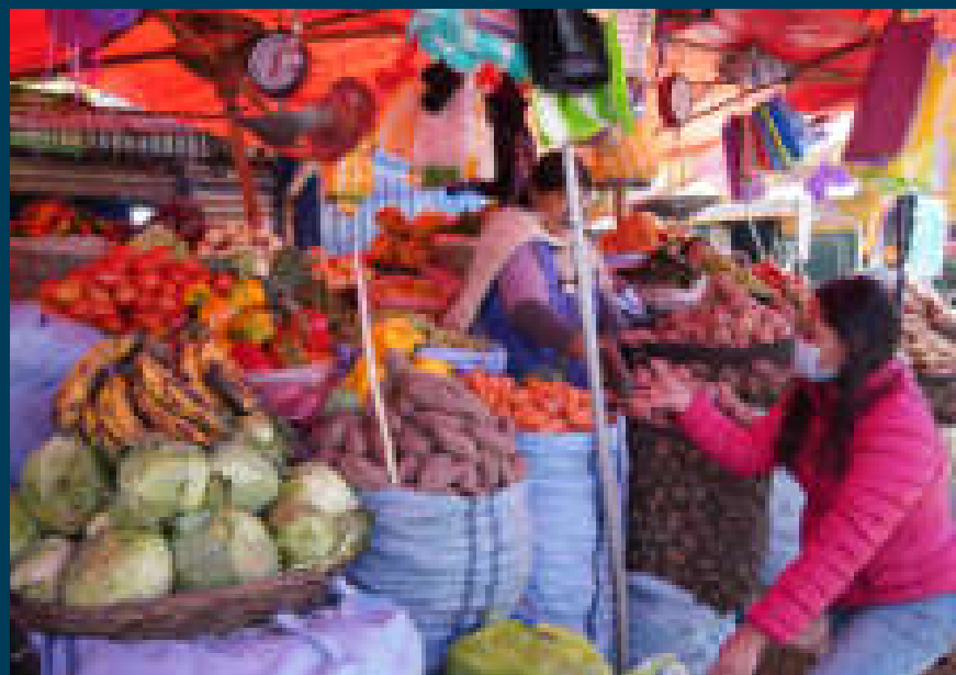
Los precios de la canasta familiar se mantienen estables en el país.

▶ estamos manteniendo la estabilidad de precios, que es muy importante, porque un economista sabe que cuando hay inflación en un país, los más afectados siempre son los más pobres, y lo que estamos haciendo nosotros como Gobierno es precautelar el poder adquisitivo de los más pobres, y eso es una política social”, añadió Arce.