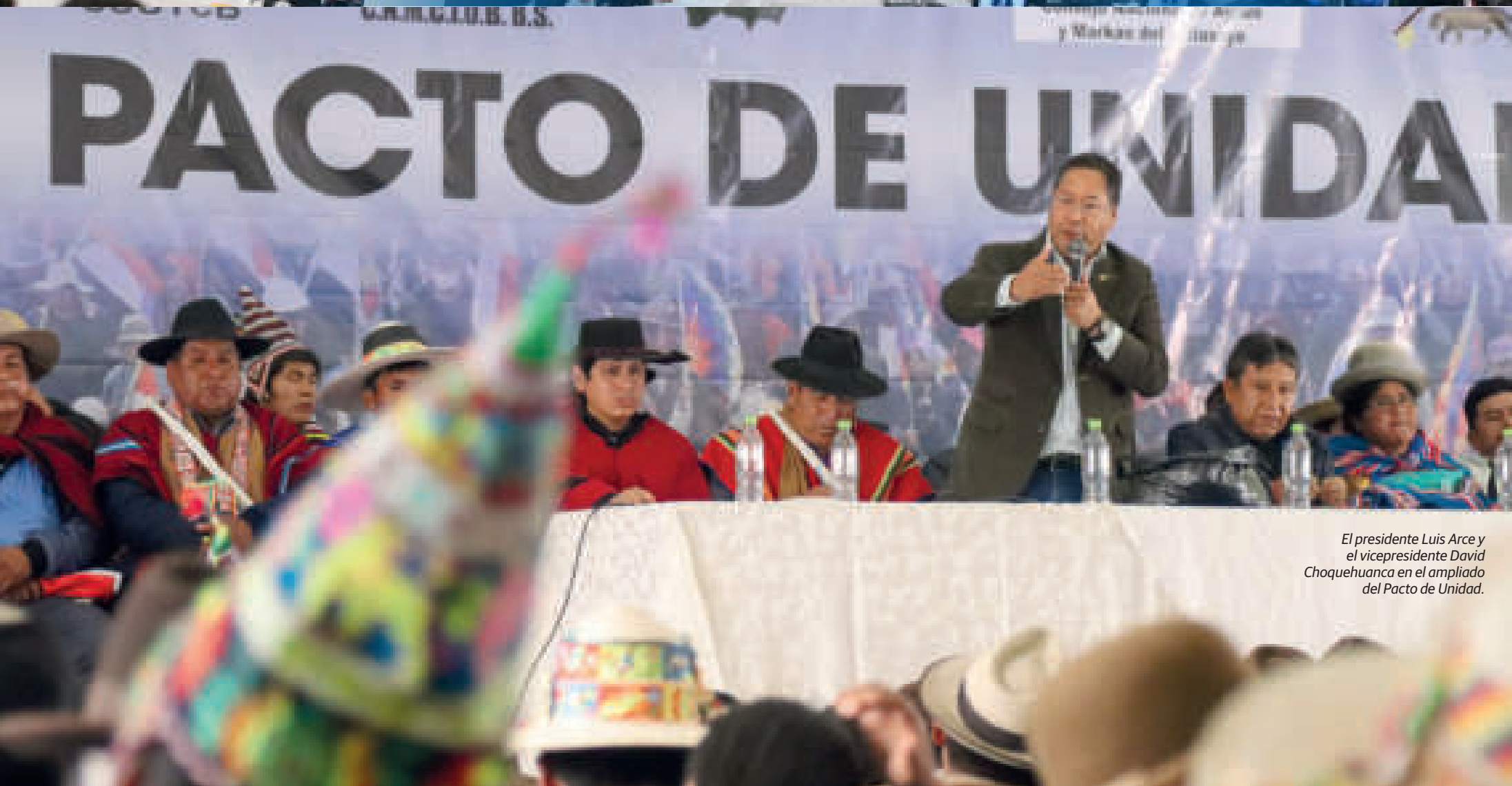
El presidente Luis Arce y el vicepresidente David Choquehuanca en el ampliado del Pacto de Unidad.