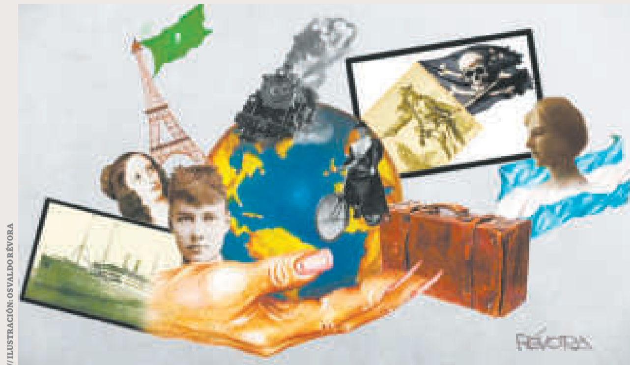
// ILUSTRACIÓN: OSVALDO RÉVORA