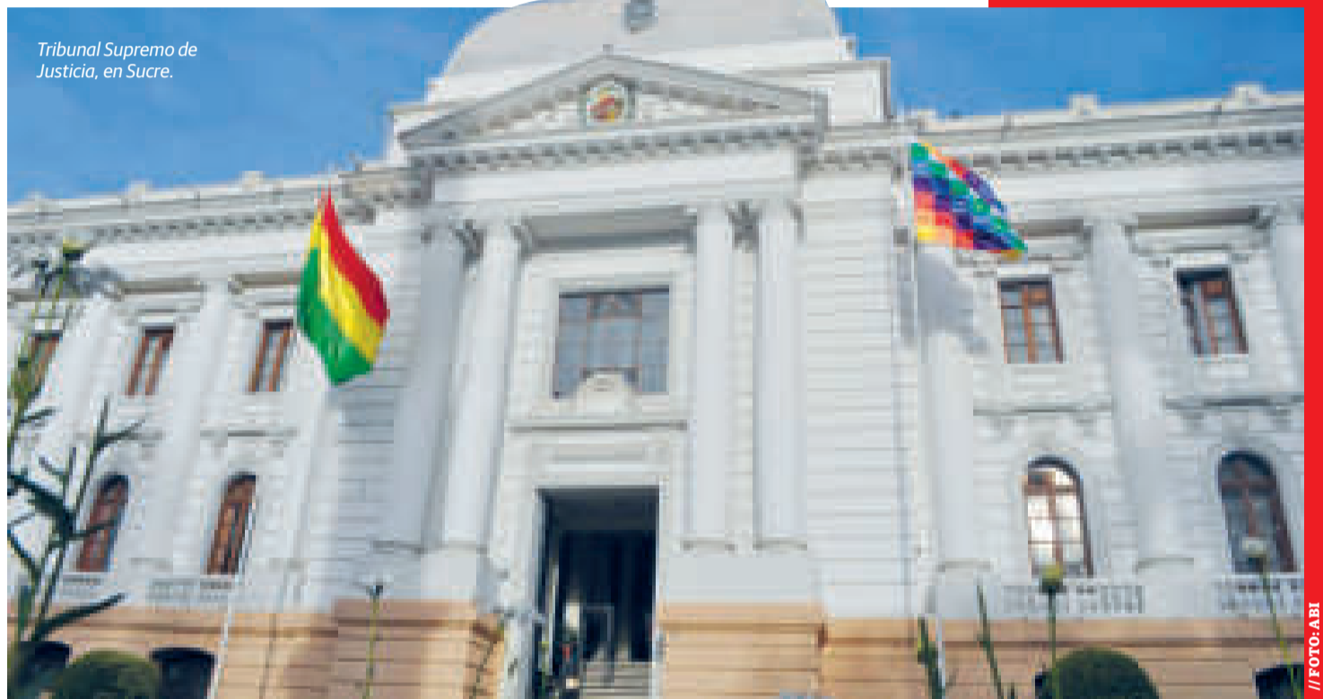
Tribunal Supremo de Justicia, en Sucre.

El Gobierno nacional ha declarado una lucha frontal contra todas las formas de violencia, especialmente hacia niños,