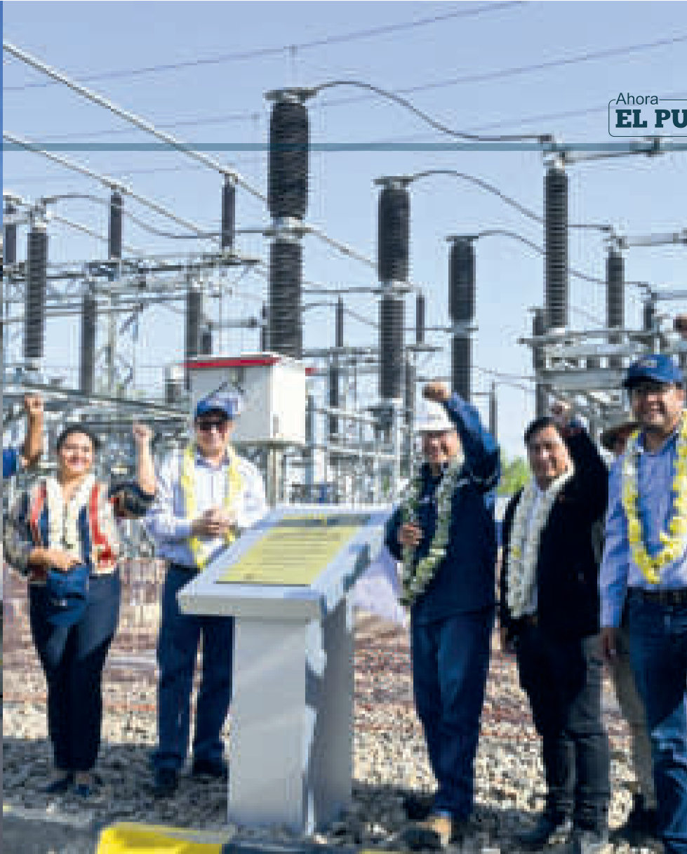
▲ Plantas que generan empleo y desarrollo.