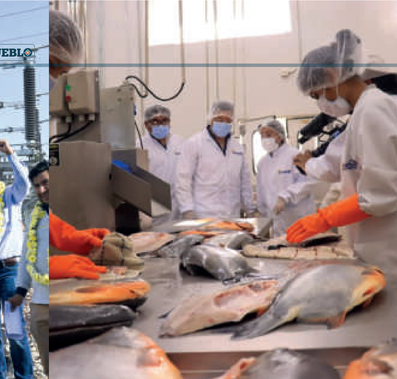
▲ Industrialización del pescado.