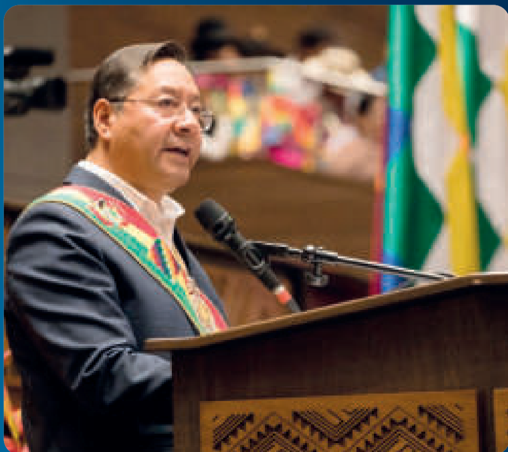
El presidente Luis Arce durante su informe de tercer año de gestión.