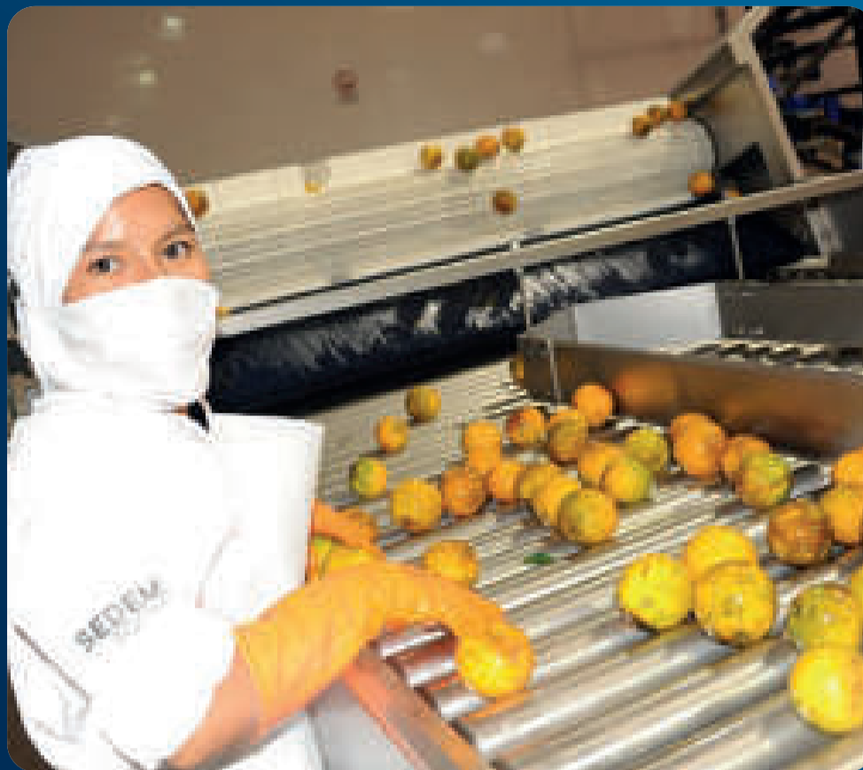
Planta procesadora de cítricos para sustituir las importaciones.

che, plátano, yuca, piña, hortalizas, pescado, camélidos y otros productos propios de cada departamento del país.