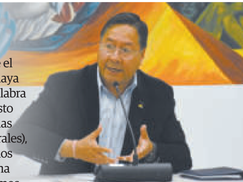
Luis Arce Presidente de Bolivia

Lamentamos que el compañero Evo haya incumplido su palabra de no hablar de esto (candidatos para las elecciones electorales), porque lo habíamos decidido así en una reunión que tuvimos en Sacaba”.