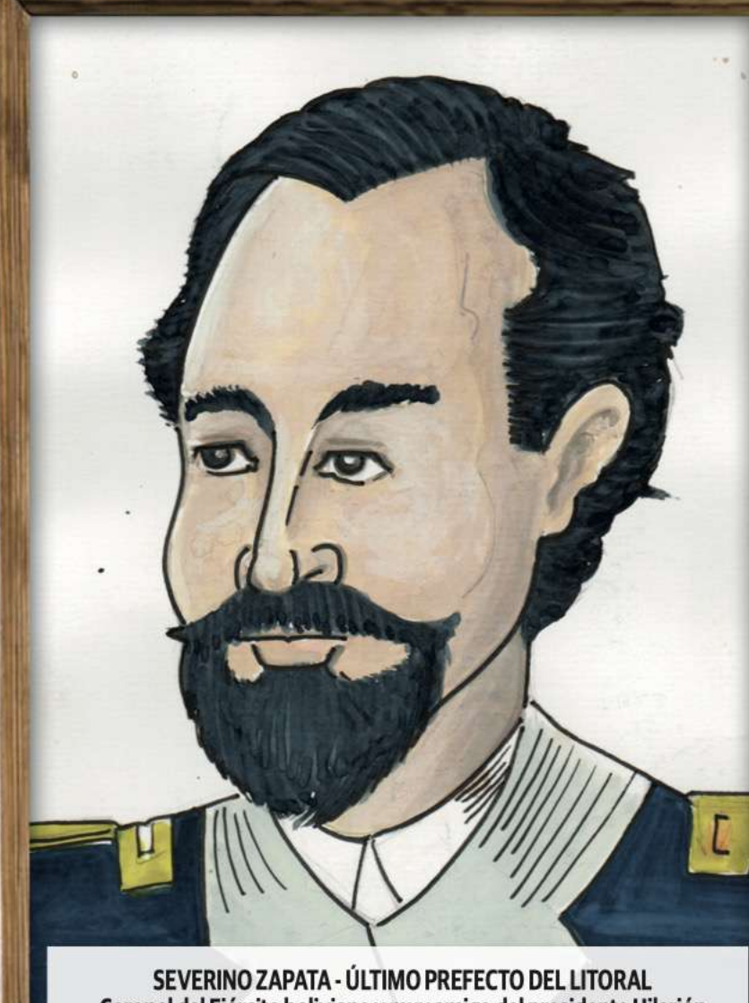
SEVERINO ZAPATA - ÚLTIMO PREFECTO DEL LITORAL Coronel del Ejército boliviano y muy amigo del presidente Hilarión Daza, se encontraba en Antofagasta el día 14 de febrero de 1879 para proceder al remate de bienes de la empresa salitrera chilena, que se negó a pagar tributos. Zapata participó en la defensa de Calama con Avaroa, Cabrera y otros 130 combatientes.