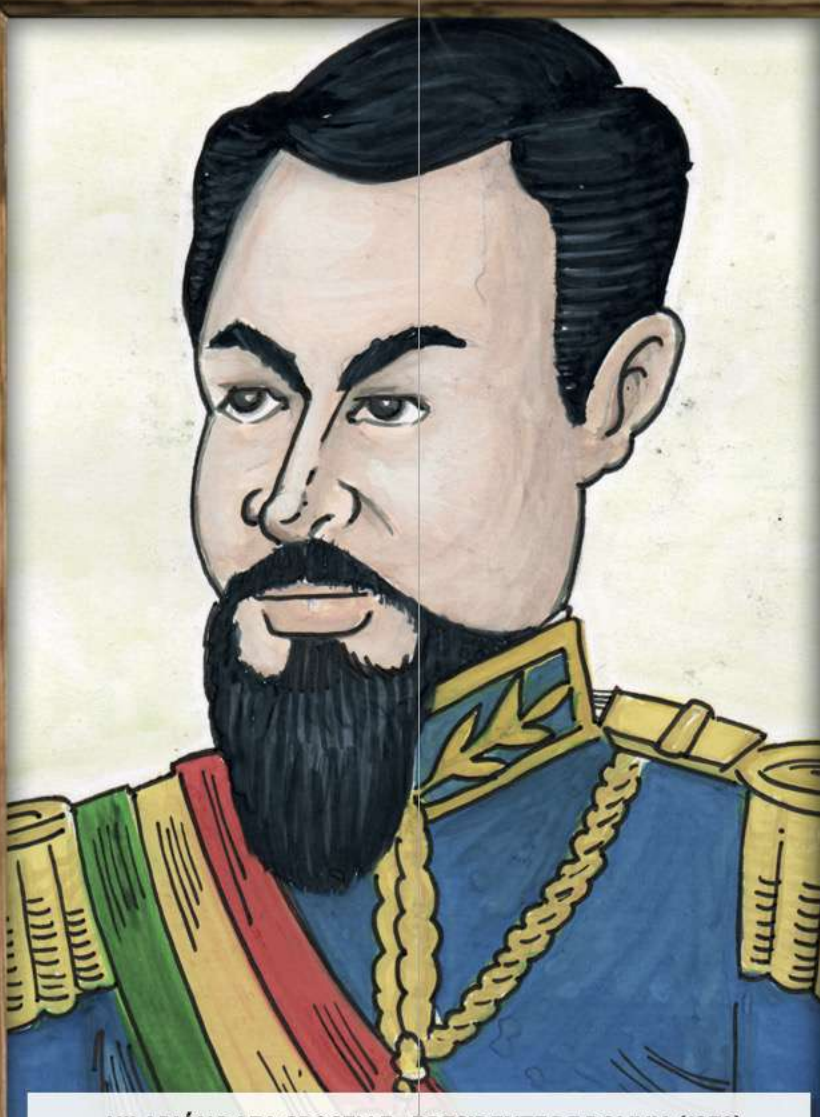
HILARIÓN DAZA GROSELLE - PRESIDENTE DE BOLIVIA (1879) Conocido como 'el soldado mandón'. Fue un militar y político boliviano. Último de los llamados 'caudillos bárbaros', presidente de la República entre 1876 y 1879. La población boliviana lo recuerda como el presidente que perdió el mar.