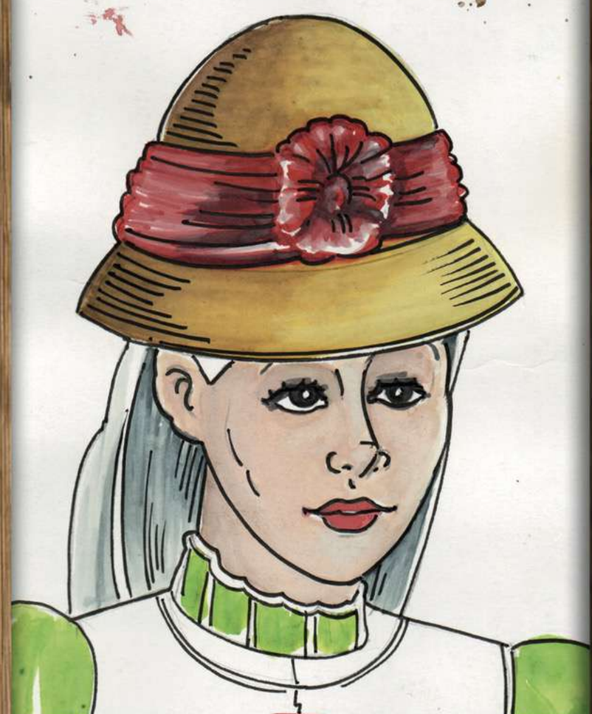
IGNACIA ZEBALLOS TABORGA - ENFERMERA DE GUERRA Luego de servir diez meses en el ejército regular, se trasladó al Servicio de Ambulancias del Ejército, precursor de la Cruz Roja Boliviana. Obtuvo la distinción como la 'Madre del Soldado Boliviano' en la Guerra del Pacífico por su cuidado de los heridos y fue honrada como la Benemérita Heroína de la Patria.