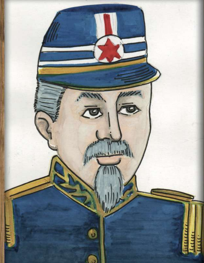
EMILIO SOTOMAYOR BAEZA - COMANDANTE CHILENO Fue un político y militar que participó en forma destacada en la Guerra del Pacífico contra Bolivia y Perú. En 1879, con el grado de coronel, dirigió la ocupación militar chilena de Antofagasta.