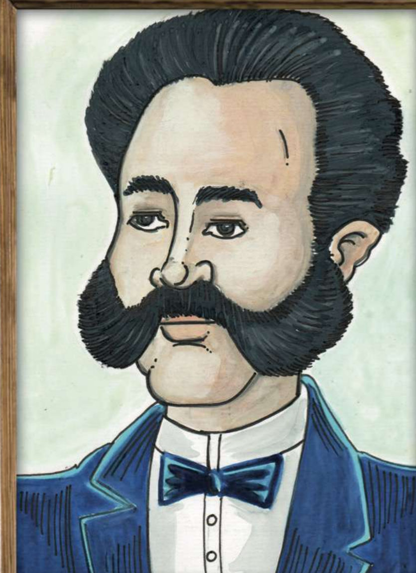
LADISLAO CABRERA - PERIODISTA, ABOGADO, PROFESOR Y POLÍTICO Nació en Cochabamba en 1830. Llegó a sus 49 años a Calama donde fue forense cuando se produjo la ocupación chilena. Organizó también y comandó la defensa de Calama.