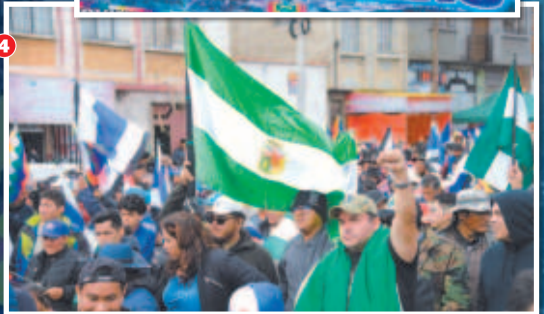
1. Una colosal concentración de personas en el congreso del MAS en la ciudad de El Alto.