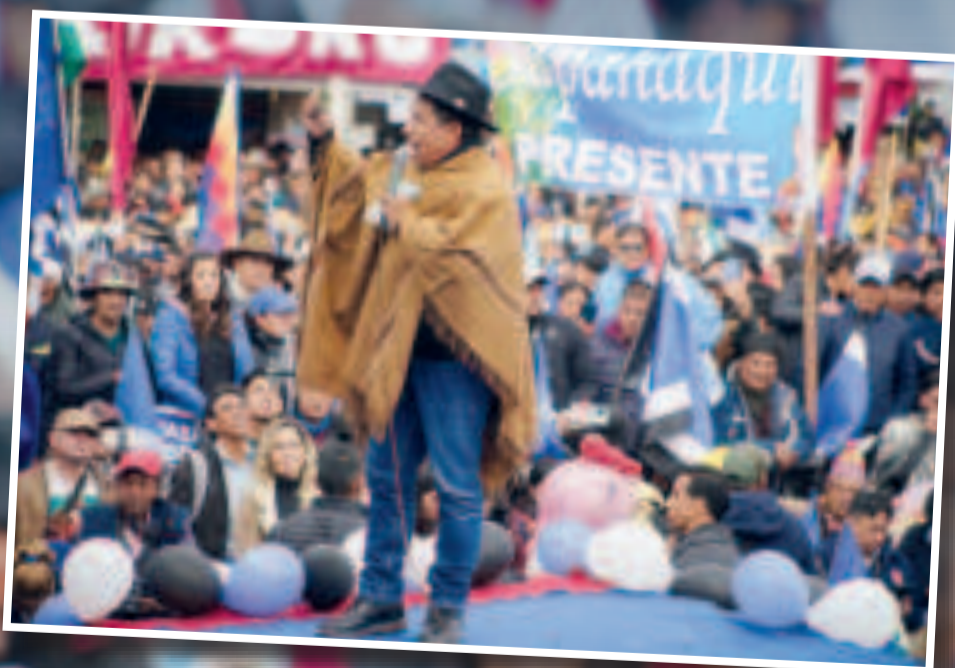
El vicepresidente David Choquehuanca en el X Congreso del MAS-IPSP.

"Necesitamos líderes apegados a la verdad, líderes honestos que produzcan respeto y sientan el dolor del otro. Necesitamos líderes que respeten las decisiones de las bases, que amen a su pueblo y no a la silla", manifestó.