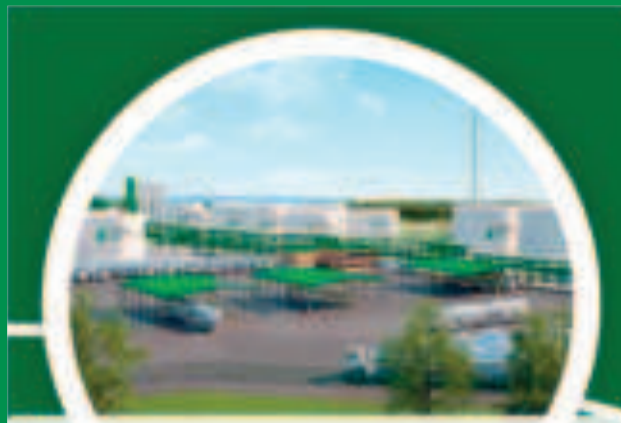
PLANTA DE HVO