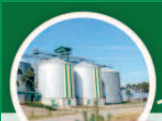
PLANTA DE BIODIESEL I