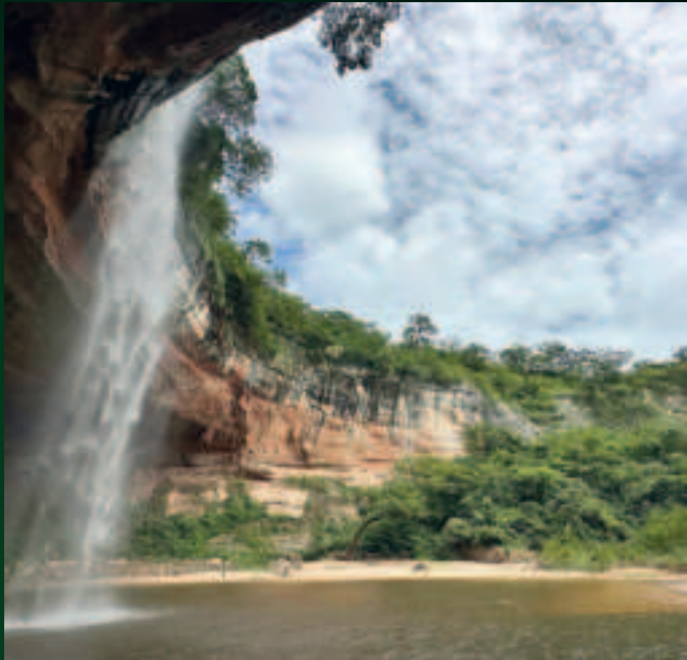
◀ Cataratas el Jardín de las Delicias, del Parque Nacional Amboró, en Santa Cruz.

► es un monumento que cuenta la historia de civilizaciones pasadas y de la rica herencia cultural de Bolivia. Al visitarlo no solo se observa una magnífica obra arquitectónica, sino que se siente el peso de siglos de historia y cultura.