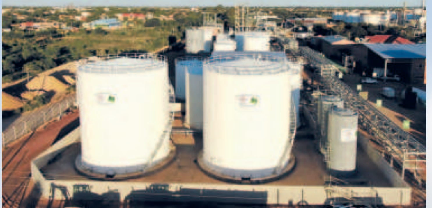
La Planta de Biodiésel 1 se encuentra en predios de la refinería Guillermo Elder Bell, en la ciudad de Santa Cruz.

El complejo siderúrgico del Mutún, ubicado en el municipio de Puerto Suárez en la provincia Germán Busch, representa una de las mayores oportunidades