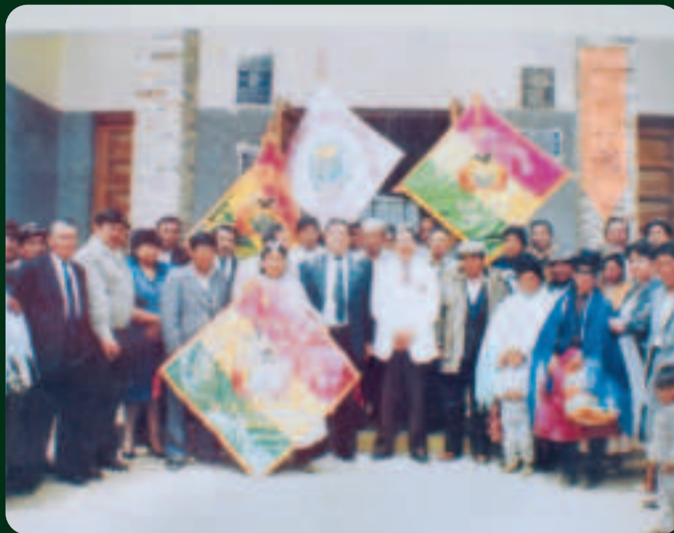
Historicos dirigentes de Furia, frente de vecinos que consolidó la autonomía municipal de El Alto.

► manifestaciones que culminaron en enfrentamientos en la plaza Murillo.