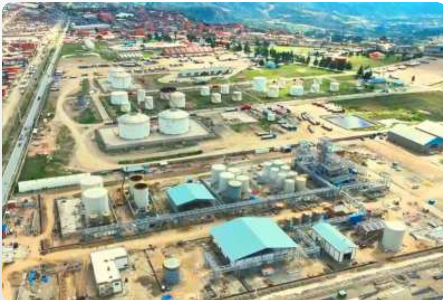
Área de emplazamiento de la planta en El Alto.

El Alto será un referente para otros proyectos en el país, demostrando que Bolivia está comprometida con el desarrollo de tecnologías limpias y con la generación de un futuro más sostenible.