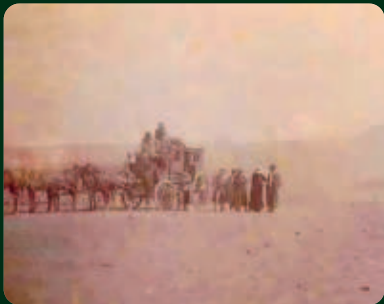
El Alto en 1890 con el nevado de Huayna Potosí de fondo.