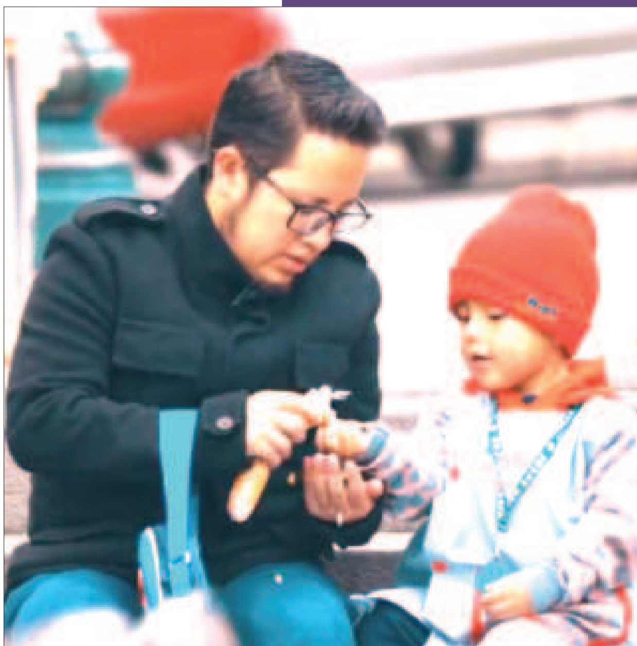
Padre de familia, con su hijo, alimenta a las aves.