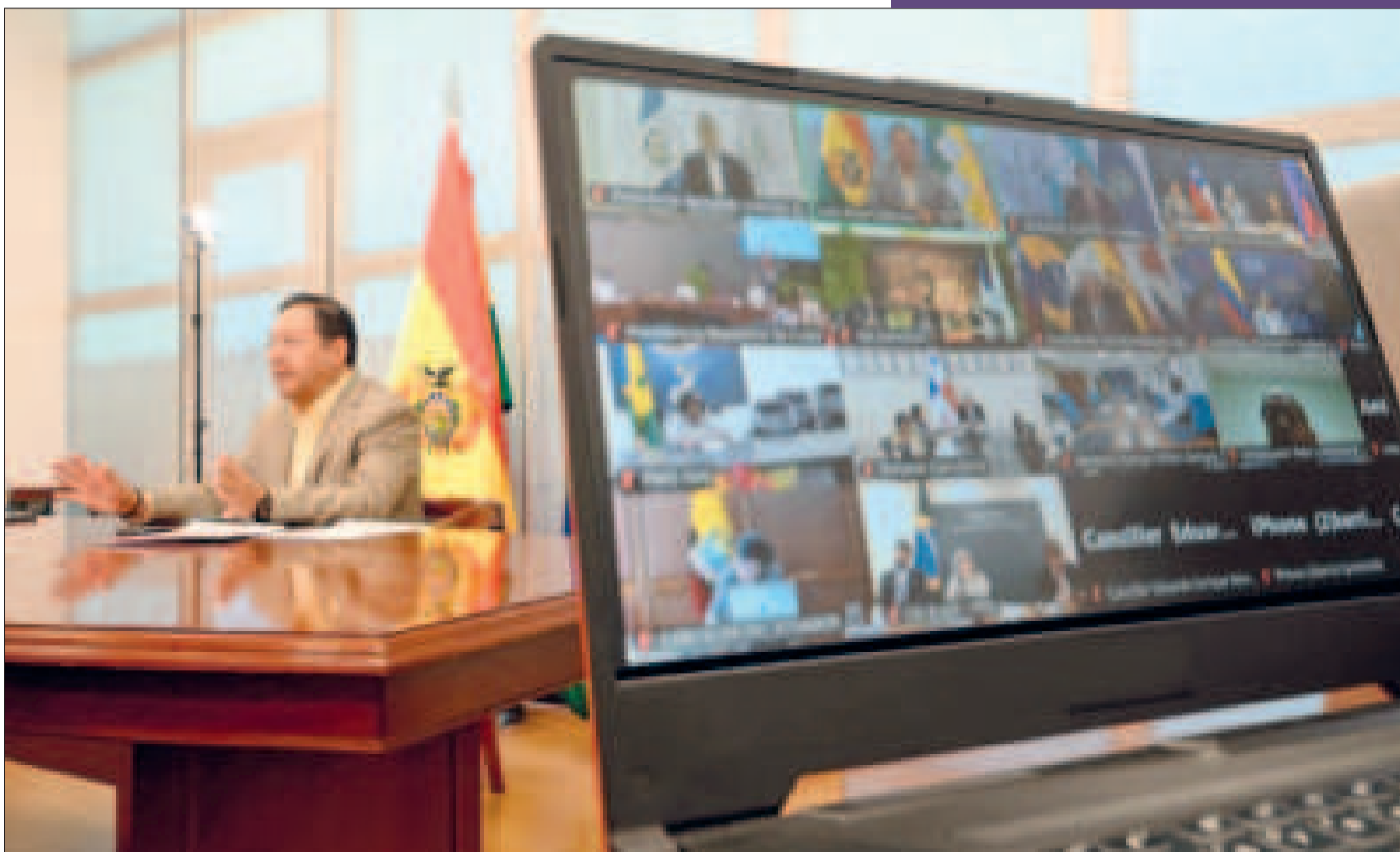
El presidente Luis Arce en su intervención virtual de la Celac