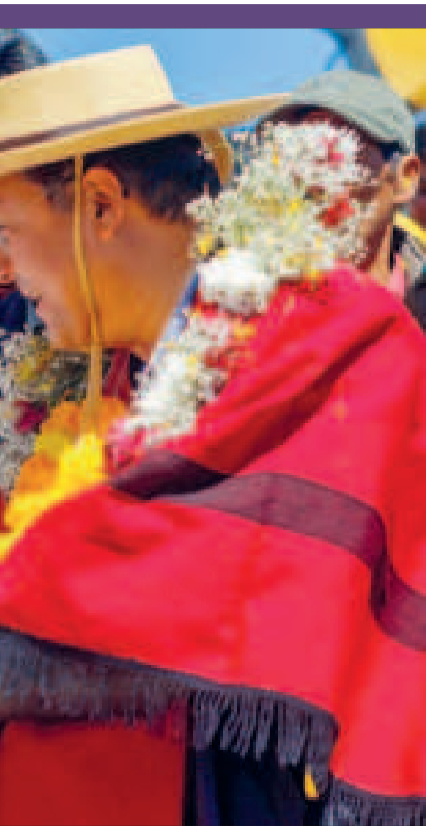
El presidente Arce en una entrega de obras en Tarija.