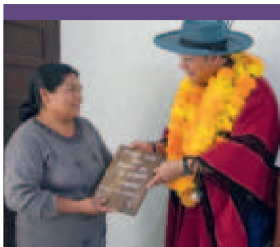
El presidente Luis Arce entrega una vivienda digna a una mujer en Tarija.