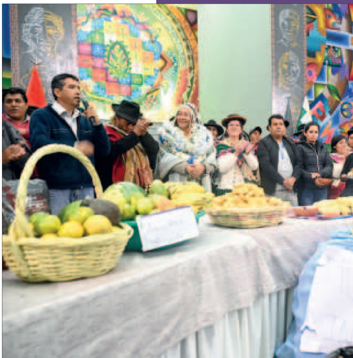
El Jefe de Estado junto a agricultores de las provincias Inquisivi de La Paz y Ayopaya de Cochabamba.