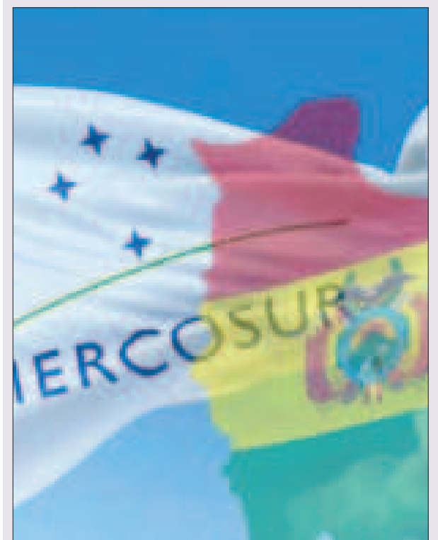
La bandera del Mercosur y el mapa de Bolivia.