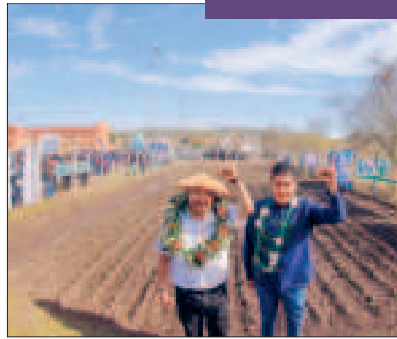
Construcción del sistema de riego de Alta Loma en el Gran Chaco.