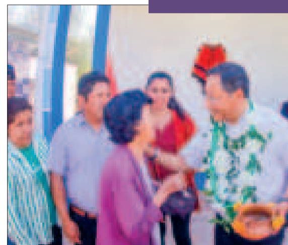
Una mujer recibe las llaves de su propia vivienda.