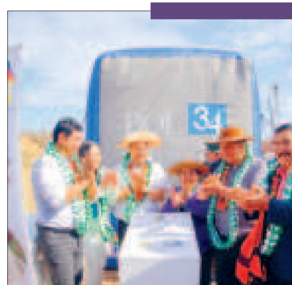
Enlosetado de calles del barrio La Vertiente en el municipio de Caraparí.