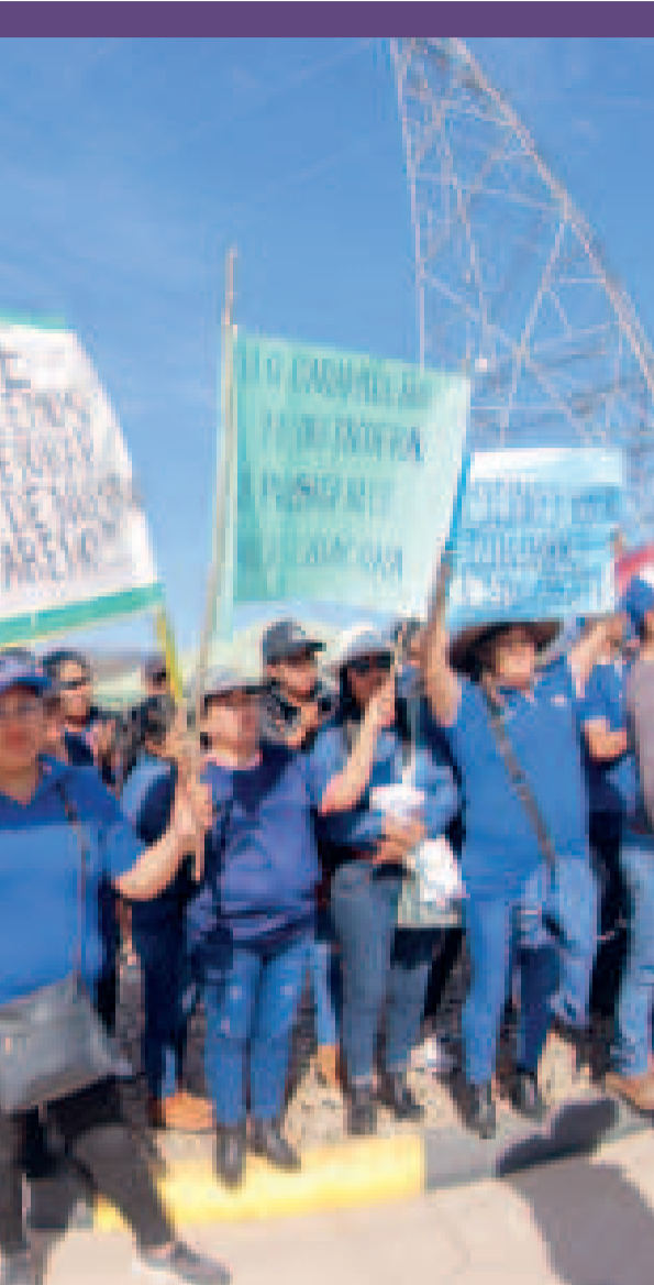
Pobladores del Gran Chaco agradecen las obras al presidente Luis Arce.