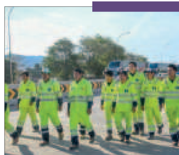
Un grupo de trabajadores en la doble vía Yacuiba del Campo Pajoso Fase I.

El Gobierno invierte más de Bs 311 millones en la construcción de plantas industriales de transformación de granos, aceite vegetal, aditivos, producción piscícola, así como los agroinsumos que ahora están en ejecución.