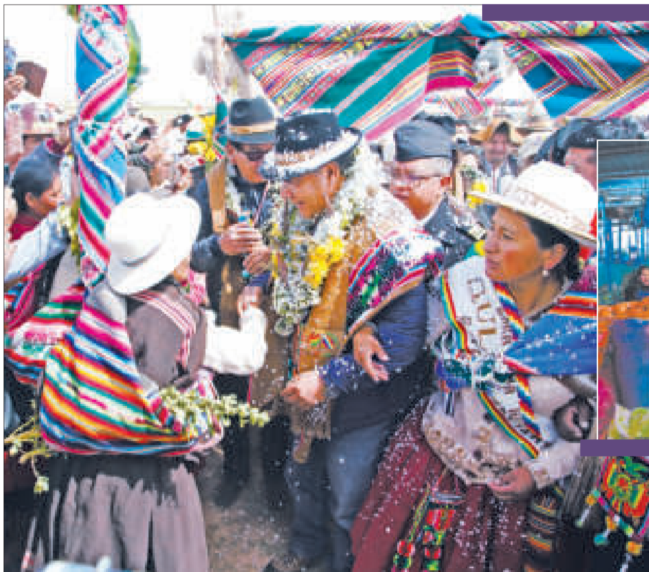
Las políticas del presidente Arce se enfocan en beneficiar a la gente.