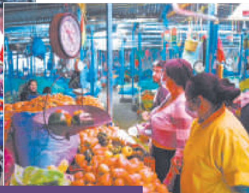
La estabilidad de precios se siente en las mesas de las familias bolivianas.