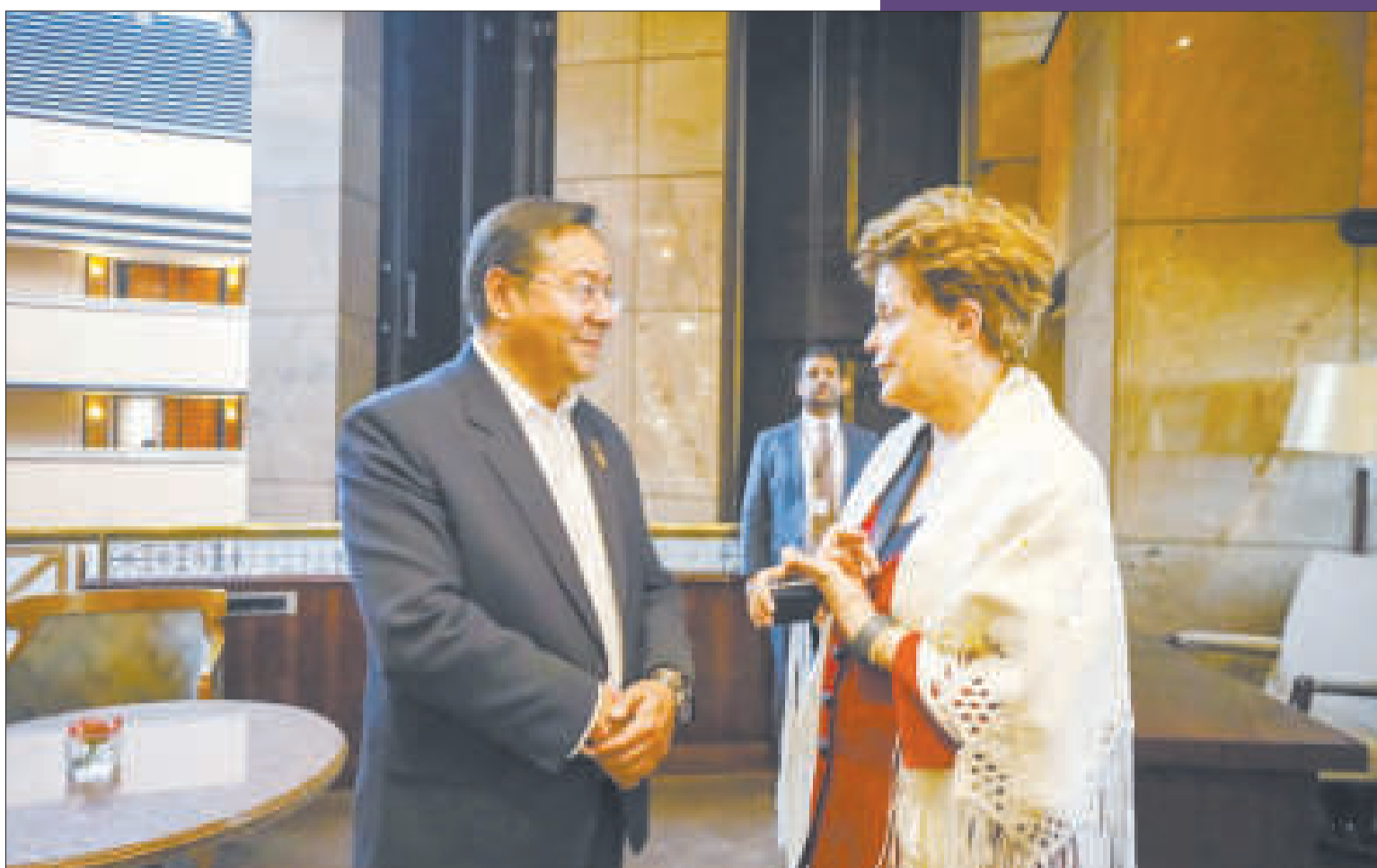
El presidente Luis Arce se reunió el año pasado con la presidenta Dilma Rousseff, en Río de Janeiro, Brasil.