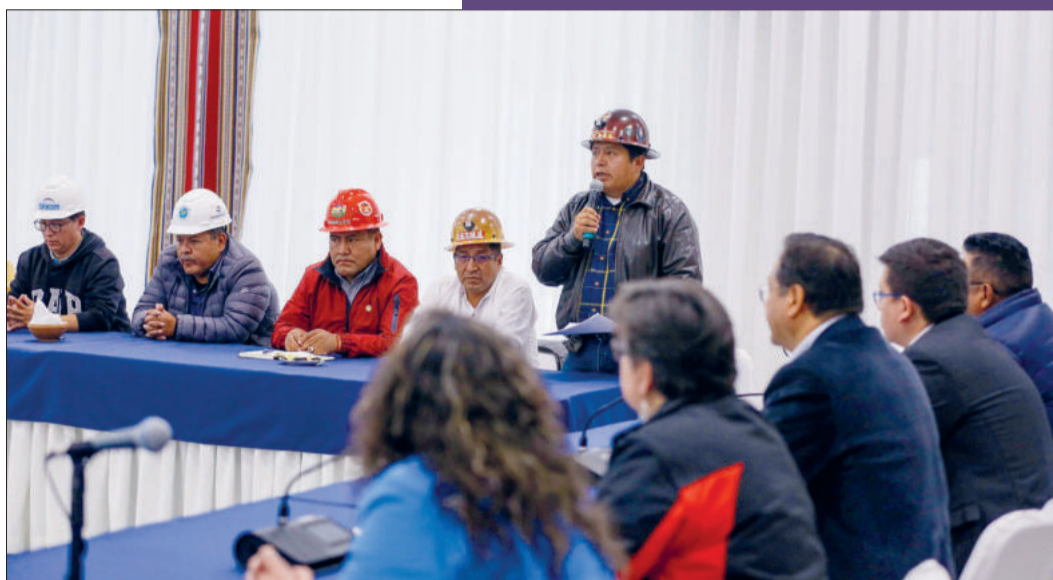
El máximo dirigente de la COB explica el pliego al Ejecutivo.