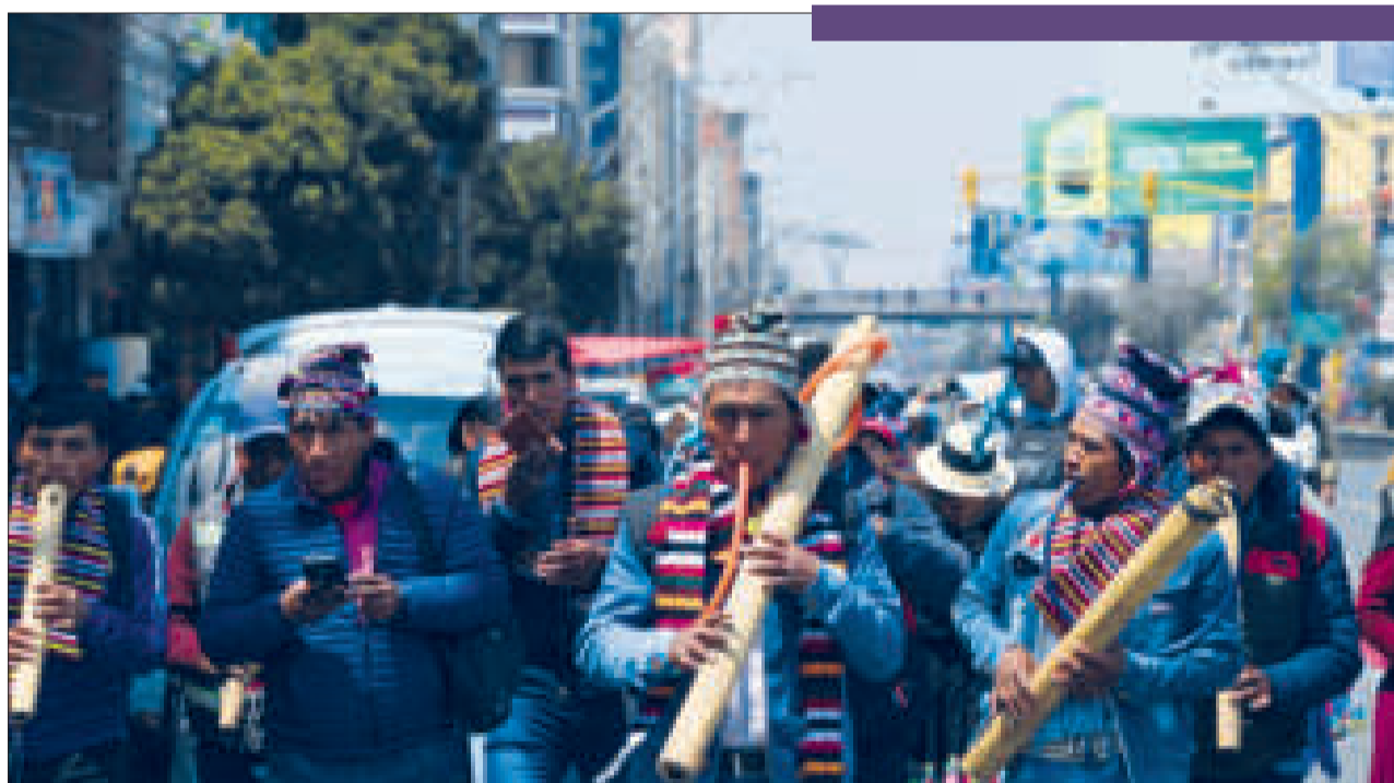
Música autóctona en el cabildo.

“Hay todavía muchos más episodios que observar, este es un punto de inflexión que se ha cerrado con un cuadro bastante interesante para analizar. Uno podría haber pensado en el análisis solamente sobre el cabildo y sus repercusiones, pero hubo acciones previas al cabildo que fueron parte del análisis inevitablemente. Estoy hablando del escenario de violencia y de confrontación que se presentó en el trópico de Cochabamba hacia las delegaciones que estaban viniendo a La Paz”, dijo al aludir al bloqueo a más de 100 buses que partieron de Santa Cruz y que no pudieron llegar a La Paz.