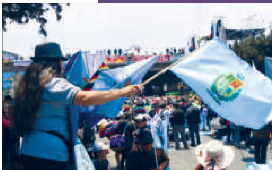
Delegaciones de Cochabamba con su bandera departamental.