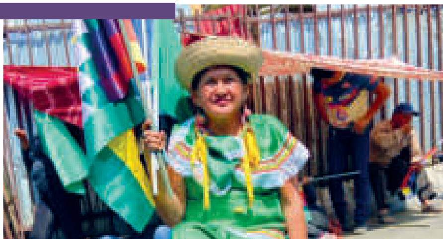
Una mujer del oriente.