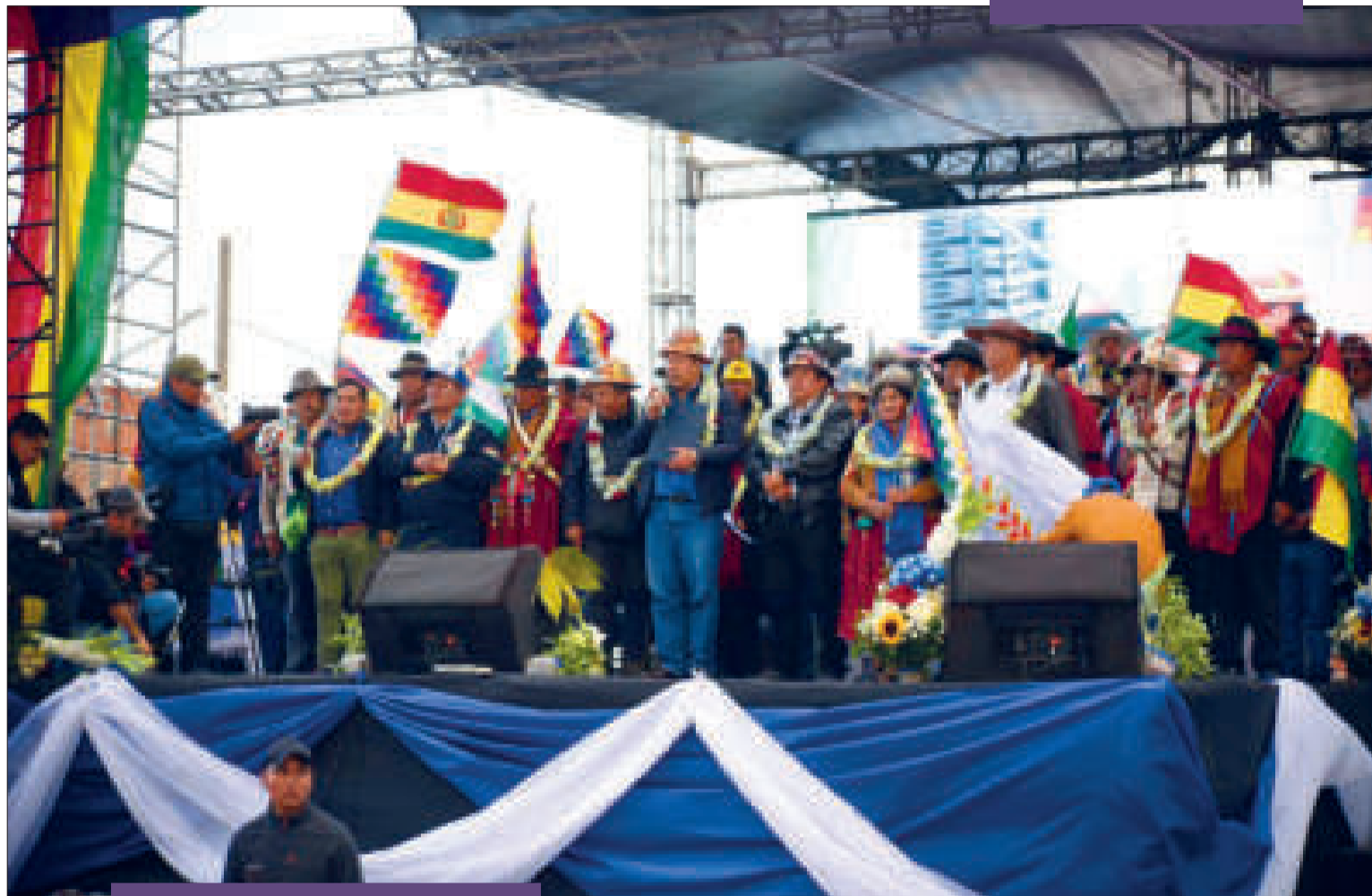
El Jefe de Estado se dirige a la multitud que asistió al cabildo.