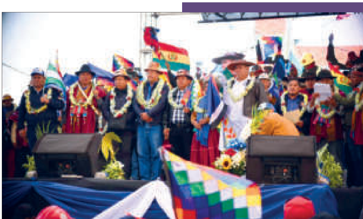
Los mandatarios en la tarima de oradores.

Frente a las múltiples crisis que vive el mundo. Crisis financiera, productiva, climática, hídrica, alimentaria, sanitaria, energética, de valores, desde Bolivia convocamos a los líderes del mundo a luchar contra el capitalismo, el antropocentrismo y valorar los códigos de vida de las culturas milenarias para cons- ▶