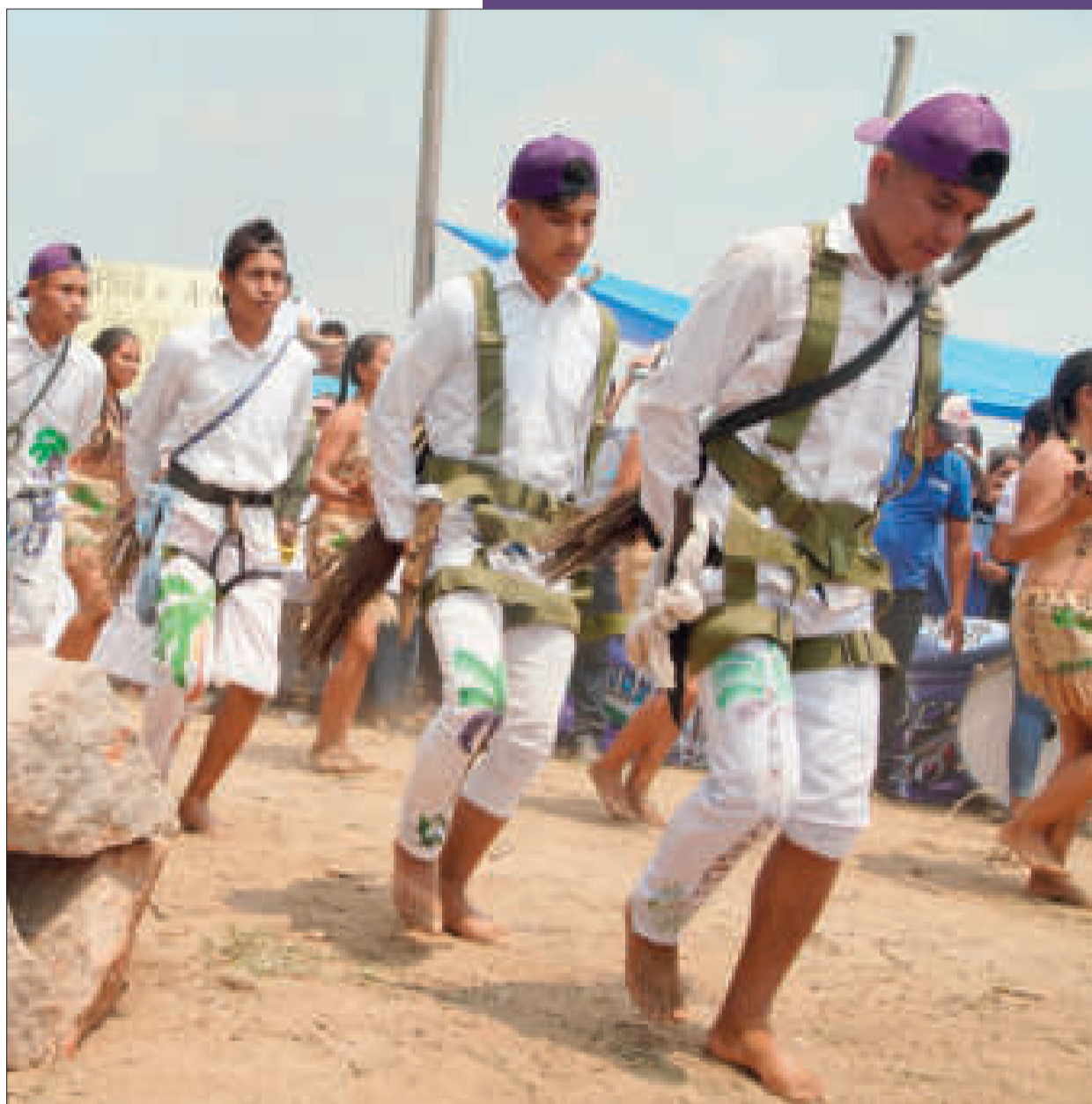
Un grupo de jóvenes presenta una danza indígena.