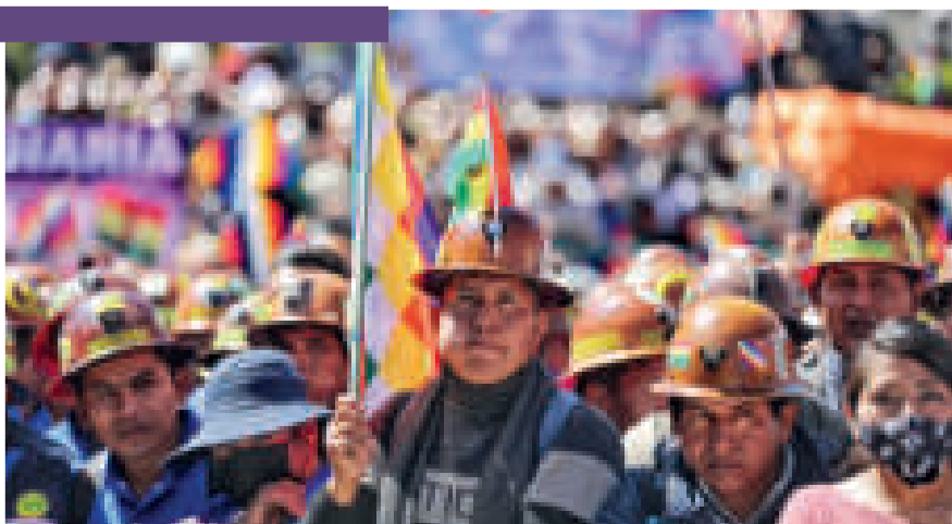
El sector minero anunció su participación en el cabildo.