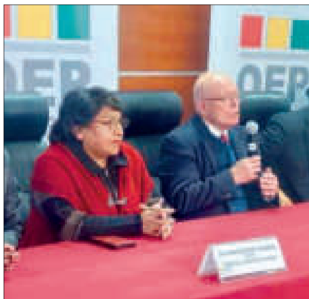
Miembros del TSE.

“Nosotros no vamos a tomar ninguna acción, más al contrario, los verdaderos fundadores del Instrumento Político, los entes matrices que han convocado a un cabildo para el 17 de octubre son quienes van a tomar decisiones; ese cabildo tomará determinaciones sobre el destino del Movimiento Al Socialismo”, señaló.