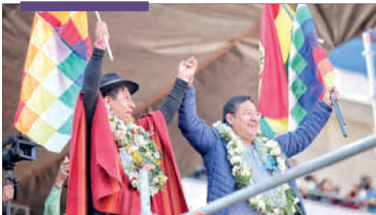
Los mandatarios bolivianos en un acto público.

Lo mismo hicieron los interculturales de Bolivia, quienes ratificaron su asistencia para el gran cabildo de El Alto.