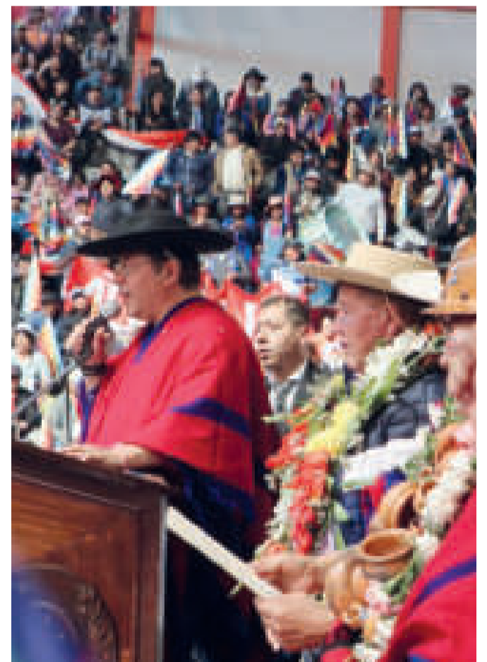
Lucho se dirige a las organizaciones sociales en un acto público.

En Santa Cruz, el Presidente también se reunió con dirigentes de la Federación De-