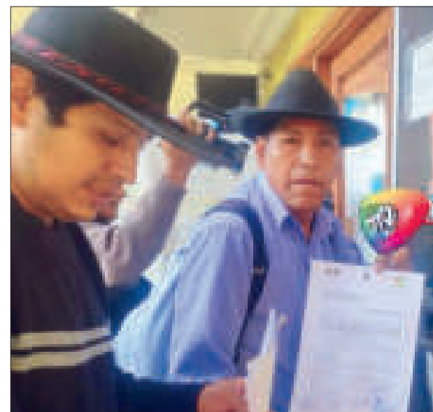
Petición oficial al ente electoral.