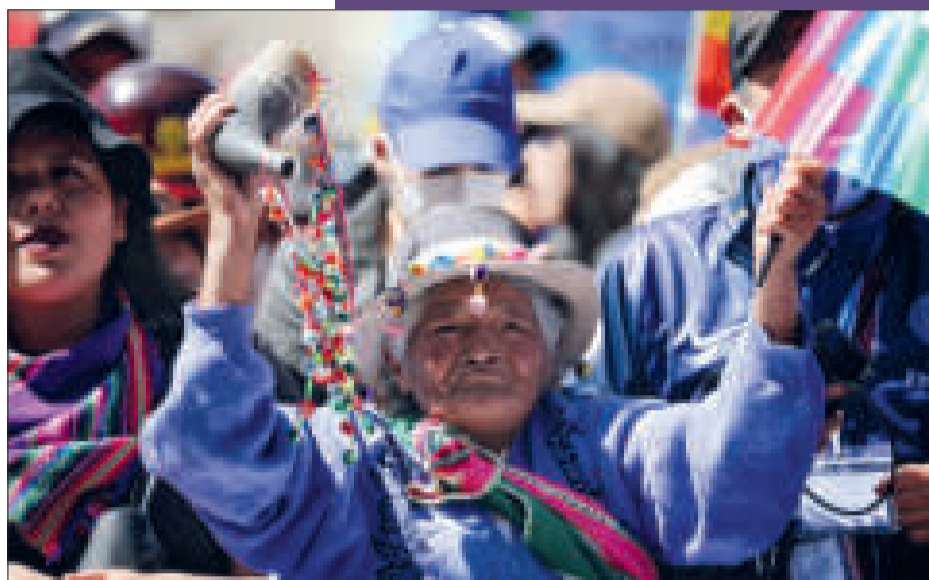
Los pueblos indígenas estarán en el evento de El Alto. // FOTO: COMUNICACIÓN PRESIDENCIAL

Movimientos sociales en la plaza San Francisco. // FOTO: COMUNICACIÓN PRESIDENCIAL