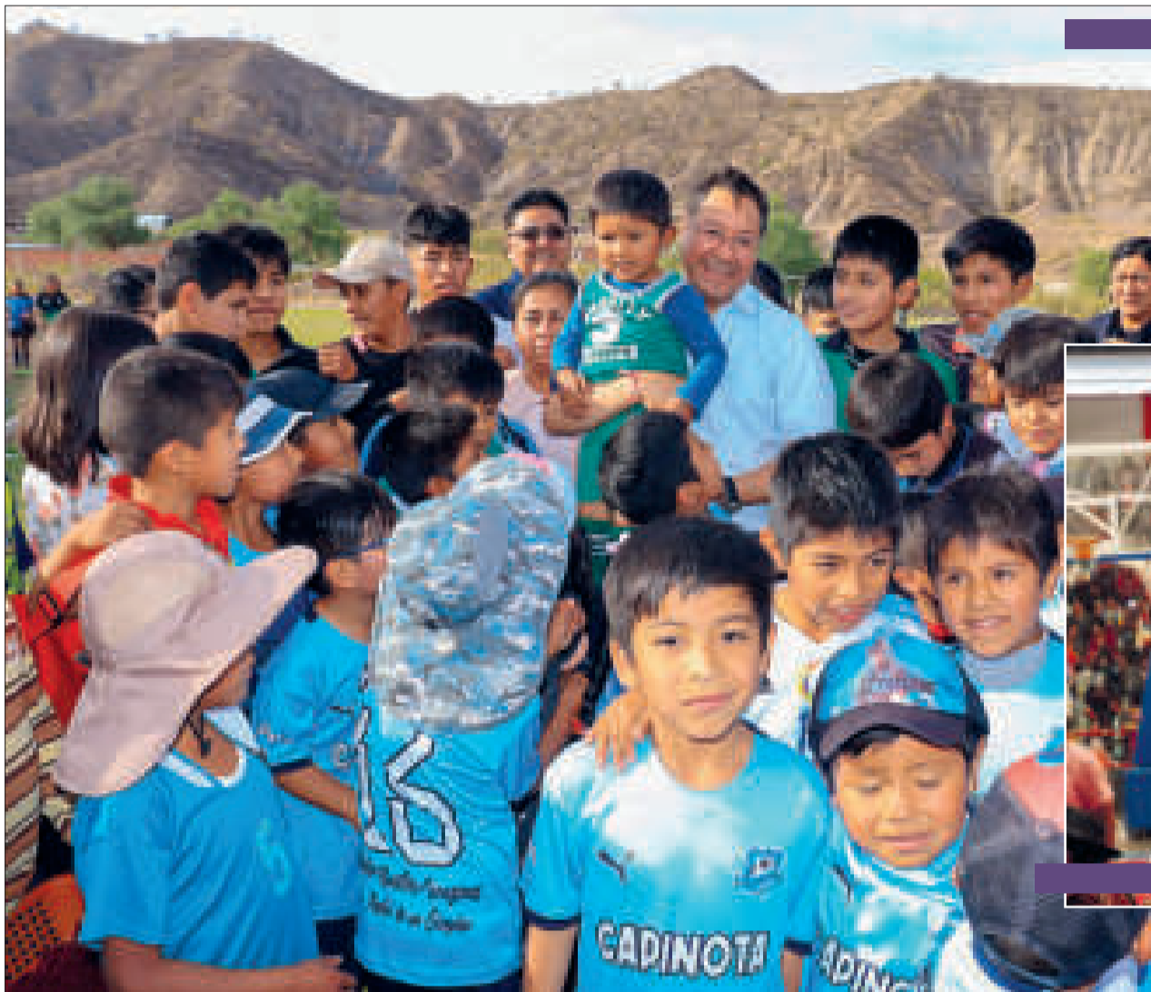
El Presidente con la población en una zona rural de Cochabamba.