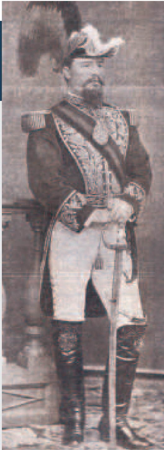
General Hilarión Daza, presidente de Bolivia (1876-1879). Es considerado el único responsable de la Contramarcha de Camarones, fue derrocado y exiliado a Europa.

marcha, se presentó el señor Coronel Eliodoro Camacho, el que después del saludo de costumbre y con la confianza con que siempre lo he tratado, me dijo: