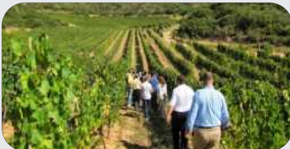
La mayoría de los visitantes de Tarija opta por este atractivo para explorar las bodegas y los viñedos.

Por otro lado, a partir de junio, julio y agosto se realiza la poda en los viñedos, un proceso que embellece los paisajes con una variedad de colores. Durante estos meses también se registra un aumento en la afluencia de turistas interesados en presenciar este proceso en las bodegas y viñedos locales.