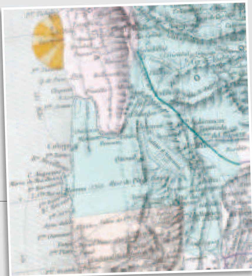
El Litoral de Bolivia. Parte del mapa titulado 'Pérou, Bolivie', editado por Eugène Andriveau-Goujon, París, 1868.

Además, estos textos se encuentran enriquecidos con grabados de Antofagasta, dibujados por Taylor; Lago Titicaca y ruinas del templo de las vírgenes en la Isla Coati, dibujo de G. Vuillier, basado en una fotografía de P. Pelet; paisaje de los Yungas, dibujo de G. Vuillier; Mojos, dibujo de J. Lavée, basado en una fotografía; El Palacio de Gobierno de La Paz, dibujo de Taylor, a partir de una fotografía de P. Pelet y Tocopilla, dibujo de Taylor.