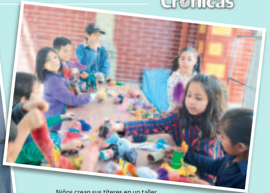
Niños crean sus títeres en un taller.