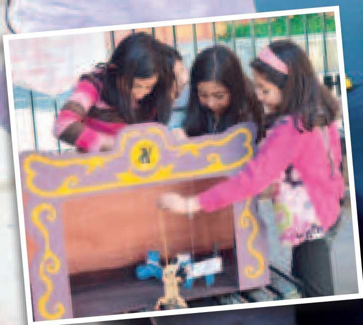
Función de títeres Valle Grande.