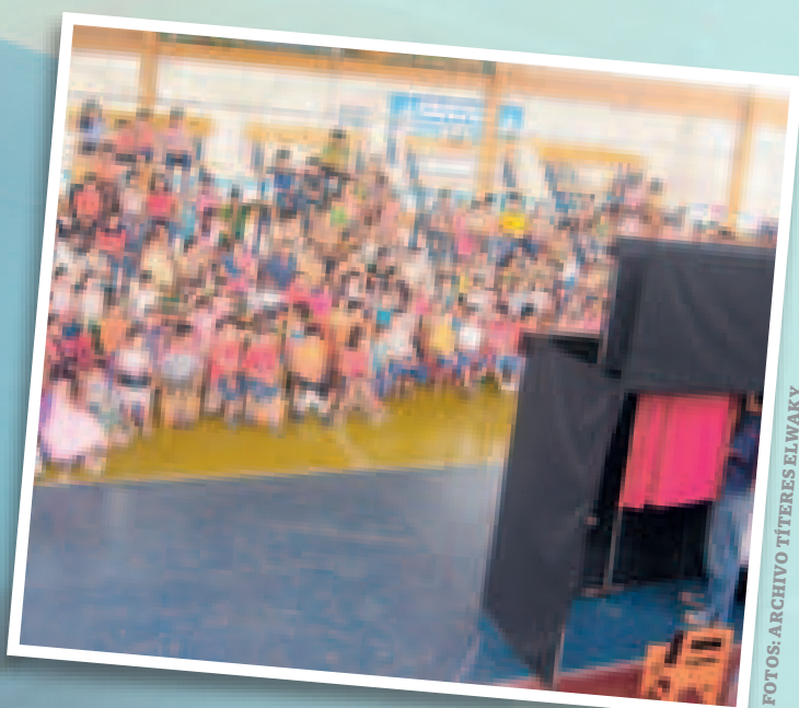
Espectáculo de títeres en Montero.