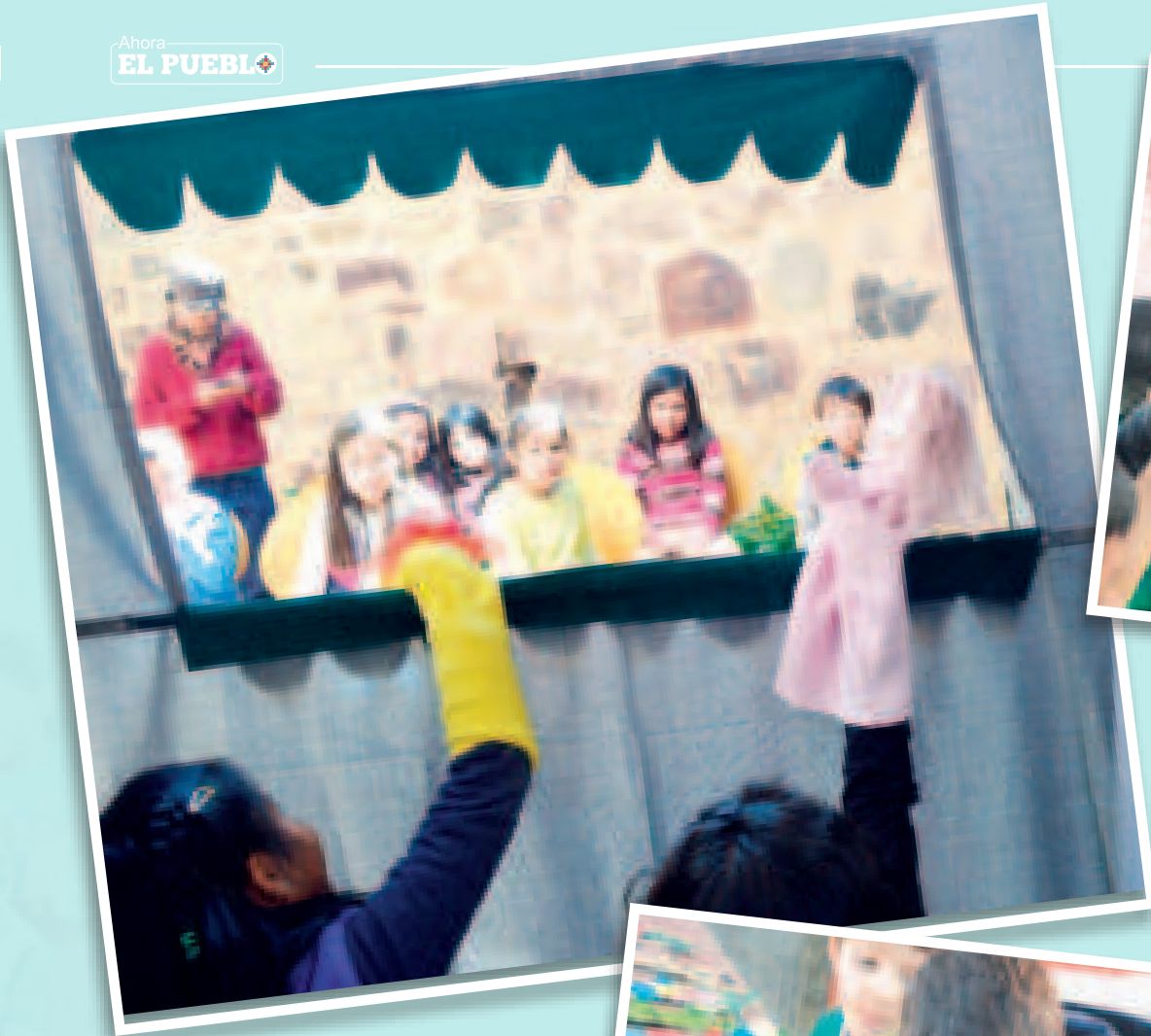
Taller de títeres, donde los niños potencian su creatividad.