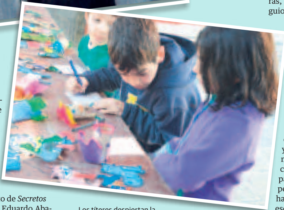
Los títeres despiertan la creatividad desde la infancia.