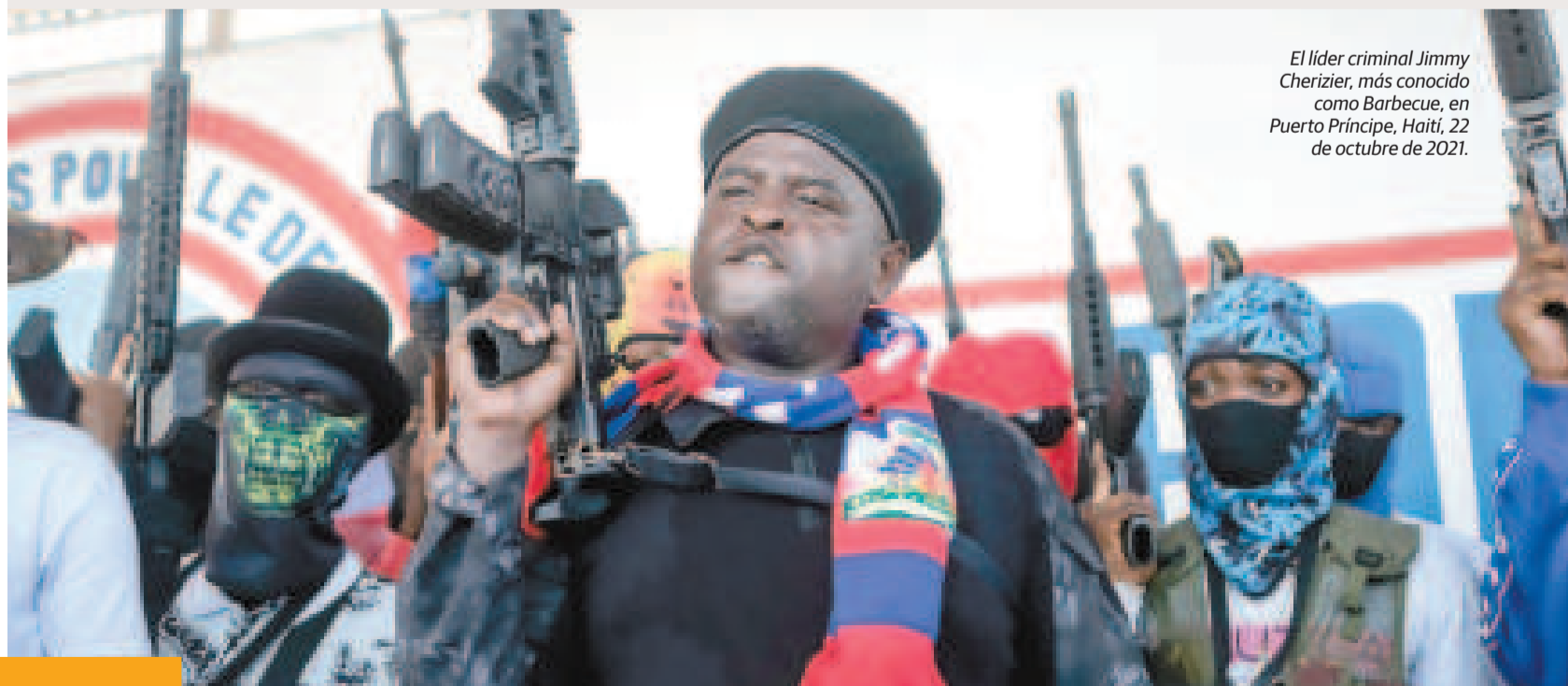
El líder criminal Jimmy Cherizier, más conocido como Barbecue, en Puerto Príncipe, Haití, 22 de octubre de 2021.

La ONU considera que actualmente hay más de cinco millones de haitianos, la mitad de la población total, en situación de “inseguridad alimentaria aguda”.