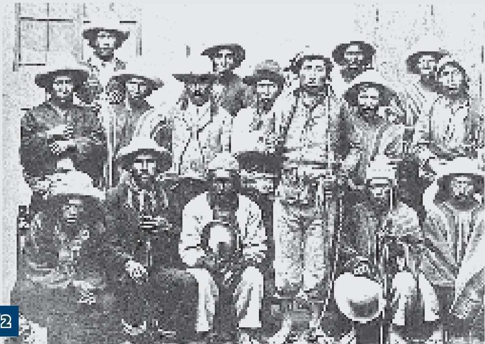
Los cabildos indígenas fueron importantes en la lucha armada.

Su contribución fue esencial para el éxito del movimiento de independencia en la región.