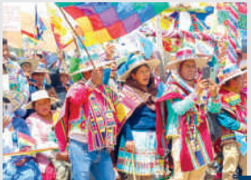
Los pueblos indígenas confirmaron su presencia en la urbe alteña.