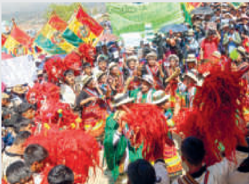
Se aguarda una gran asistencia al evento.