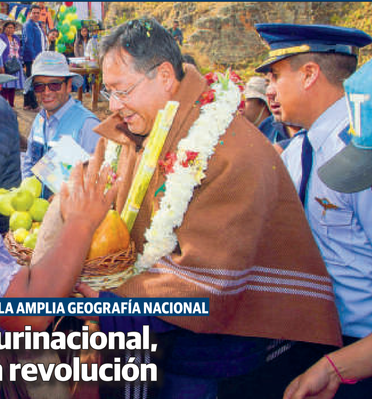
El presidente Luis Arce recibe el reconocimiento del pueblo.