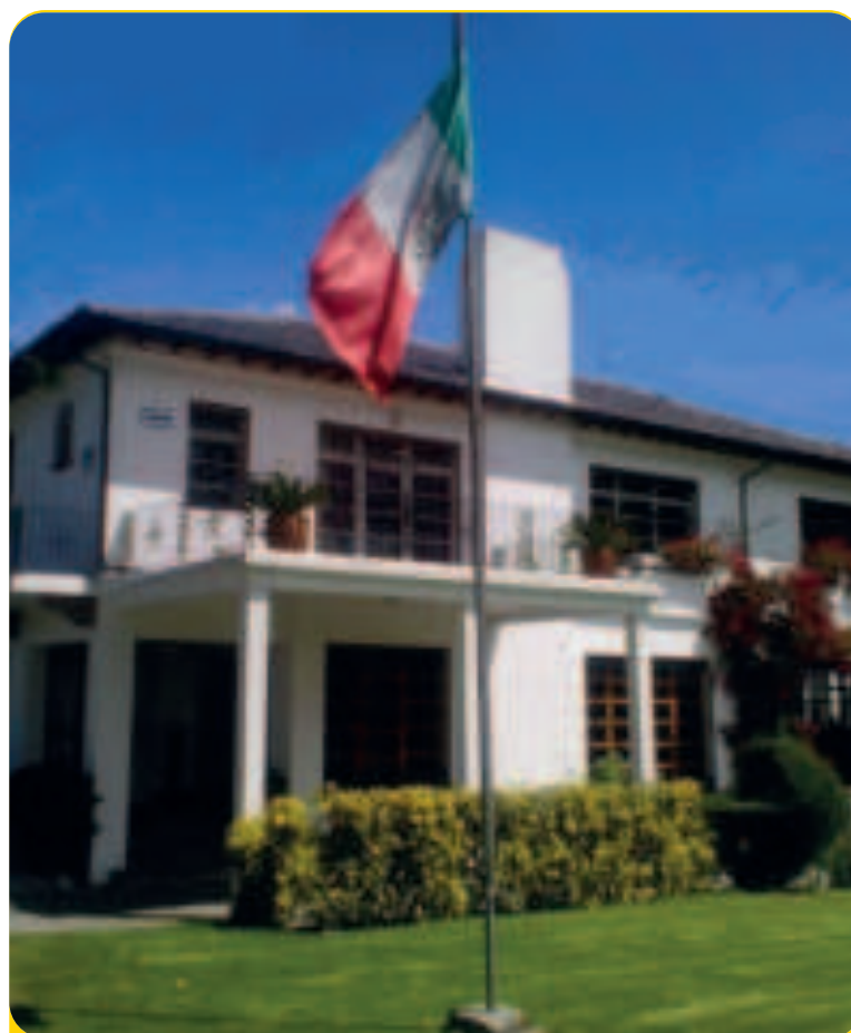
La Embajada de México en Ecuador.

México solicitó a la CIJ medidas provisionales para que Ecuador garantice la seguridad e inviolabilidad de la Embajada de México, que mantiene bienes y archivos en su interior.