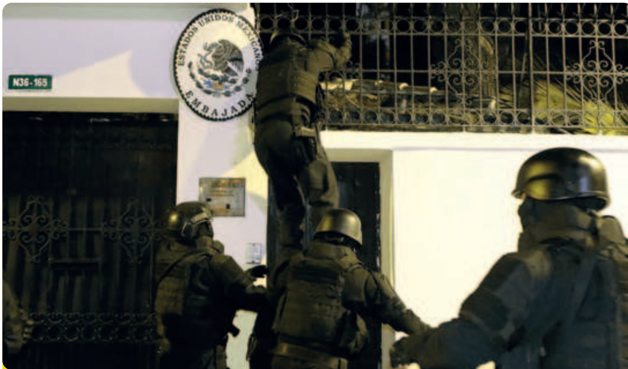
Irrupción de la Policía de Ecuador a la sede de la Embajada de México en Quito, la noche del 5 de abril.

En la sesión extraordinaria del Consejo Permanente de la ▶