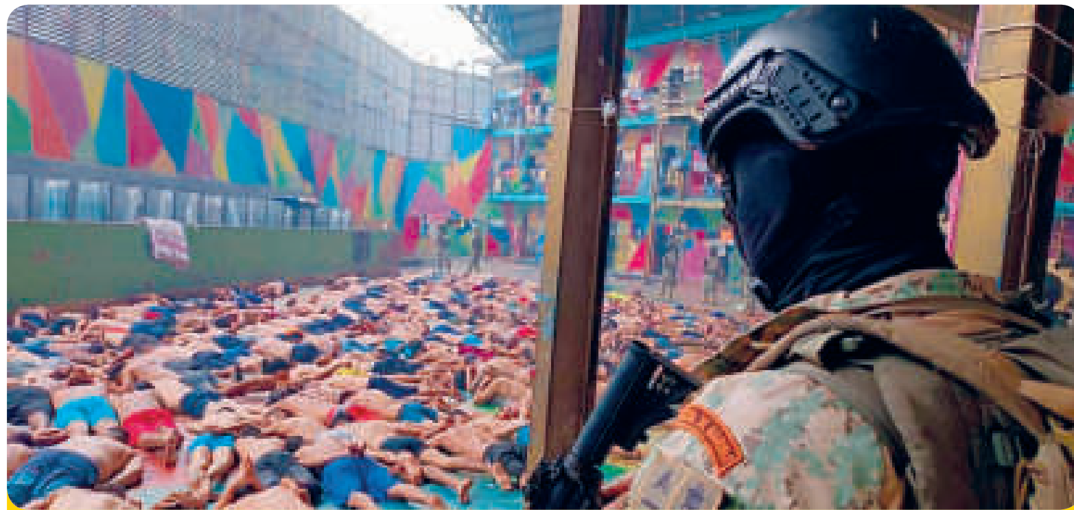
Control militar en los penales ecuatorianos.

En una escalada de violencia en Ecuador, que el presidente Daniel Noboa ha ca-