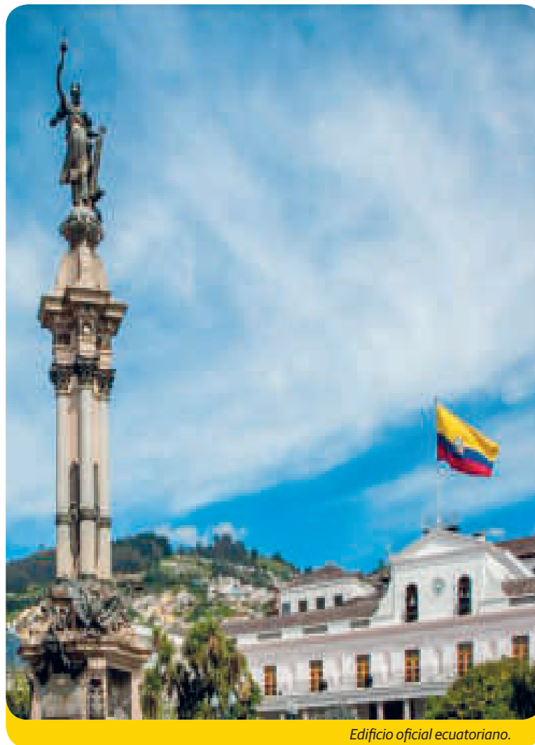
Edificio oficial ecuatoriano.

Costará unos 800 millones de dólares, dijo, aunque Estados Unidos aportará 200 millones de dólares en armas nuevas para el ejército ecuatoriano.