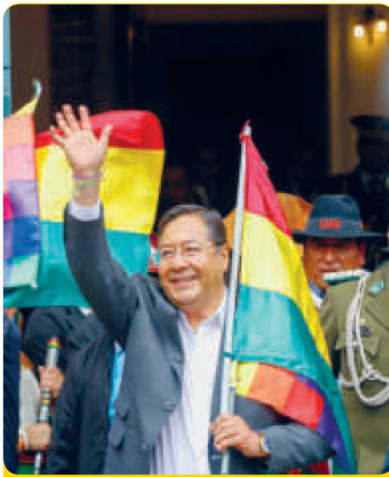
Luis Arce en puertas del Palacio Quemado.

“El objetivo es cuidar los combustibles que son subvencionados con los impuestos que pagamos todos los bolivianos”, sostuvo.