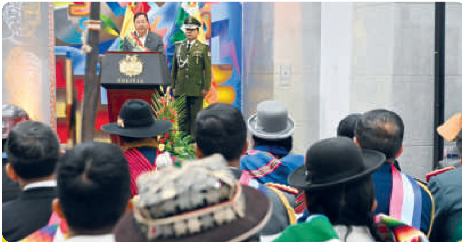
El Presidente en su mensaje a la nación el 22 de enero.

Lo más difícil siempre es producir y ese es el camino que el Gobierno eligió, dijo Arce, al referirse a la construcción de las dos plantas de biodiésel, una de HVO de diésel ecológico y otra planta de alcohol anhidro.