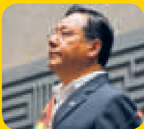
Luis Arce Catacora Presidente

“Nuestro gobierno no reduce salarios, ni recorta la inversión pública, ni privatiza nuestras empresas y recursos naturales, ni levanta la subvención a los hidrocarburos”.