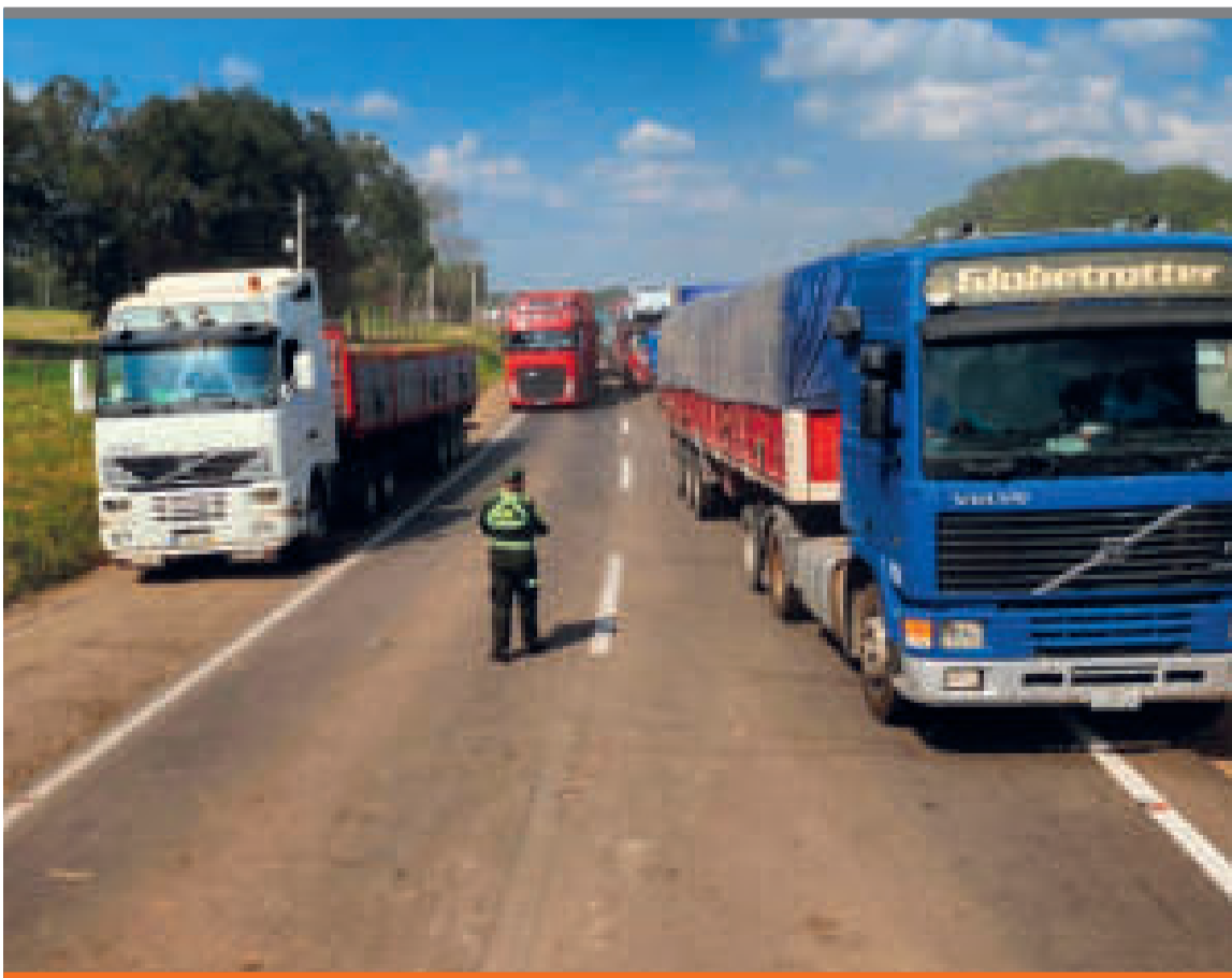
● La construcción de la vía favorece a los productores de la región.

kilómetros es la extensión total de la carretera Las Cruces-Buena Vista.