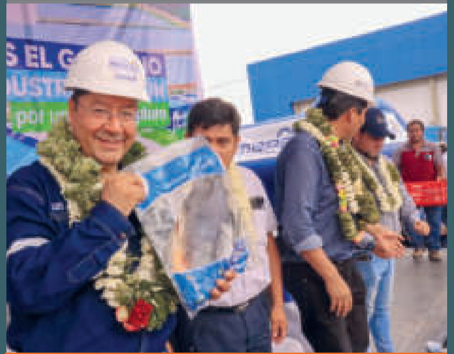
● El tambaquí es uno de los peces nutricionalmente más completos de la región.

En particular, el tambaquí es uno de los pescados más completos en cuanto a vitaminas, grasas y nutrientes, además de un excelente sabor en la preparación de los platos.