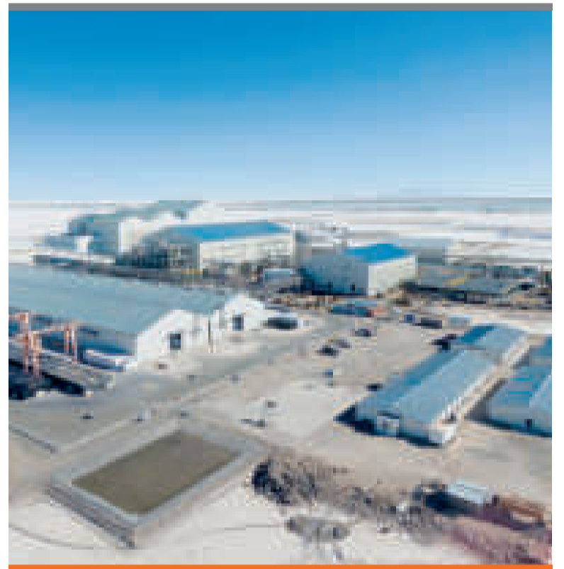
● Potosí. El complejo está emplazado en la localidad de Llippi.

DE AGOSTO, ESTA CARTERA DE ESTADO CONFIRMÓ QUE LA PLANTA INICIÓ LA ETAPA DE ARRANQUE DE EQUIPOS.