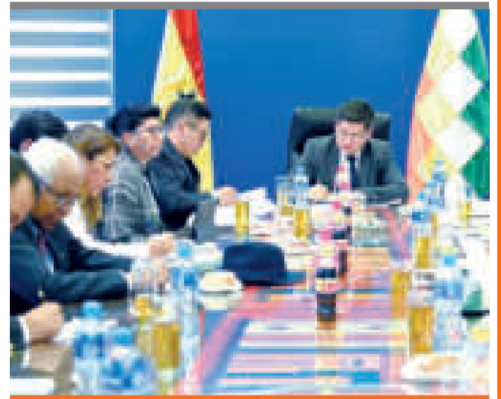
● Autoridades durante la jornada de trabajo.