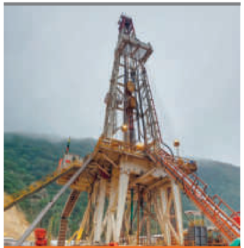
● Un pozo exploratorio operado por YPFB.