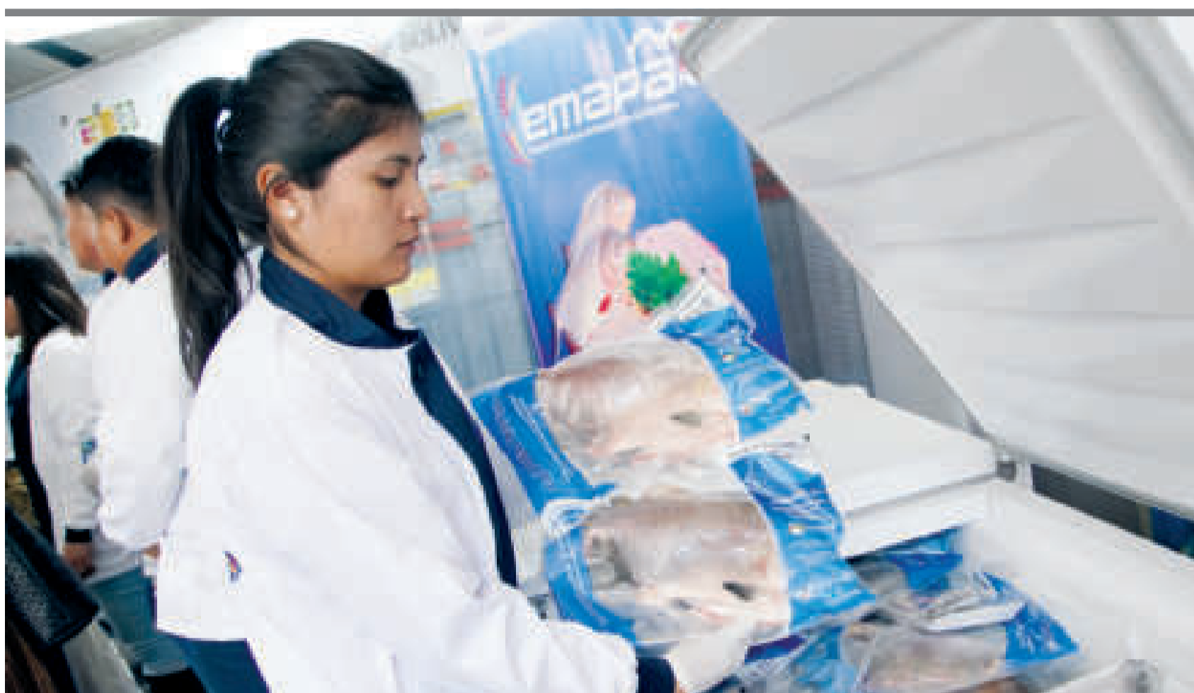
● Los productos del Complejo Industrial Piscícola de Chimoré son de alta calidad.

“Es una planta muy moderna, con equipamiento que va a marcar la diferencia en la calidad del producto. Tenemos tambaquí, pacú y surubí, que van a ser elaborados y envasados al vacío, y van a recorrer todos los puntos cardinales del país”, indicó la autoridad en esa oportunidad.