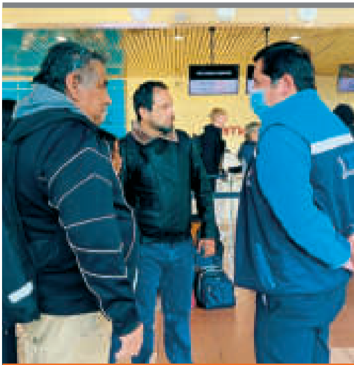
● Control de la ATT en terminales aéreas.