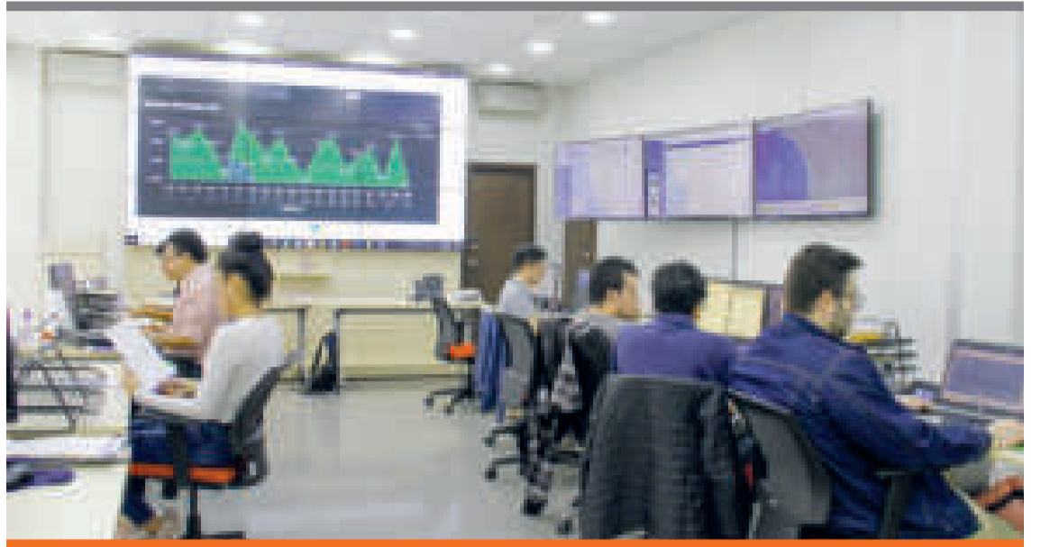
● Seguimiento. Personal que trabaja en el Centro de Monitoreo de YPFB.