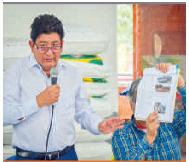
● La ABC efectuará una evaluación en tramos desde Colomi hasta Villa Tunari.