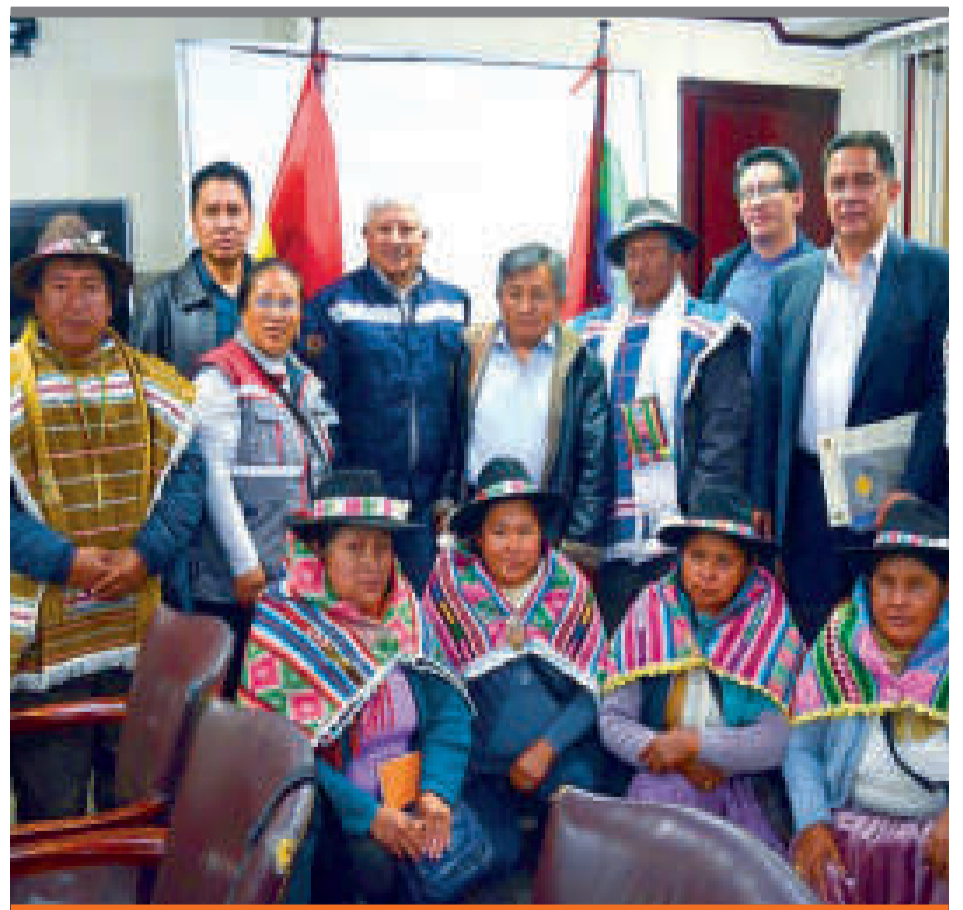
● ACTO. Los representantes de la comunidad Chipaya junto a autoridades locales y de Comibol.

MILLO- NES DE DÓLARES, APROXIMA- DAMENTE, ES LA INVERSIÓN PREVISTA PARA LA PLANTA.