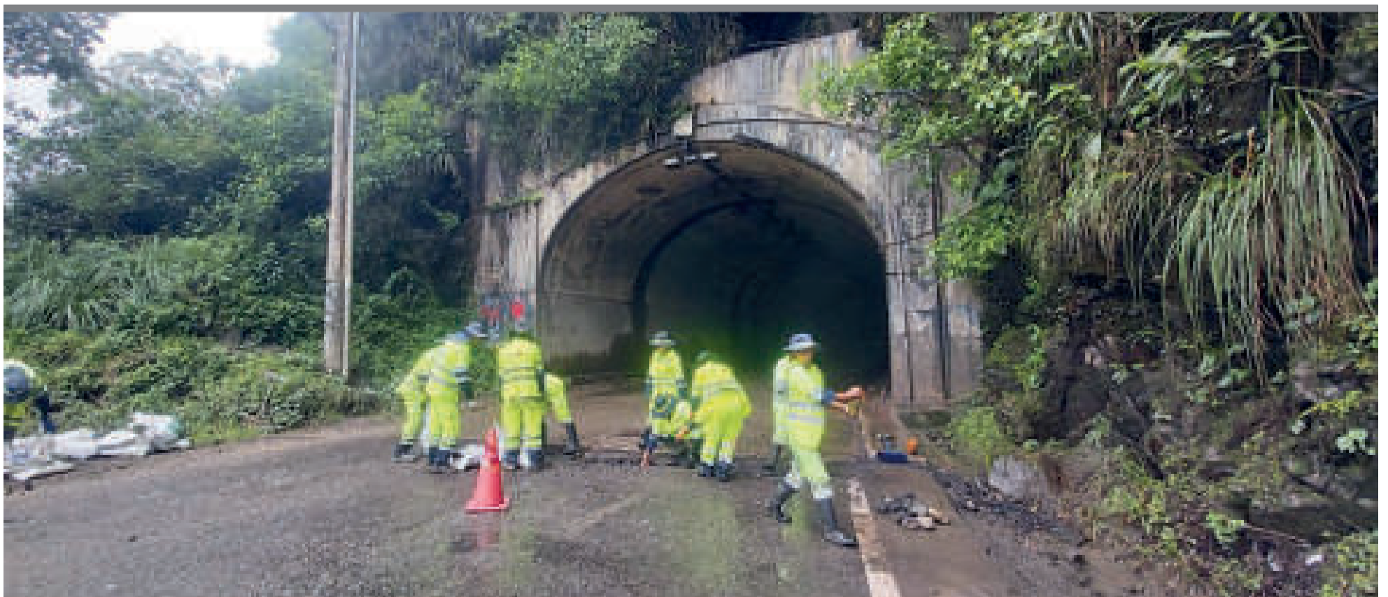
● Se realizará limpieza de derrumbes, de plataforma, habilitación de defensivos en las estructuras mayores, entre otros trabajos.