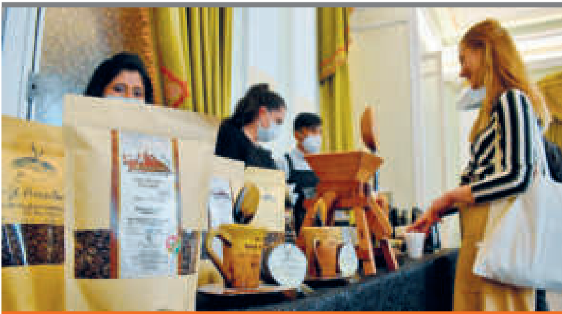
● EL TORNEO durante el desarrollo de la anterior versión.