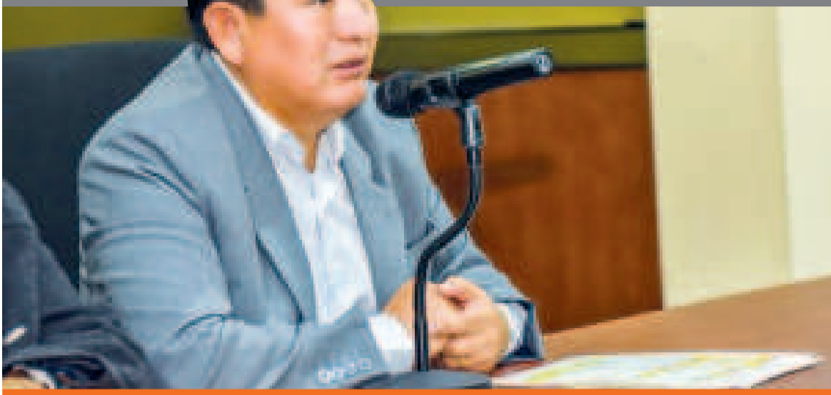
● El ministro de Obras Públicas, Édgar Montaño, en conferencia de prensa.