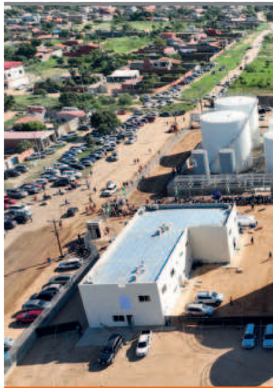
● La factoría cuenta con 34 tanques con capacidad de 6,4 millones de litros para recibir

“Es una obra fundamental y necesaria no solo para la comodidad de toda la población de Mairana, sino también importantísima para preservar el medioambiente y cuidar el agua y, sobre todo, la producción misma del municipio puesto que la contaminación puede afectarla”, destacó el Jefe de Estado, en el acto de entrega de las obras.