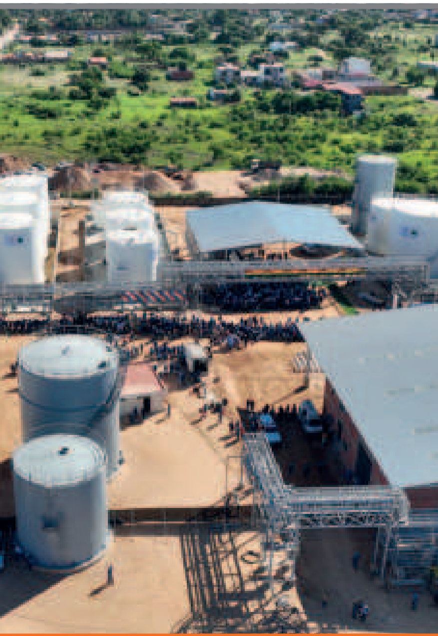
cción y 3,1 millones de litros para despacho de combustibles.