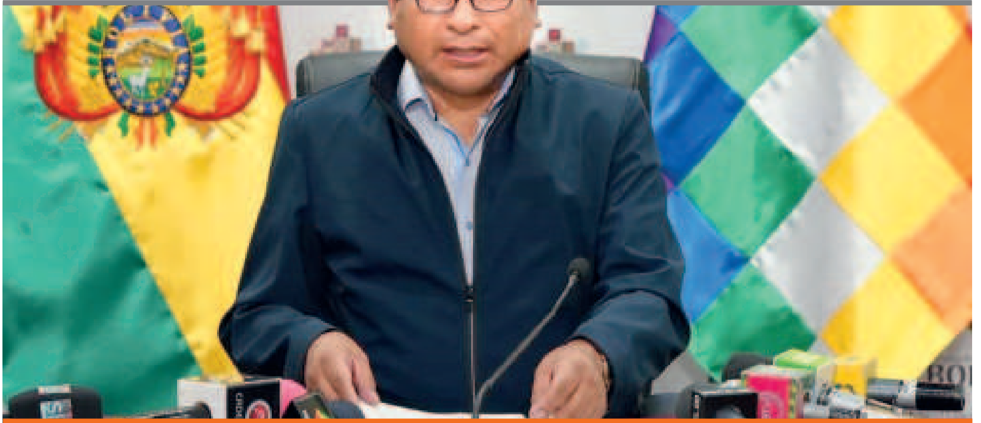
● El ministro de Desarrollo Productivo, Néstor Huanca, en conferencia de prensa.