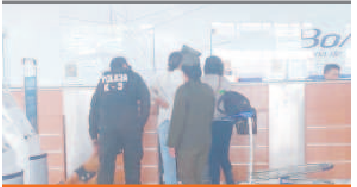
● La ATT trabajó en estrecha colaboración con todas las partes involucradas en el sistema de transporte.