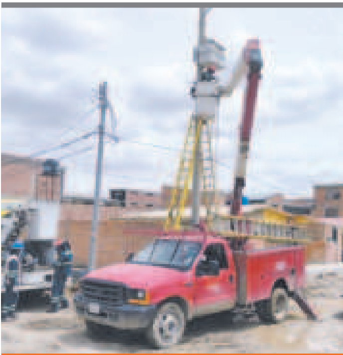
● Los trabajos de la estatal de electricidad.