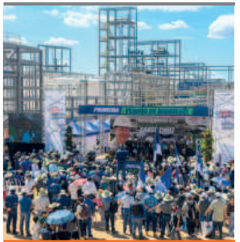
● Inauguración de la Planta de Biodiésel I, en Santa Cruz.

PROMESA ELECTORAL CUMPLIDA POR EL PRESIDENTE LUIS ARCE.