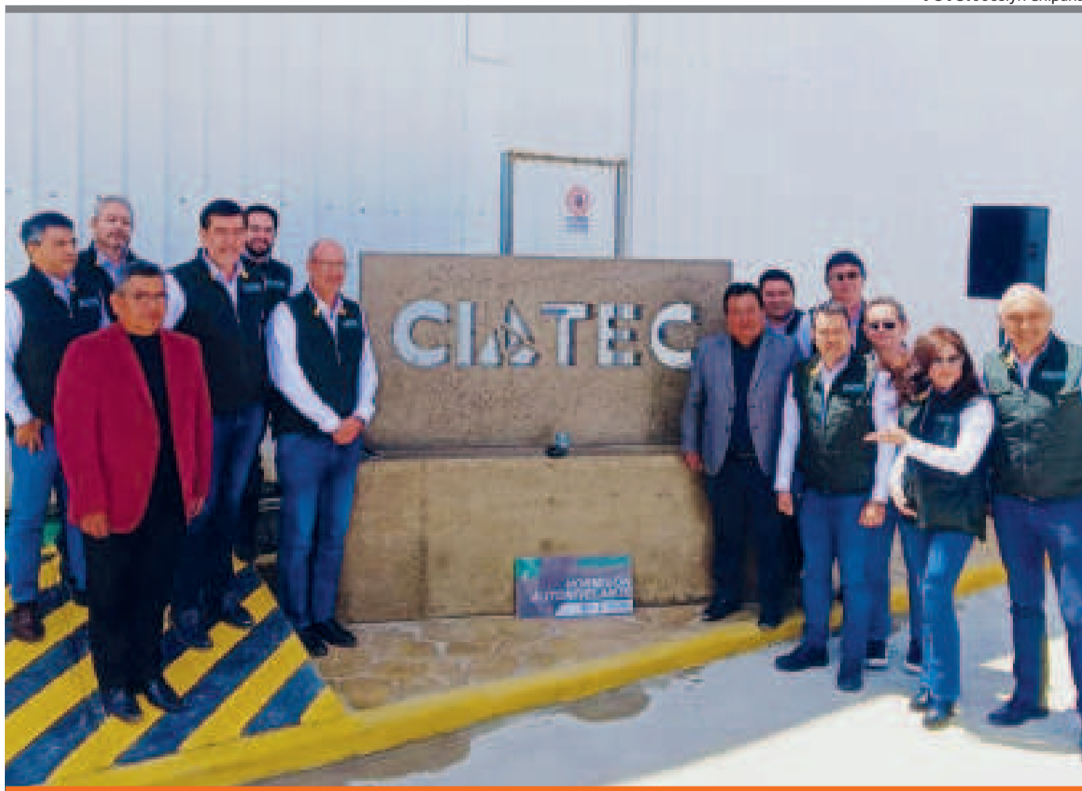
● Ciatec se encuentra en la carretera a Viacha.

También innovó con bloques de cemento que tienen una densidad considerable, son muchos más pesados y están destinados a la construcción de estructuras en las que se utiliza energía nuclear.