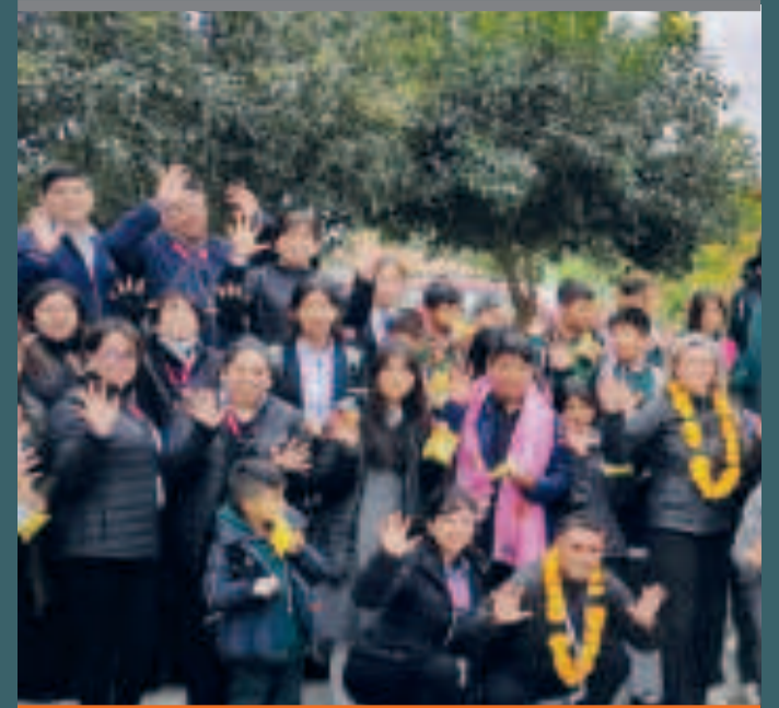
● Los representantes de los beneficiarios junto a directivos de Entel.