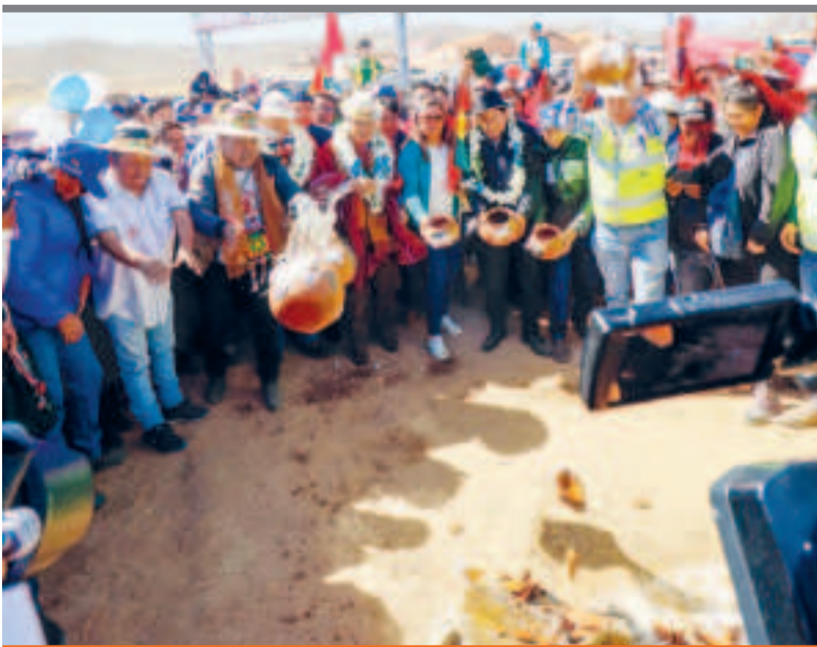
● La ch'alla del inicio de obras del tramo I de la doble vía Oruro-Challapata, el lunes.