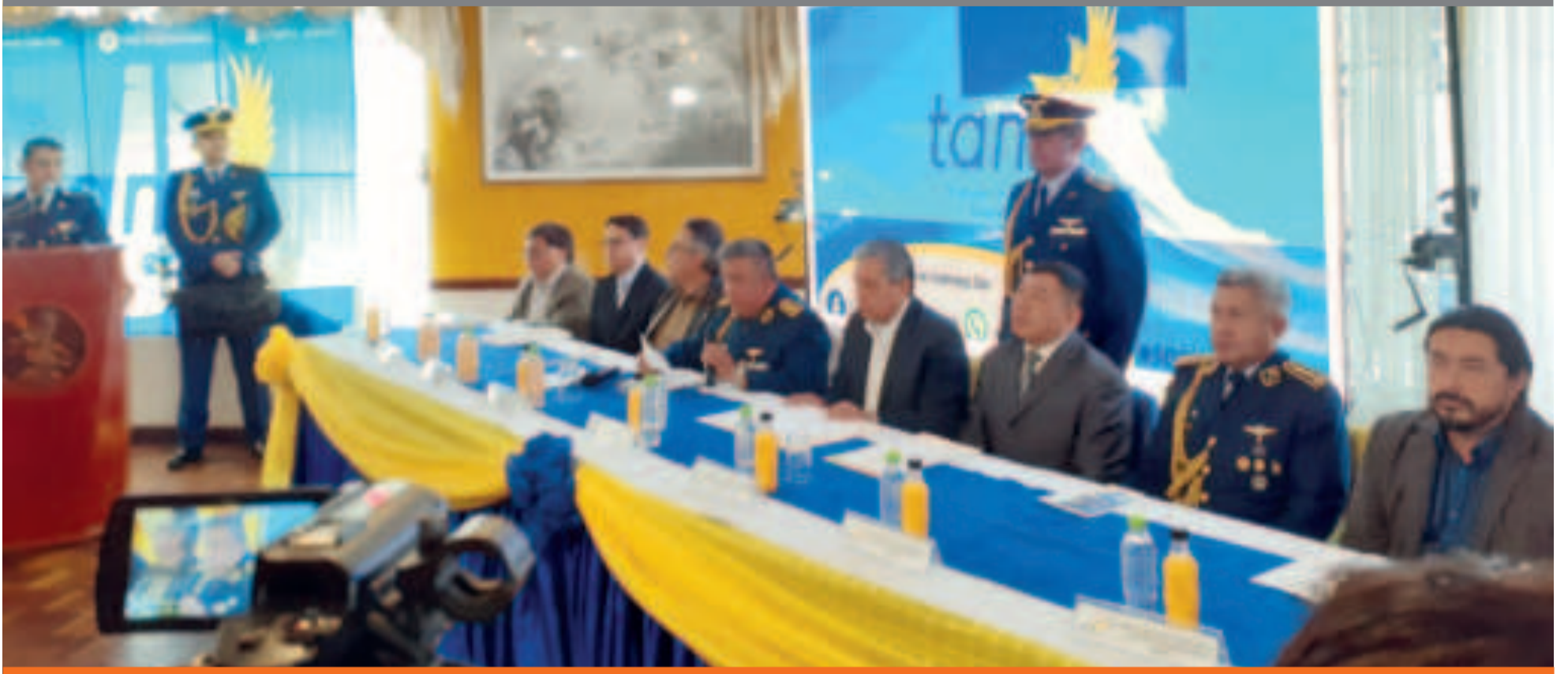
● El acto de reanudación de operaciones de la firma aérea estatal en La Paz.