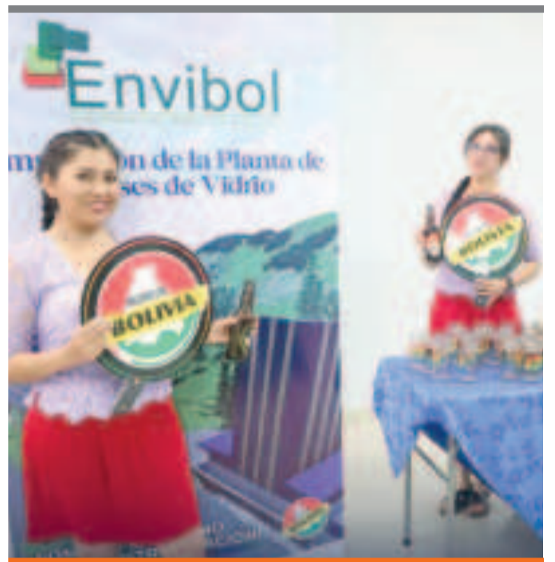
● Envibol es una de las empresas más competitivas del Sedem.