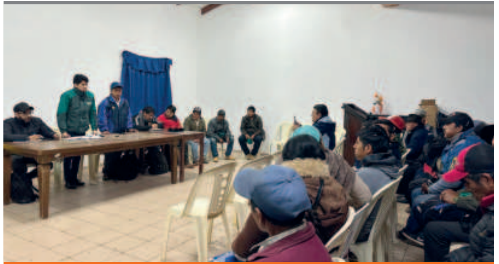
● El diálogo entre autoridades de la ANH y la dirigencia de productores de la provincia Florida y subcentrales.

Asimismo, en el acuerdo, las instituciones competentes— la ANH, la DGSC, el Servicio de Impuestos Nacionales (SIN) y la Fuerza Especial de Lucha Contra el Narcotráfico (FELCN)— se comprometieron a conformar brigadas en los municipios de la provincia Florida para el registro de los productores. Las fechas y lugares serán coordinados con el representante de cada subcentral, incluida la renovación de los registros.